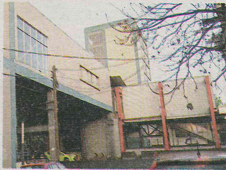
El proyecto innovador resultó un fracaso

"Accedimos ante las malas condiciones de los bajo puentes. Han sido años de abuso por parte de la empresa Accesorios Constructivos S.A. de CV. (Acco) al invadir Plaza Victoria con camiones y usarla como bodega de materiales y ofici-