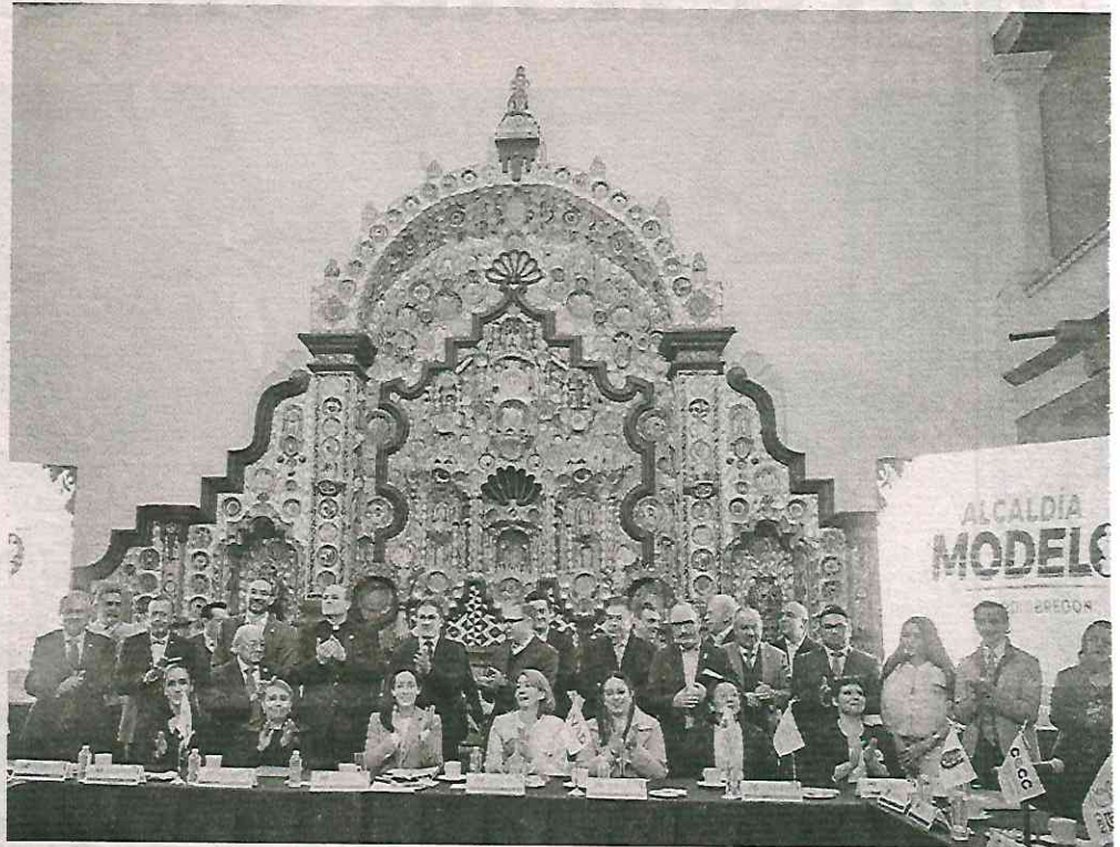
Clúster Universitario de Alto Nivel en alcaldía Álvaro Obregón

Dentro de ese marco se dará una colaboración con instituciones educativas y la alcaldía como un esfuerzo para ejecutar un trabajo compartido para detonar ideas a favor de los estudiantes, academia e investigación, para atraer la inversión de empresas en una parte importante de la