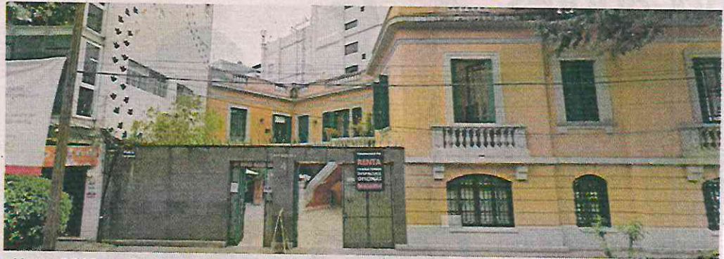
Hasta 2022, en Cuernavaca 4 se ofrecía la renta de oficinas; ahora opera como un hotel.

En el predio se ubica actualmente el Hotel Casa Cuenca, que se promociona como un alojamiento boutique a pocos metros de Paseo de la Reforma y en el que se ofrece hospedaje temporal