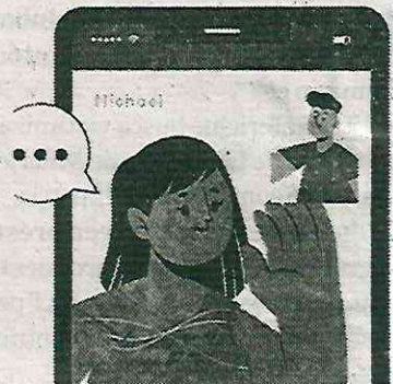
Dejará gestionar expedientes