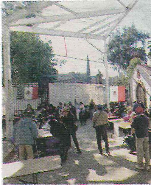
La elección se llevó a cabo el 1 de diciembre