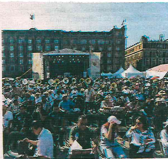
El festival iniciará el viernes 21 de marzo

En el cartel, precisó, también están considerados artistas y agrupaciones como Silverio, Bersuit Vergarabat, Las Ultrasónicas, San Pascualito Rey, Internacional Carro Show, Raymix, Real de Catorce, Instituto Mexicano del Sonido, entre otros.