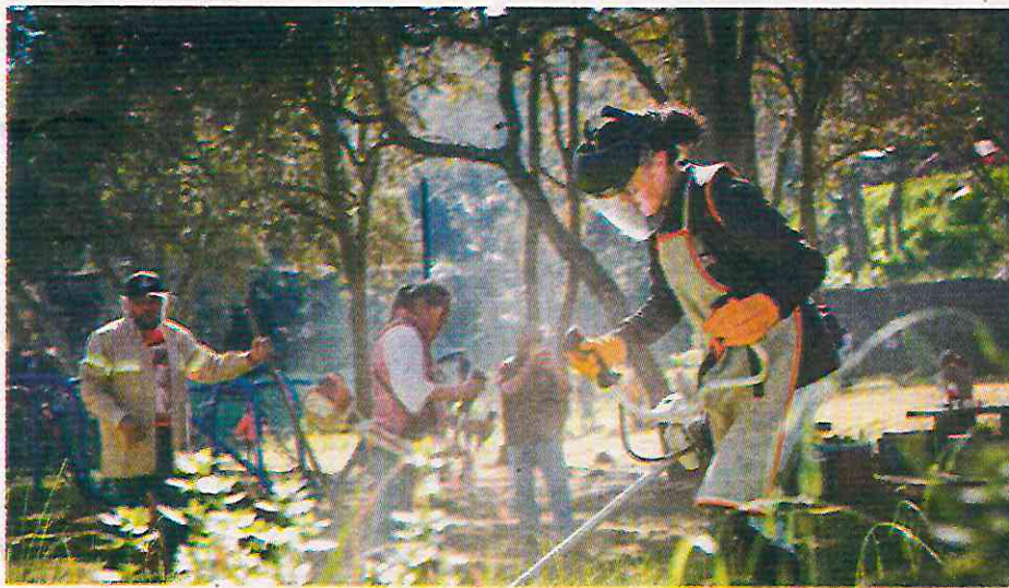
Acciones de mejoramiento en escuelas de Tlalpan.

El gabinete informó que continuará con visitas a los planteles para identificar nuevas áreas de mejora y reforzar la colaboración con docentes, madres y padres de familia. El objetivo es garantizar que la seguridad y la convivencia sigan siendo prioridad en las escuelas de Tlalpan. (Gerardo Mayoral)