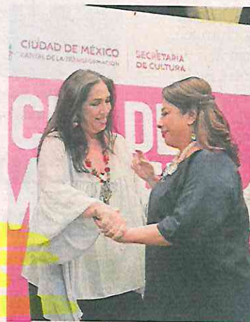
La cantante Regina Orozco se presentará el 21 de marzo en el Zócalo, informó la jefa de Gobierno.

El Festival Noche de Primavera, por primera vez saldrá del primer cuadro de la Ciudad y tendrá sedes en otras alcaldías. Por ejemplo, en el Faro de Oriente, en Iztapalapa, habrá música urbana; en la Utopía Me-