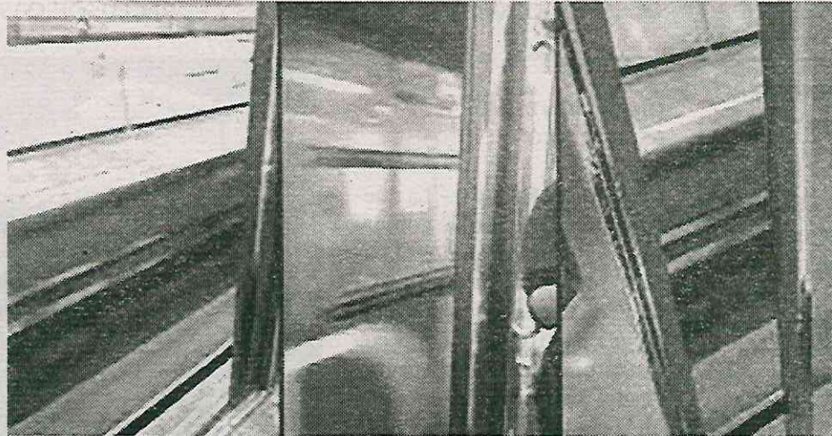
Cada vagón cuenta con cuatro puertas por cada lado de la unidad

usuarios de la Línea 3 del Metro, de Universidad a Indios Verdes, denunciaron una falla en uno de los vagones debido a que un tren avanzó con las puertas abiertas.