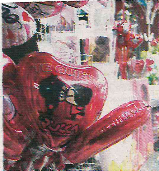
Una cita promedio alcanzaría los 500 pesos