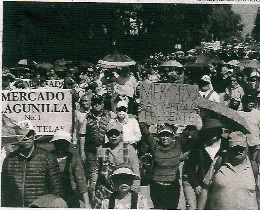
Locatarios se manifestaron el lunes en contra de los nuevos lineamientos