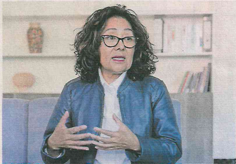
La secretaria del Trabajo y Fomento al Empleo dijo que el Centro de Conciliación Laboral recibe en promedio mil solicitudes de servicio diario.