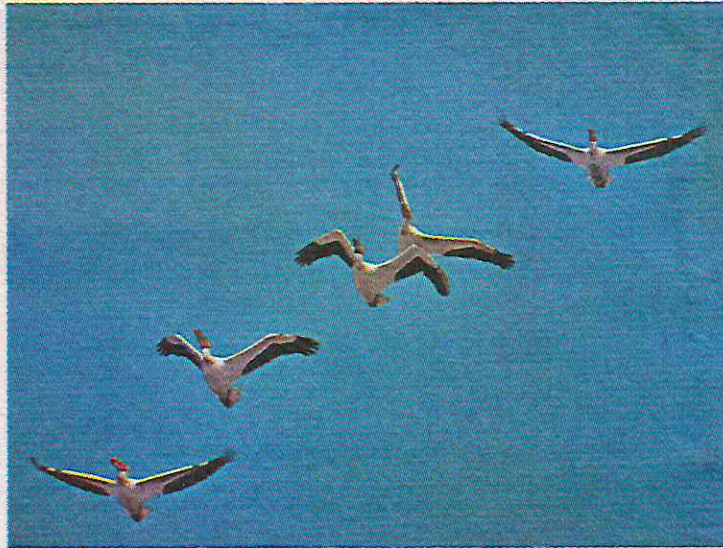
Se han contabilizado hasta 700 ejemplares.