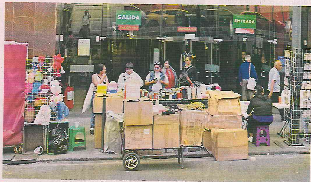
Las puertas del inmueble estaban abiertas ayer. Por ahora sólo locatarios pueden ingresar.

“Pero sí, ya están en eso, ya se abre. Ya nos dio luz verde (la autoridad) para poder abrir con normalidad. No hay