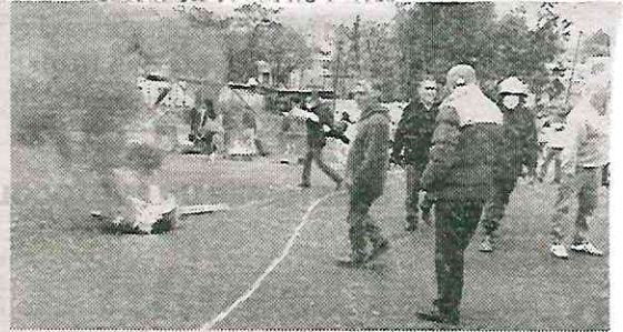
Vecinos de la colonia El Capulín