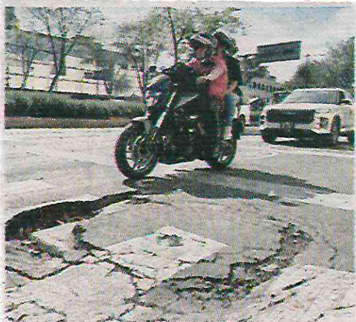
La meta del bacheo es de 14 mil m2