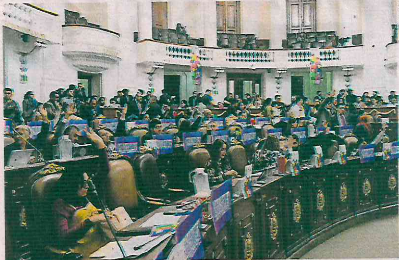
Durante la sesión del martes en el Congreso capitalino, Morena y aliados propusieron reformas relacionadas con la elección del Poder Judicial.

Se estipula entre otras cosas, que en dicha elección se elegirá la totalidad de las personas integrantes del nuevo Tribunal de Disciplina Judicial, así como magistraturas y personas juzgadoras que se encuentren vacantes, renunciadas y retiros programados, así como las personas