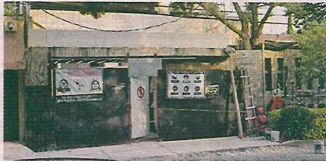
Una obra irregular fue presuntamente reactivada.

Ante la queja vecinal, la Alcaldía subrayó que procederá a verificar nuevamente la obra, que fue reanudada