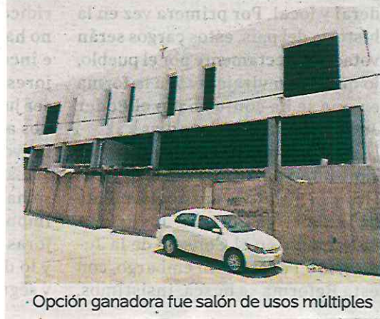
· Opción ganadora fue salón de usos múltiples

· El edificio de dos niveles se diseñó para tener dos salones de usos múltiples, uno en cada planta, además de un espacio para comedor. La obra que dejó el excalde, tiene pendiente la instalación de lavabos, barandas, duela y muros de vidrio así como espejos