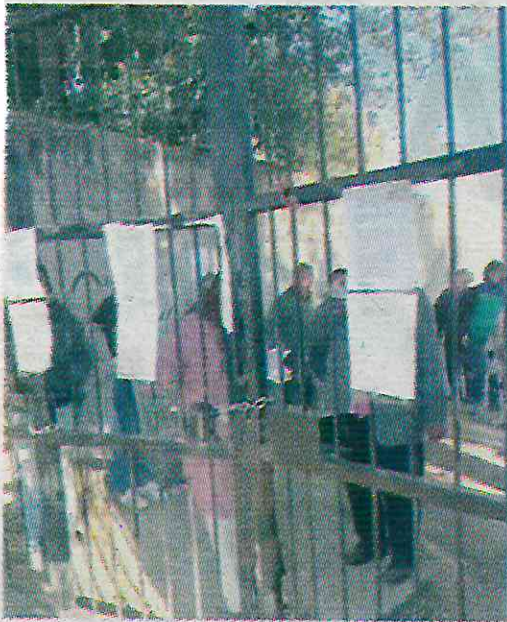
Una mujer se apropió de la vía pública