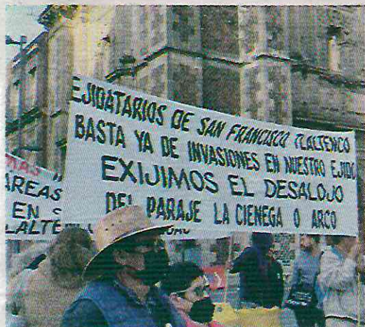
La venta se realiza a través de Facebook