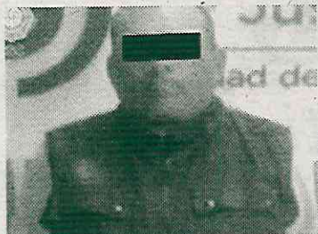
Agarrado por transa

Todo comenzó cuando el mañoso de 54 años se hizo pasar por un trabajador de la alcaldía