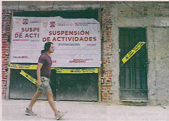
De acuerdo con las autoridades, el particular levantó un piso de más de lo que permitía la normativa.

El Invea explicó que los encargados no proporcionaron permisos de construcción, ni tampoco la autorización para hacer el cambio