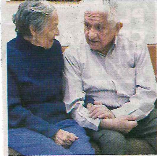
Enfrentan enfermedades crónicas