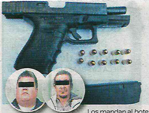
Los mandan al bote