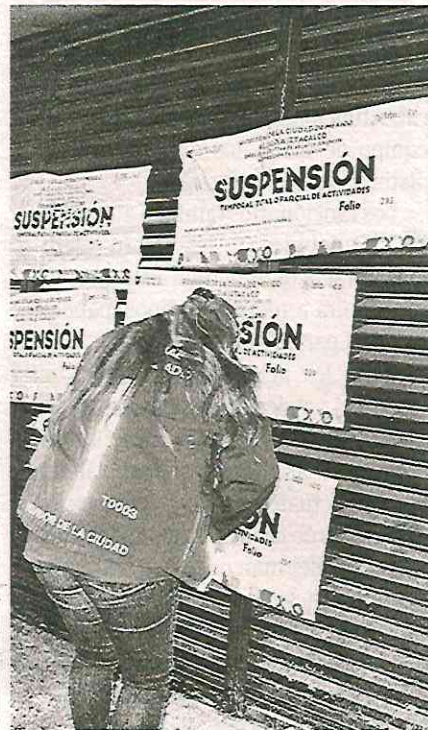
La autoridad busca detener la violencia