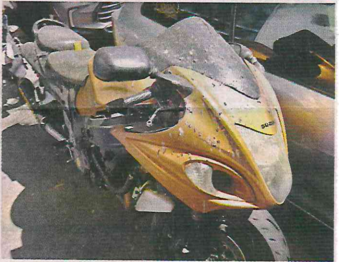
En hojas se explica los delitos por los que los autos fueron retenidos. Tres motos también están arrumbadas.