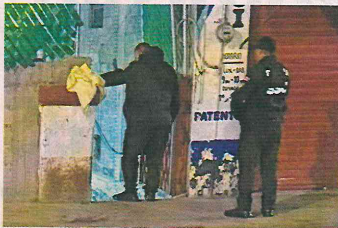
El homicidio múltiple ocurrió en la esquina de Avenida Independencia y Calle Reina Xóchitl, en San Miguel Mixquic.

zados al lugar del múltiple homicidio agentes del Sector Mixquic, pero los agresores ya habían escapado.