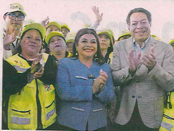
Clara Brugada, Jefa de Gobierno, y Mario Delgado, Secretario de Educación federal.