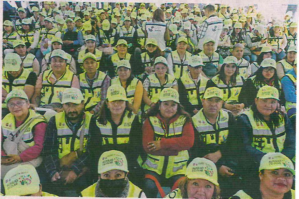
En la Secundaria Anexa a la Normal Superior se dio el banderazo de salida a los monitores.

Además de estar preparados para intervenir en incidentes, los servidores también serán impulsados para evitar conflictos entre grupos o la venta de drogas en o cerca de las escuelas.