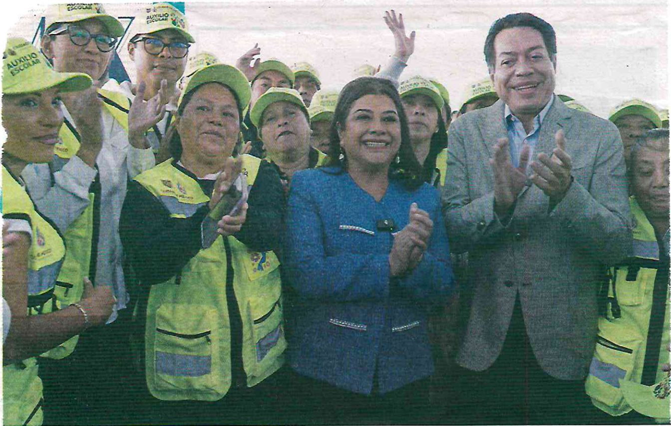
• MISIÓN. La jefa de Gobierno, Clara Brugada, y el secretario de Educación Pública, Mario Delgado, dieron el banderazo.