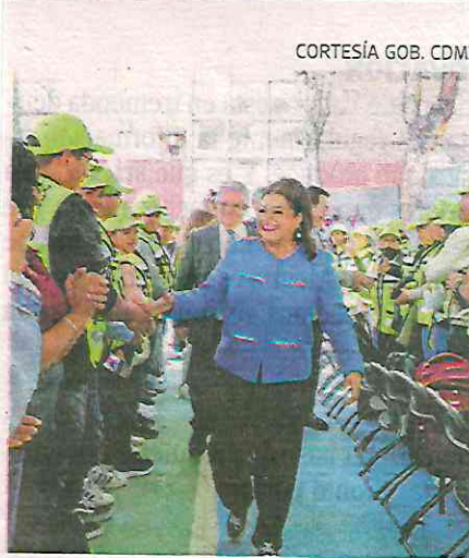
El proyecto incluye a 430 servidores de paz