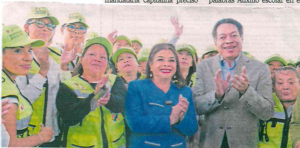
La jefa de Gobierno capitalino, Clara Brugada, y el secretario de Educación Pública, Mario Delgado, pusieron en marcha el programa Paz y Auxilio Escolar.