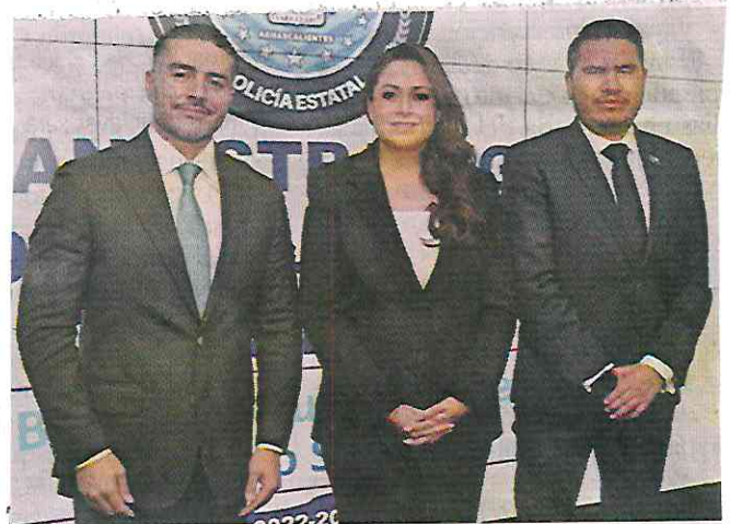
El Secretario García Harfuch se reunió con la Gobernadora panista de Aguascalientes, Teresa Jiménez.

“Revisamos las estrategias para reforzar la seguridad en Aguascalientes. Agradezco la apertura y el diálogo para trabajar en coordinación por la seguridad de nuestro estado y de la región”, indicó la Mandataria.