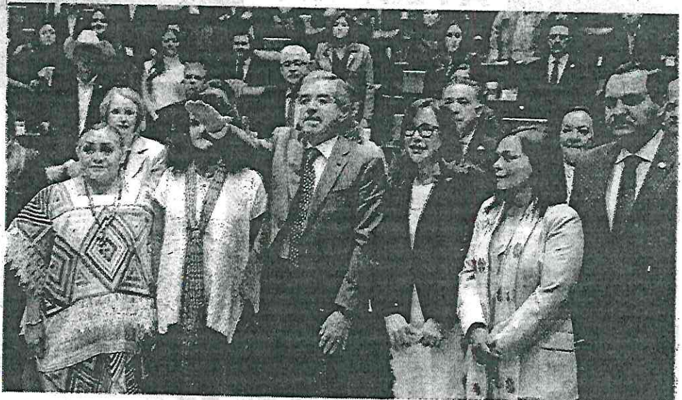
Juan Ramón de la Fuente rindió protesta de ley como secretario de Relaciones Exteriores, ante el pleno del Senado de la República.

Con el voto de todas las fuerzas políticas en su favor, el canciller mexicano explicó que con Estados Unidos hay "una relación muy íntima que nunca antes en la historia, desde el punto de vista comercial, desde luego, pero también con el cúmulo de interacciones cotidianas que se dan en esa frontera, que es,