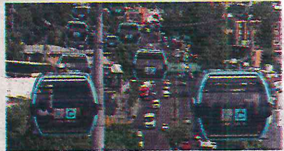
· Dos rutas benefician a la ciudadanía

Reducción de tiempo tras la implementación del Cablebús en la Ciudad de México, los habitan-