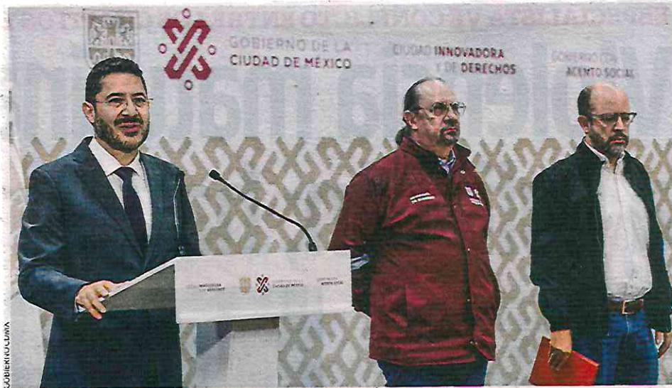
EXHORTO. El mandatario local pidió a los legisladores aprobar lo más pronto posible estos cambios a las normas que entregó el lunes por la tarde.