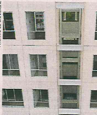
Con las rentas se busca financiar inmuebles, dijo el funcionario.

de Reconstrucción, la cual prevé la posibilidad de implementar acciones de redensificación, esto es, construir departamentos adicionales al número de departamentos destinados a las per-