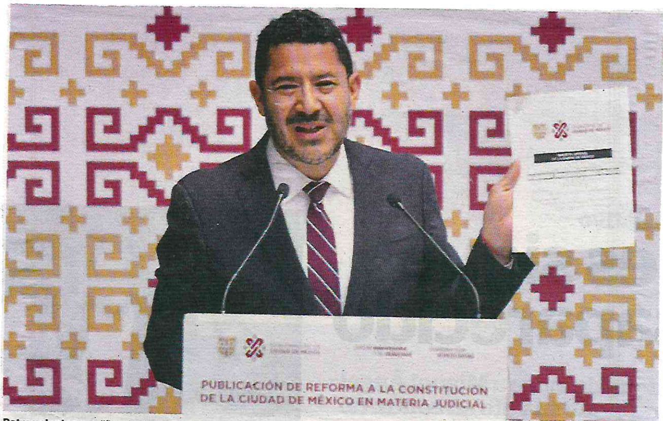
Batres plantea modificar las leyes en materia de ordenamiento urbano, deporte, vivienda y bienestar social.

“La idea es que no estén desgastándose, que no estén ociosos, sino que se puedan rentar en tanto no se vendan”, añadió.