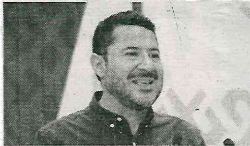
Confirma Martí Batres Guadarrama