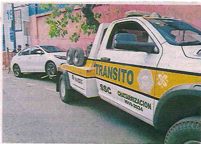
La SSC mantiene durante este año los operativos en Ciudad de los Deportes para liberar las vialidades.

Apuntó que otros de los problemas que persisten es que algunos comerciantes