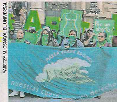
Colectivos feministas reiteraron su petición de despenalizar el aborto.

“Lo que nosotros queremos hacer es que deje de ser un delito, porque