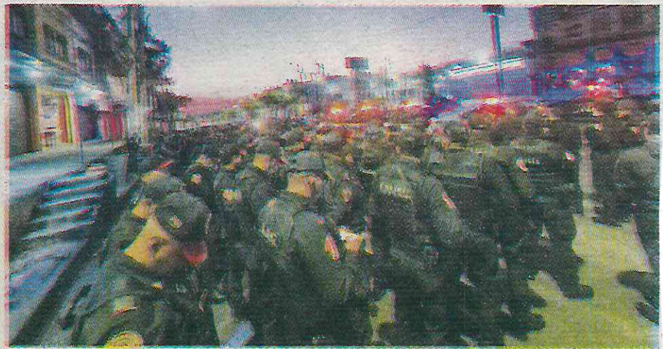
Acusan que no se cumplen con los recorridos solicitados por los vecinos

Uno de los nuevos protocolos sobre el que expresan su disgusto es la toma de lista y revisión en el sector Santa Fe, un proceso que se alarga hasta por dos horas. Después de este procedimiento, los policías de la PBI indican