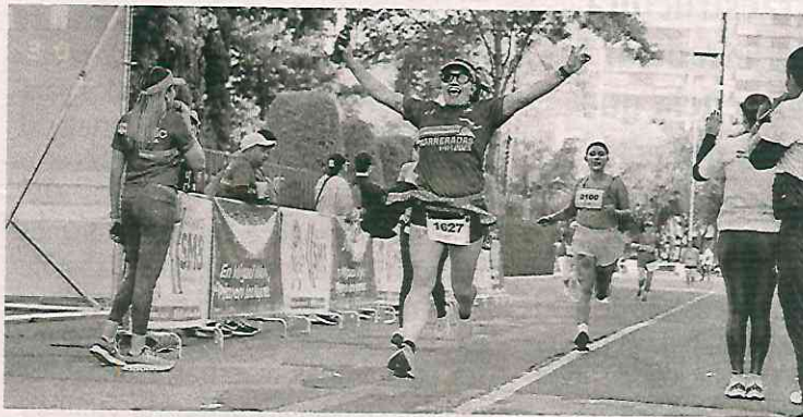
Se realizaron dos circuitos de 5 y 10 kilómetros

ción se han impulsado programas para aligerar la carga y hacer el piso más parejo entre hombres y mujeres, como los Puntos Violeta, Manos a la Olla, Avanza vs la Violencia, Pa' las Jefas, y con ello poner un granito de arena para que sean más libres y puedan desarrollarse a plenitud.