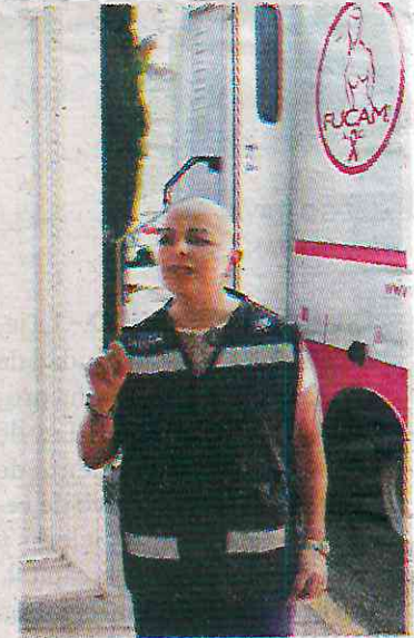
La importancia de la empatía

Según cifras del Instituto Nacional de Estadística y Geografía (INEGI), en 2023 se registraron