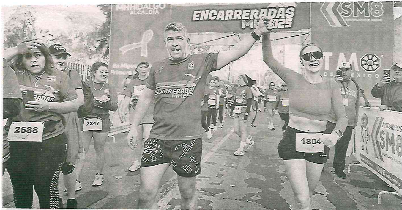
La ruta inició frente al Lunario del Auditorio Nacional y recorrió Paseo de la Reforma y Calzada Chivatito