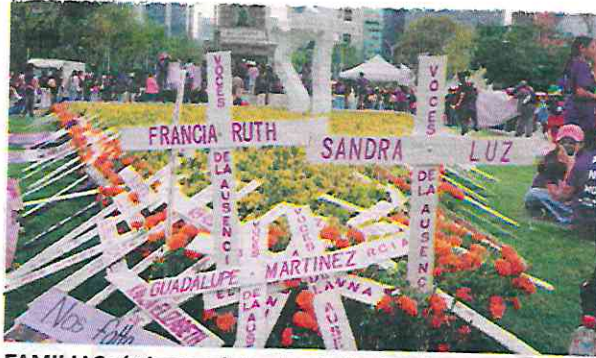
FAMILIAS víctimas colaterales de feminicidios rinden un homenaje a mujeres asesinadas, en noviembre pasado.