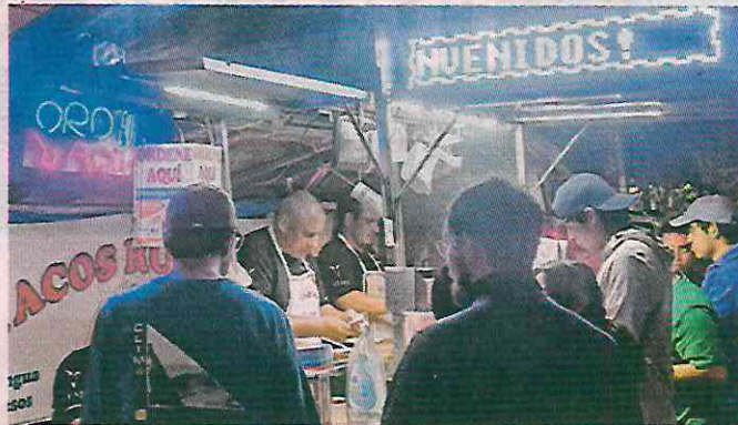
La taquería busca reabrir tras haber recibido la amenaza.

cación no hay presencia de grupos de la delincuencia organizada que lleven a cabo estas actividades.