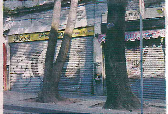
■ Los predios se encuentran cerrados desde el año pasado.

Compradores y visitantes también han tenido que lidiar con las obstrucciones peatonales y vehiculares, debido a la presencia de camiones de volteo y maquinaria para excavar que permanecen