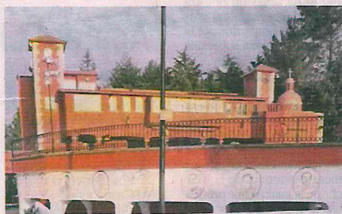
■ El perímetro de la plaza de toros de Bosque Lago tiene los rostros de toreros consagrados.