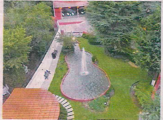
■ Vista aérea de la propiedad de Haces, en las faldas del Ajusco.