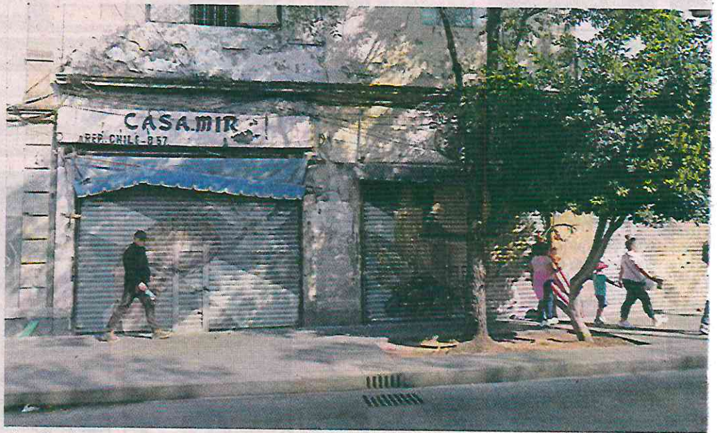
Los locales anteriormente comerciaban vestidos y adornos para novias.

Los inmuebles con construcciones habitacionales y locales, con la nomenclatura 53, 55 y 57, operaron por varias décadas como negocios