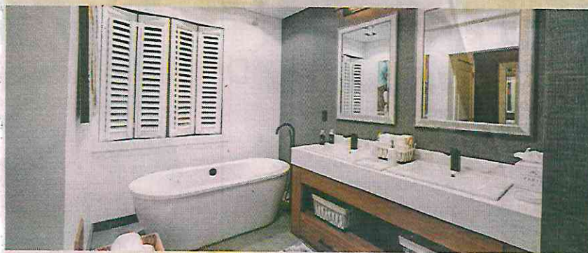
El hotel incluye dos premium suites y una grand suite.

Bosque Lago, del dirigente sindical y diputado morenista Pedro Haces, tiene un hotel boutique con 21 habitaciones, que se ofrecen como hospedaje de alta categoría con vistas al Ajusco: