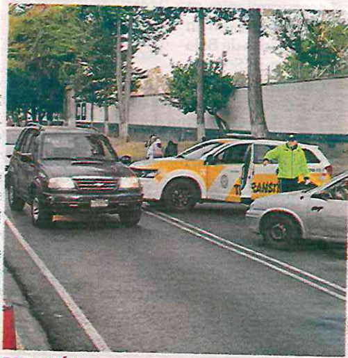
ALCALDÍA ALVARO OBREGÓN

El área encargada de las labores será la Dirección de Obras, cuyo personal trabajará en un horario de 22:00 a 05:00 horas; sin embargo, la demarcación hace un llamado a las y los vecinos a retirar sus vehículos y enseres de la vía pública para favorecer los trabajos, mientras que a los conductores el exhorto es a buscar vialidades alternas para desplazarse. /ÁNGELORTIZ