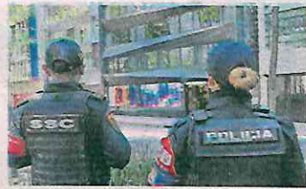
A un día del asesinato, dos policías vigilan el lugar.