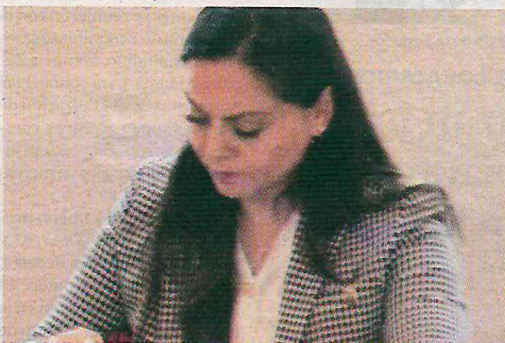
Aún así fue elegida por López Casarín como parte de su equipo

Sin embargo, la misma declaración refiere que en esas fechas se desempeñó como directora General en la FGR, específicamente para supervisar laboratorios regionales, cargo por el que habría percibido 493 mil 654 pesos anuales, pues así lo estableció el Acuer-