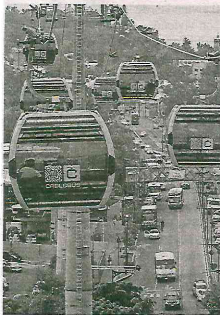
En el Valle de México viven 21 millones