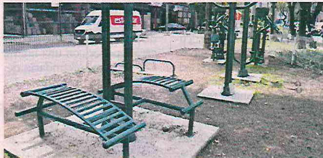
■ Proyecto ganador en ediciones pasadas. Intervenciones así, para mejorar el espacio público, van a la cabeza este año.

El registro finalizará el 1 de mayo, mientras que el 9 de mayo el Instituto dará a conocer el número de folio de las propuestas dadas de alta.