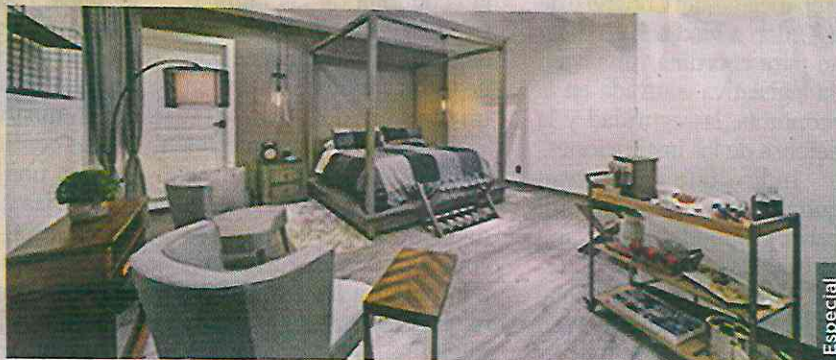
Su sitio web describe su arquitectura como campestre chic.