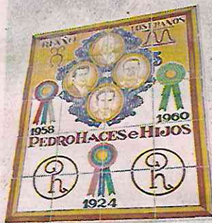
Placas con las iniciales PH están por todo el rancho.

Su llegada a la Cámara alta coincidió con el triunfo de Andrés Manuel López Obrador en la Presidencia y de la mayoría de su partido en el Congreso de la Unión.