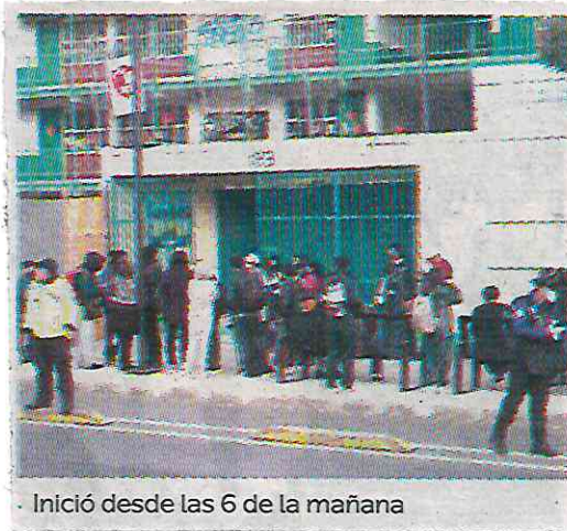
Inició desde las 6 de la mañana

Mientras que a través de los operadores de los Centros de Comando y Control C2, y con las cámaras de videovigilancia del Centro de Comando, Control, Cómputo, Comunicaciones y Contacto Ciudadano de la Ciudad de México se reforzaron las acciones de seguridad con el monitoreo de cruces viales, calles y avenidas.