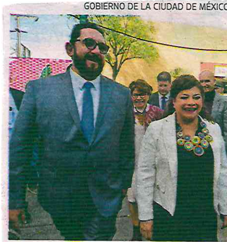
GOBIERNO DE LA CIUDAD DE MÉXICO