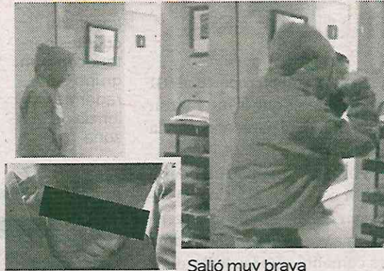
Salió muy brava

Los hechos ocurrieron en la sucursal ubicada en avenida Michoacán, colonia Condesa, a donde ingresó la agresora en aparente situación de calle y