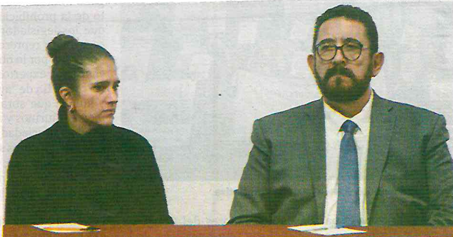
Bertha Alcalde, próxima Fiscal General de Justicia de la Ciudad de México, y Ulises Lara, Fiscal General de Justicia de la Ciudad de México saliente.

Los resultados del trabajo ministerial fueron que a través de las Fiscalía de Acusación y Enjuiciamiento, se obtuvieron más de cinco mil 500 sentencias, de las cuales tres mil 841 fueron condenatorias. Por igual, se logró, como reparación del daño a la justicia restaurativa, 644 millones 659 954 pesos a favor de las víctimas.