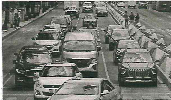
La policía educará sobre seguridad vial