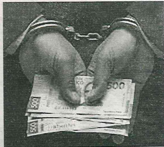
Abunda la extorsión entre los prisioneros