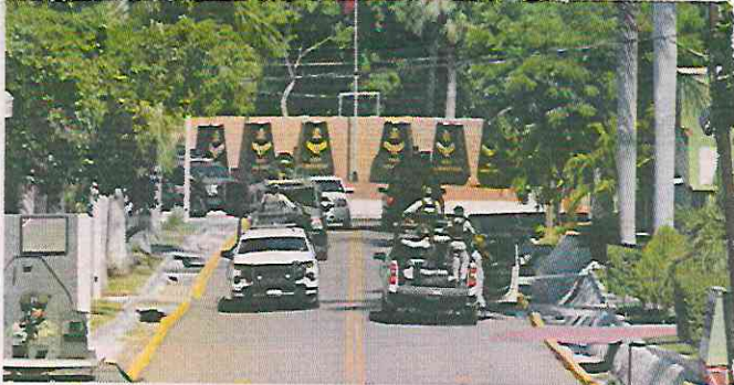
La sede de la Novena Zona Militar en Culiacán fue reforzada con decenas de elementos y unidades de defensa.