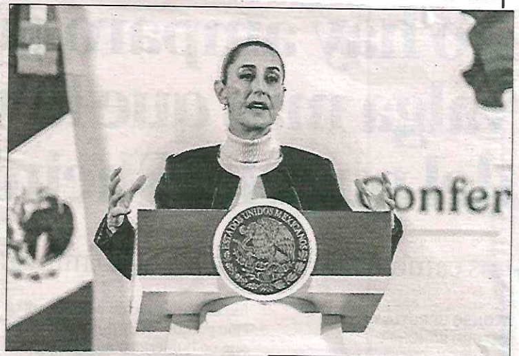
▲ La presidenta Claudia Sheinbaum Pardo anunció la creación del sistema nacional de inteligencia, en el que se coordinarán la Defensa, la Marina, la Guardia Nacional y la Secretaría de Seguridad Ciudadana.