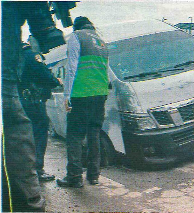
Calzada Zaragoza, Pantitlán, Iztacalco