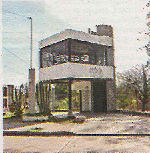
Están en un total olvido

CIUDAD DE MÉXICO.- Supuestamente, en la Ciudad de México operan 409 módulos de vigilancia, los cuales, son vigilados por 2 mil 400 uniformados, sin embargo, en administraciones pasadas, los capitalinos acusaron que estas instalaciones eran usadas como bodegas o se encontraban en el olvido, por lo que la nueva Jefa de Gobierno, Clara Brugada, y el Secretario de