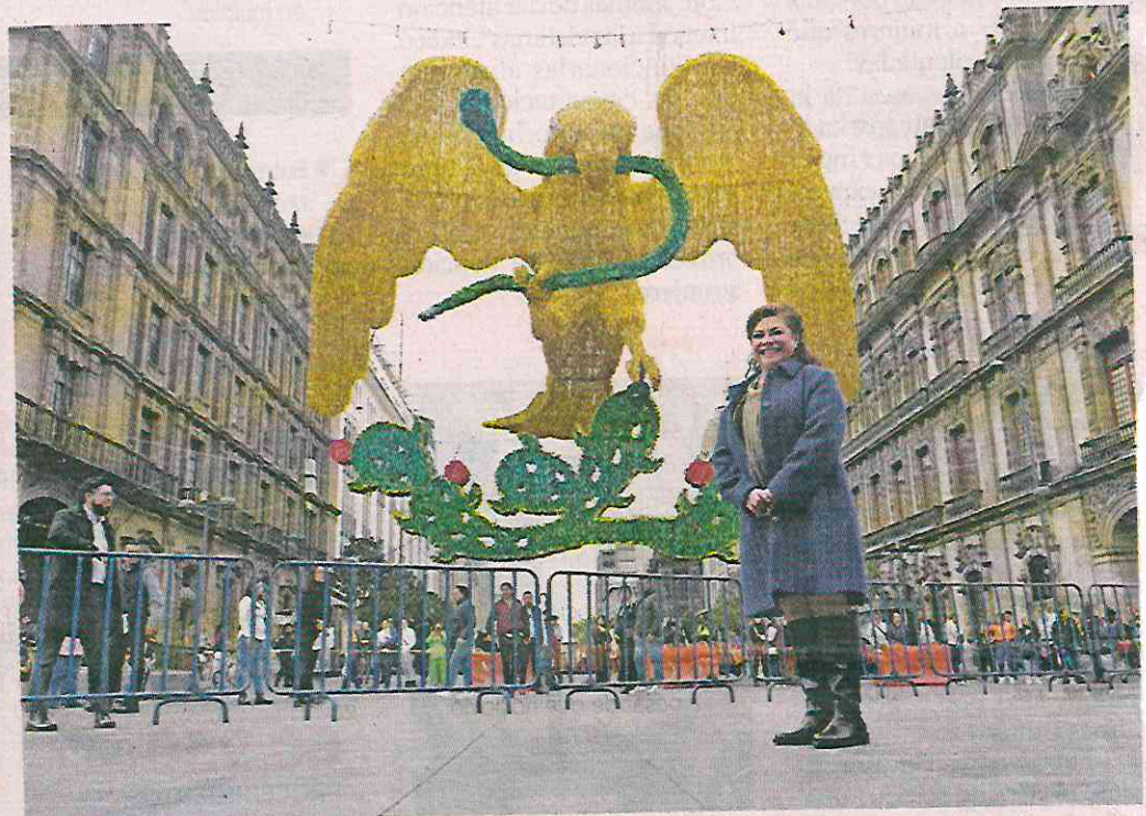
La Jefa de Gobierno, Clara Brugada, también atenderá temas prioritarios y aseguró que las audiencias servirán para analizar las peticiones ciudadanas y convertirlas en programas.