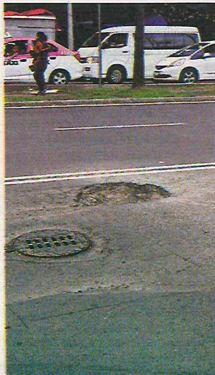
Calz. del Hueso Coapa, Floresta Coyoacán, Tlalpan

"A veces siento que es imposible recorrer una sola avenida sin caer en uno. La suspensión de mi coche ya está afectada, y aunque he intentado reportarlos, no siempre los reparan", añade. Este tipo de daños es común entre los automovilistas de la ciudad, ya que las malas condiciones del pavimento inciden directamente en el desgaste de las llantas, rines, y suspensión de los vehículos.