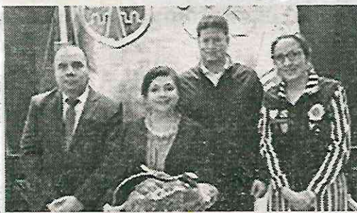
Consolidó a su equipo en la SSC