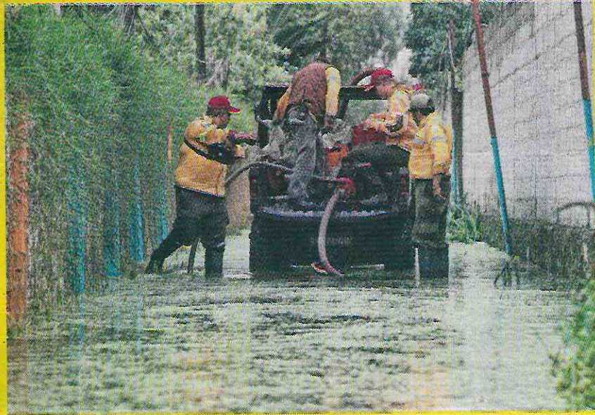
GABRIEL PANO. EL GRÁFICO

No obstante, señaló que no se trata únicamente de meter drenaje y pavimento, sino que las medidas deben ir acompañadas de un proyecto en el que no se cambie el uso de suelo.