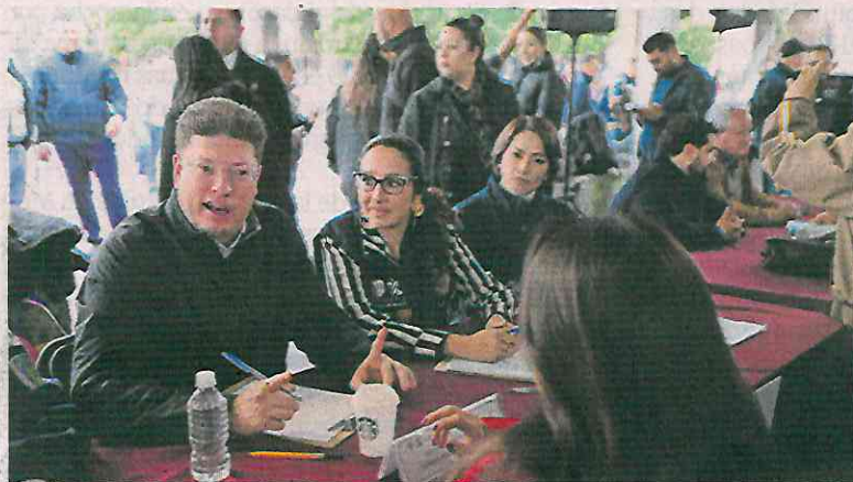
Desde las 09:00 y hasta las 15:00 horas, los integrantes del gabinete local atendieron a los ciudadanos; el acto lo encabezó la jefa de Gobierno.