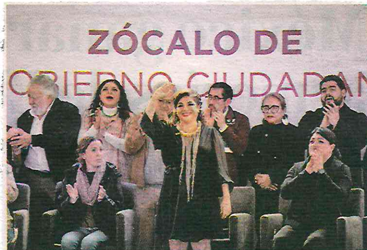
Escuchará a los ciudadanos de forma directa. CUARTOSCURO

Detalló que 247 unidades productivas resultaron afectadas, lo que puede traer daños irreversibles a 2 millones de plantas. 🇲🇽