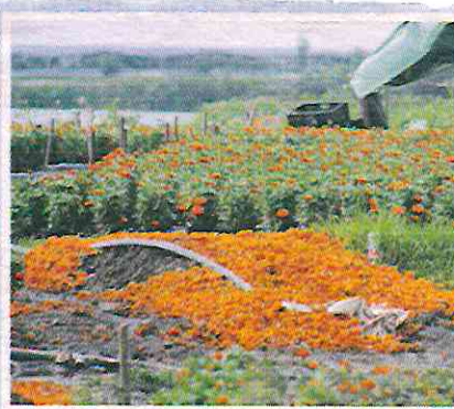
MONTÓN de flores y pétalos de cempasúchil que recolectaron los productores.

Xochimilco y se reportaron 247 unidades productivas afectadas donde había dos millones de plantas.