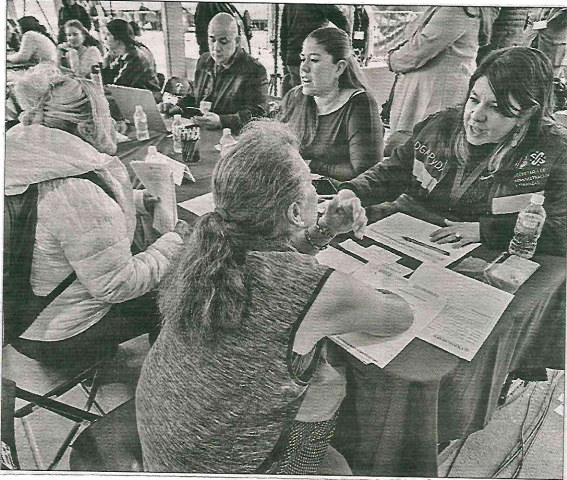
◀ La jefa de Gobierno, Clara Brugada, y funcionarios de su gabinete encabezaron la primera jornada del programa Zócalo de Gobierno Ciudadano en la Plaza de la Constitución.