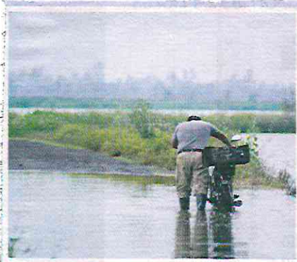
UN CAMPESINO empuja su bicicleta dentro de un campo anegado, ayer.