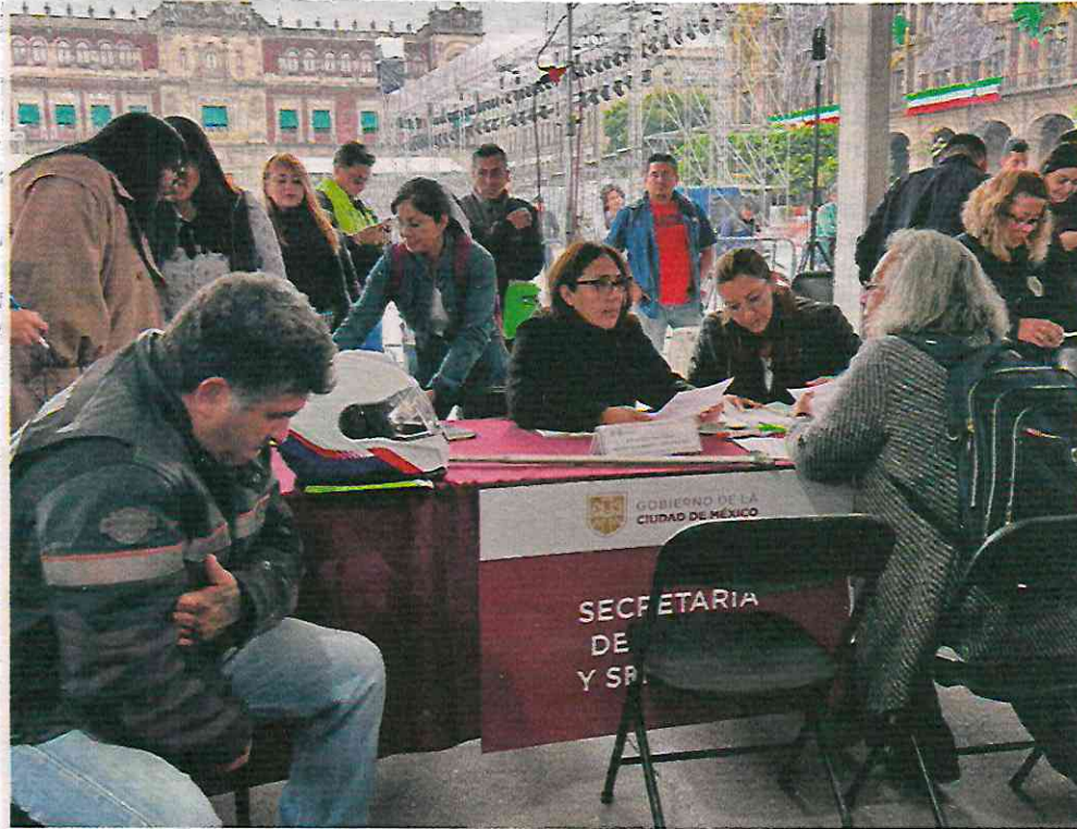
ACCIONES. En el nuevo programa de atención ciudadana, estarán abogados y doctores para brindar ayuda y orientación a los asistentes.