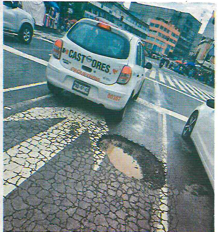
Avenida plaza de San Pablo, Ccentro Histórico, Cuauhtemoc

Eje 1 Ote 302-300, Siete de Noviembre, Gustavo A. Madero