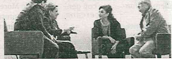
Estará Brugada cercana al pueblo