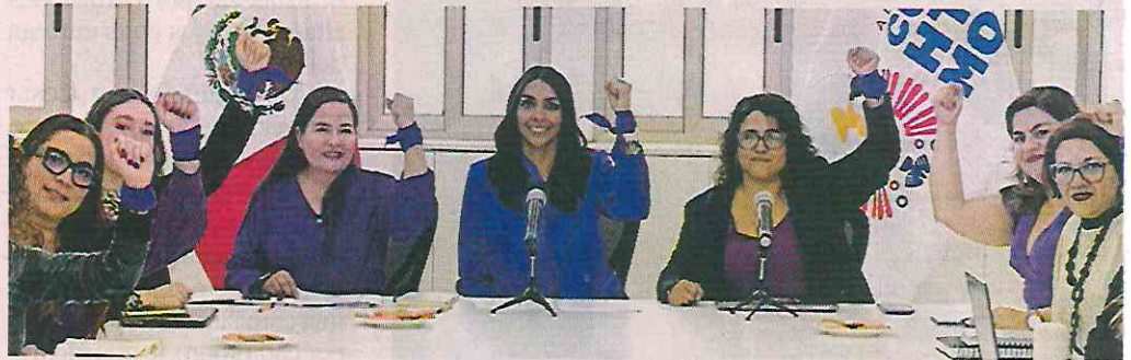
Funcionarias de la Alcaldía, activistas y representantes de organizaciones conforman el órgano.

cluirá todas las áreas de la Alcaldía. Se reunirá periódicamente para analizar transversalmente el avance en las políticas públicas dirigidas a construir un hábitat libre de violencia”, destacó una de las integrantes.