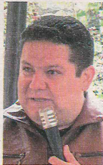
Alcalde de la demarcación

Primero con Movimiento Ciudadanos y ahora por la coalición Morena-PT-PVEM