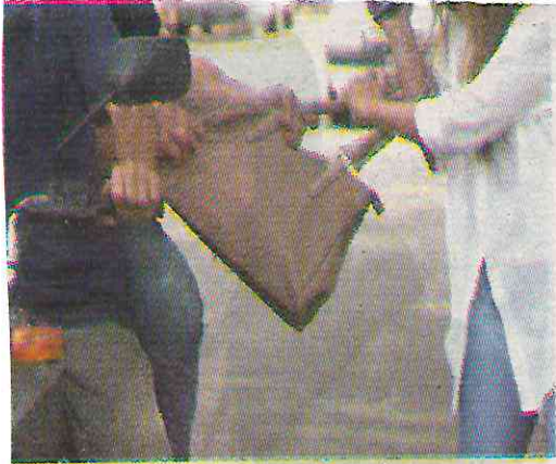
Pueden ser hurtados de bolsos o de carros