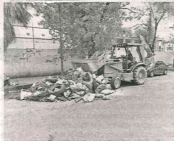
Cuadrillas de Servicios Urbanos salieron a las calles de las colonias Gabriel Ramos Millán, Juventino Rosas, Pantitlán y Tlacotal, para realizar los trabajos

Los trabajos de desazolve, limpieza, retiro de cascajo y basura se llevarán a cabo en todas las colonias de la alcaldía para garantizar una mejor calidad de vida y un entorno más ordenado para quienes habitan en Iztacalco.