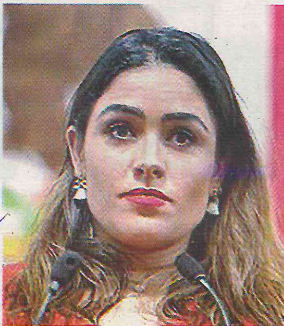
Promueve falso discurso contra la represión