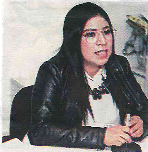
Anunció Paz políticas de seguridad