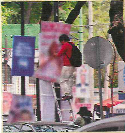
TRABAJO. En un informe entregado al Congreso capitalino, las autoridades electorales detallaron las cifras.