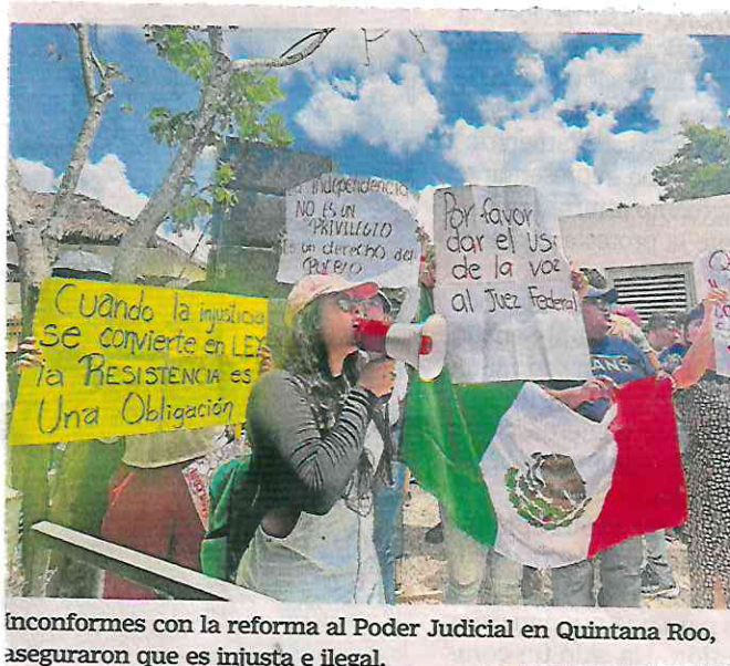
Inconformes con la reforma al Poder Judicial en Quintana Roo, aseguraron que es injusta e ilegal.

“Venimos en representación de los trabajadores del Poder Judicial de la Federación de todo el país. Si necesitamos una reforma pero debidamente estudiada y estructurada”