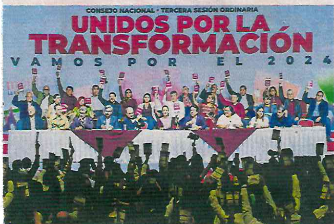
En el VII Congreso Nacional Extraordinario se reformarán los estatutos para velar por el legado de Andrés M. López Obrador.

El consejo también renovará los estatutos a fin de velar el legado del presidente Andrés Manuel López Obrador