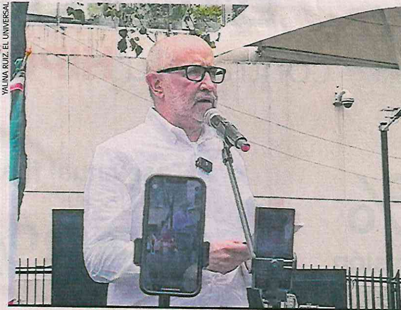
José Ramón Cossío recordó que las personas que votaron por Morena el 2 de junio pasado lo hicieron por los candidatos que compitieron.

paso a los panistas Ricardo Anaya y Marko Cortés para que pudieran ingresar al Senado.