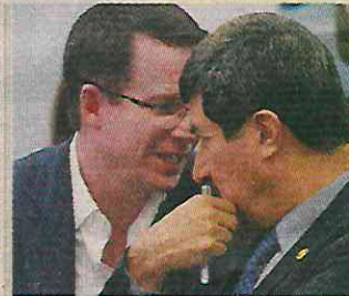
■ Anaya y Corral.

Al frente de las comisiones, las senadoras Ernestina Godoy y Citlalli Hernández —allegadas a la Presidenta Claudia Sheinbaum— fueron las res-