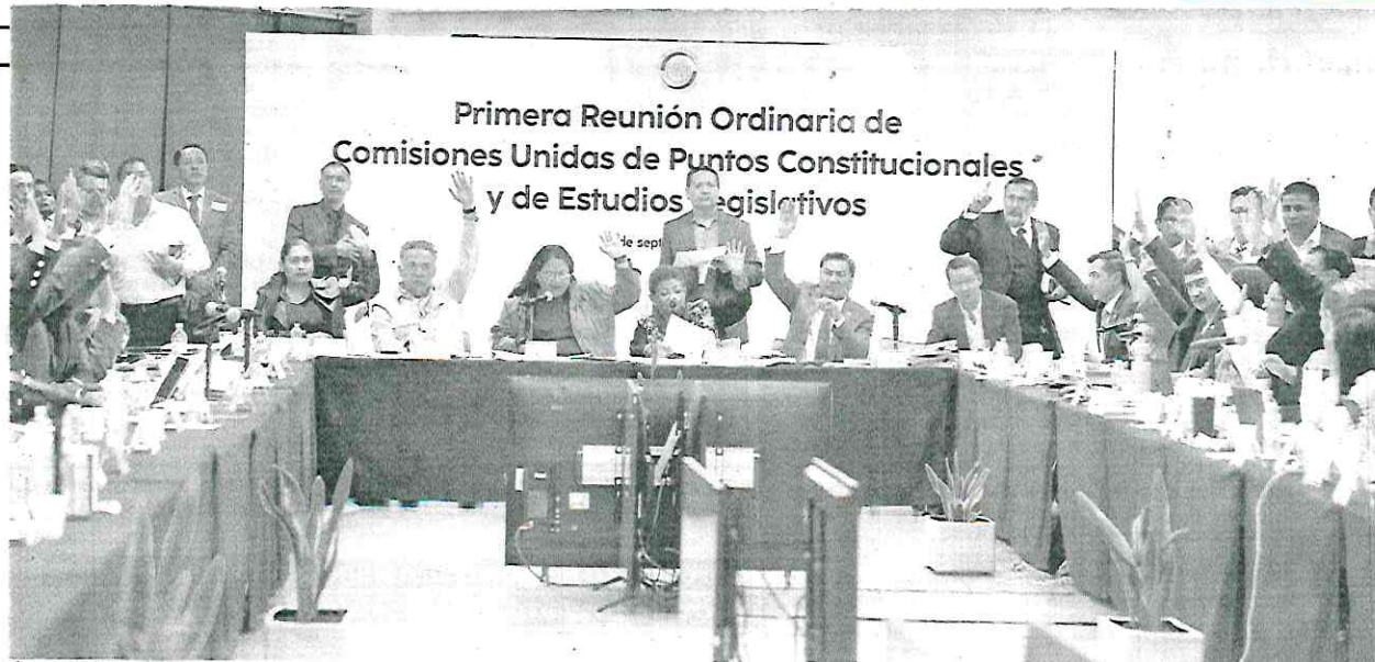
Aprueban en lo general la minuta de reforma al Poder Judicial en las comisiones unidas de Puntos Constitucionales y Estudios Legislativos del Senado de la República.