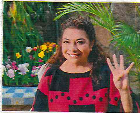
RESULTADOS. La candidata de la alianza Morena, PT y PVEM dijo que la política económica de la 4T ha sido positiva.

A nivel nacional, agregó, 30 millones de familias se benefician de los apoyos gubernamentales, mientras que 2.8 millones de jóvenes participan activamente en el programa del Gobierno de México, Jóvenes Construyendo el Futuro, “construyendo un mejor porvenir para todas y todos”. /ÁNGEL ORTIZ