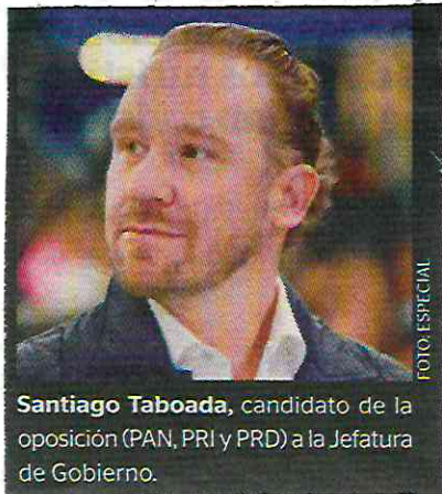
Santiago Taboada , candidato de la oposición (PAN, PRI y PRD) a la Jefatura de Gobierno.