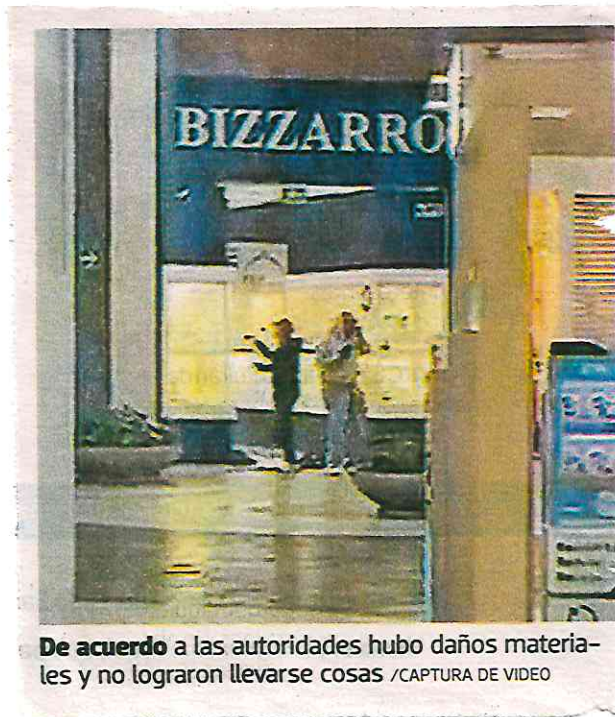
De acuerdo a las autoridades hubo daños materiales y no lograron llevarse cosas

Asistentes a la plaza comenzaron a ingresar a las tiendas que estaban a los alrededores para resguardarse y posteriormente retirarse del lugar.