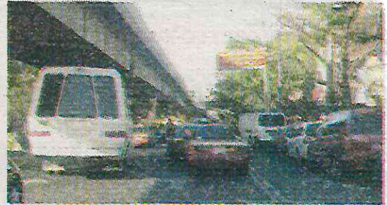
Son agredidos y presionados a pagar

En mayo de este año, se reveló un mismo modus operandi en la Ruta 50 de la Ciudad de México,