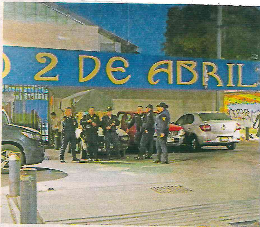
Los hechos se registraron en el inmueble ubicado en calle Pensador Mexicano esquina con 2 de Abril, colonia Guerrero, alcaldía Cuauhtémoc

lo que se retiraron del local, pero hoy de manera directa llegaron a matarlo”.