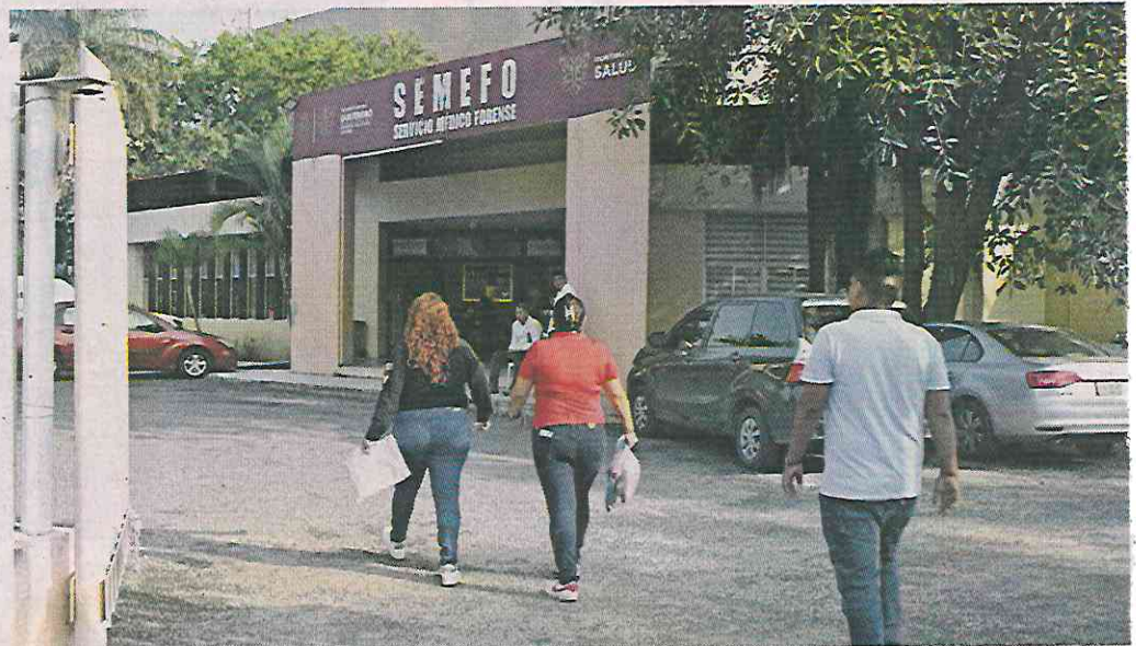
Familiares de los 17 desaparecidos de Chautipan acudieron al Semefo en Chilpancingo para identificar los 11 cuerpos localizados en el "Parador de Marqués", en la autopista del Sol.

De acuerdo con las autoridades, alrededor de las 21:30 horas del pasado miércoles, los cuerpos fueron encontrados a un costado del carril sur-norte de la auto-