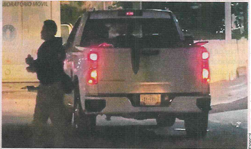
Los 11 cuerpos fueron dejados en una camioneta en un paraje cercano a la Fiscalía estatal.

Los restos son de comerciantes que habían sido plagiados por el grupo criminal "Los Ardillos". La camioneta fue estacionada la madrugada de ayer con la marcha prendida, las luces encendidas y las llaves puestas.