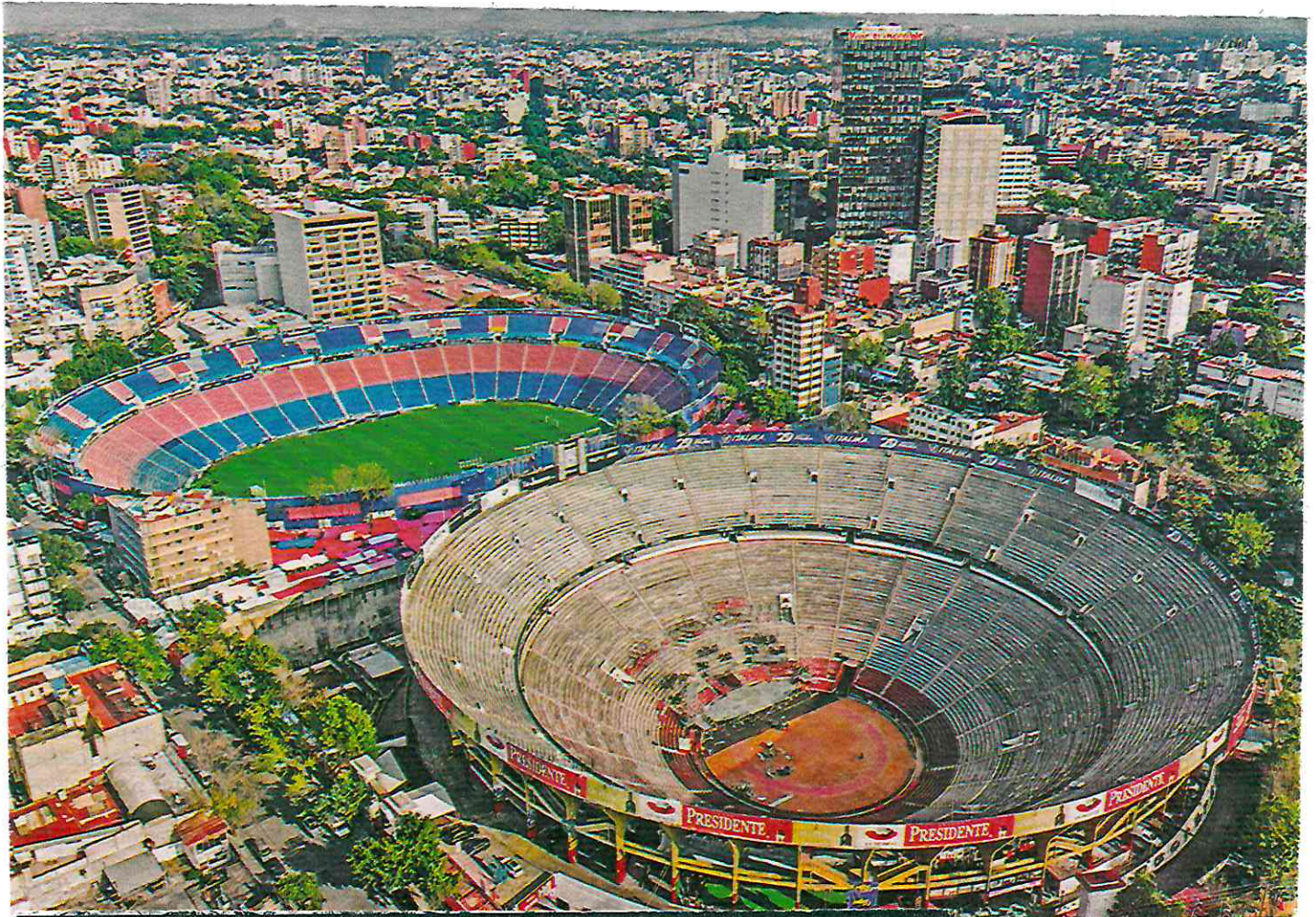
LEVANTAN LOS CASTIGOS. El balón volverá a rodar en el Estadio Azul y los olés se escucharán en la Plaza México; el alcalde de Benito Juárez, Luis Mendoza, con Protección Civil retiraron los sellos de suspensión de actividades CDMX. 7