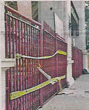
La suspensión a la Plaza de Toros era analizada ayer por la noche.

En tanto, la suspensión de la Plaza de Toros seguía bajo análisis anoche. Originalmente, se tenía previsto que en la México se realizara mañana un evento de rodeo, que coincidiría con el partido