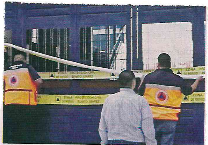
Los sellos fueron retirados ayer al mediodía... pero sólo en los accesos del Estadio Azul.

Vecinos han acusado que policías y agentes de Tránsito restringen el acceso a las colonias Ciudad de los Deportes y Nochebuena durante los eventos masivos, lo que facilita la operación de franeleros en las calles aledañas.