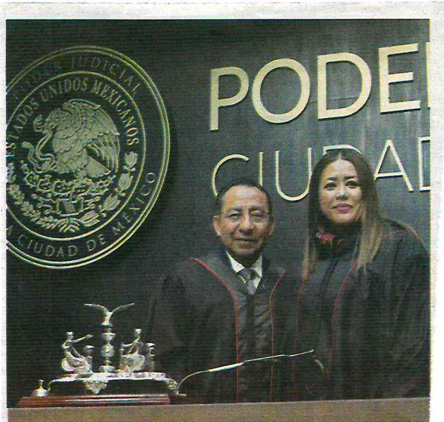
• VALOR. Con 76 votos a favor, se designó a la magistrada Yohana Ayala Villegas.