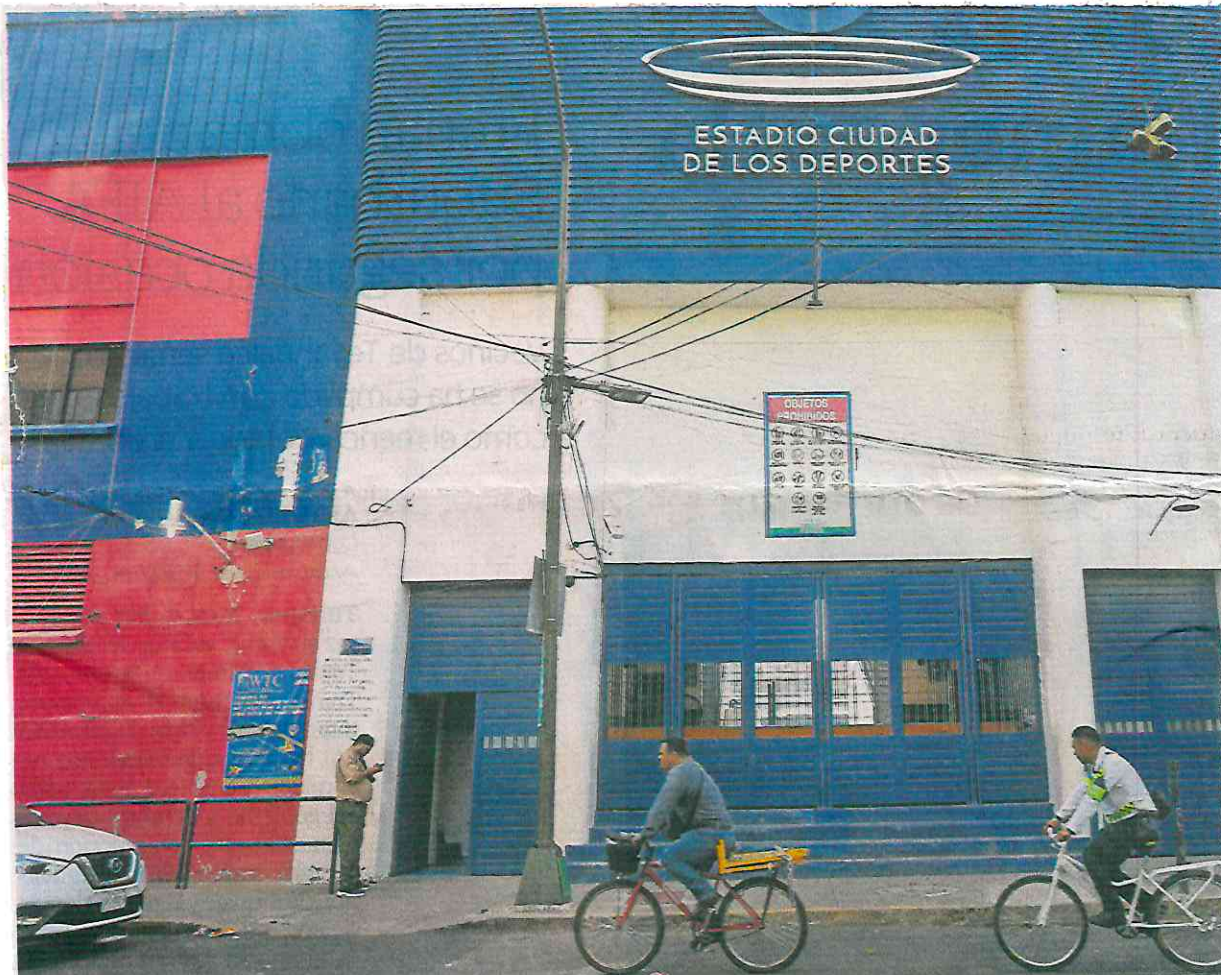
Luego de que se quitaran los sellos de suspensión de actividades, algunas personas intentaron comprar boletos de fútbol,

En el caso de la Monumental Plaza de Toros México, la demarcación precisó que continúan con el proceso de verificación. ●