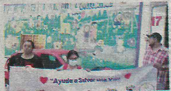
Un trámite tarda hasta más de 20 días

Puntualizó que garantizar de espacios de esparcimiento es responsabilidad de las autoridades, más cuándo varias de las festividades con gran derrama económica se hacen por los niños "recordemos que los niños son el futuro de toda una nación; también que los chavitos