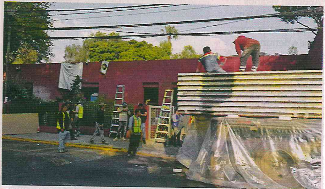
■ Mientras sigue el arribo de material para el Pilares, se prepara la edificación de una Utopía.

“Nos avisaron que aquí mismo van a construir una Utopía. No sabemos cuándo,