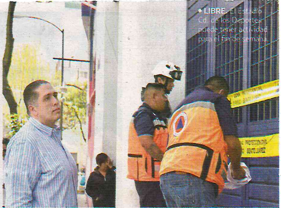
• LIBRE El Estadio Cd. de los Deportes puede tener actividad para el fin de semana.

quienes viven, asisten y transitan por la zona.