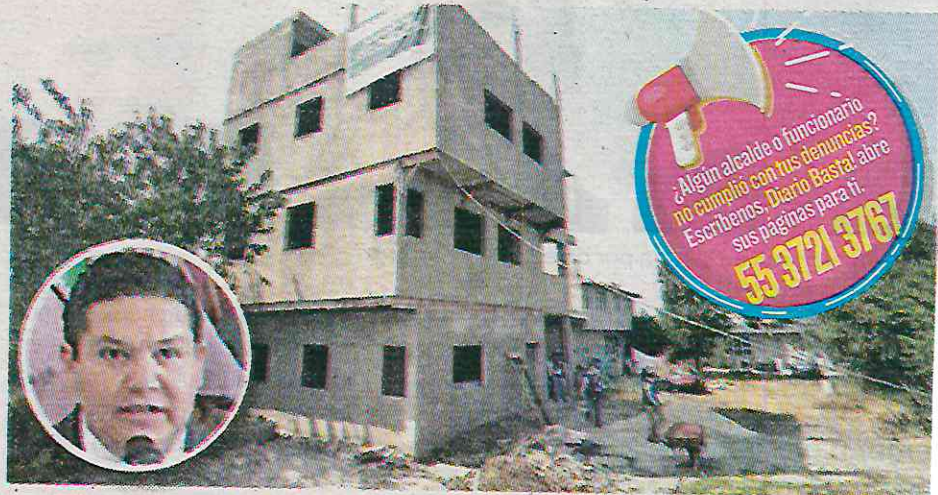
En Milpa Alta hay infracciones y delitos contra el medio ambiente

Los casos de maltrato animal en la demarcación que gobierna Rivero, consistieron en perros sin refugio ante el mal clima que se dio, desnutridos, deshidratados y con lesiones fuertes. “Un ejemplar canino que se encuentra amarrado de manera permanente con una cadena corta, sin resguardo contra la intemperie,