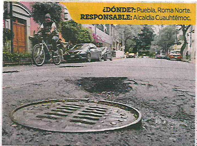
¿DÓNDE?: Puebla, Roma Norte. RESPONSABLE: Alcaldía Cuauhtémoc.

La llamada puede durar más de 11 minutos, en la que una vez iniciado el folio, un operador explica que el caso tardará cinco días en ser enviado al área correspondiente.