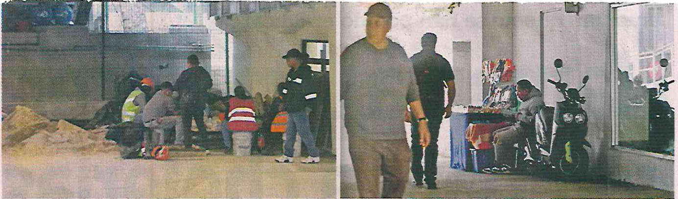
Los espacios que serían instalados en la Glorieta de los Insurgentes aún están inconclusos y otros más con ambulante.