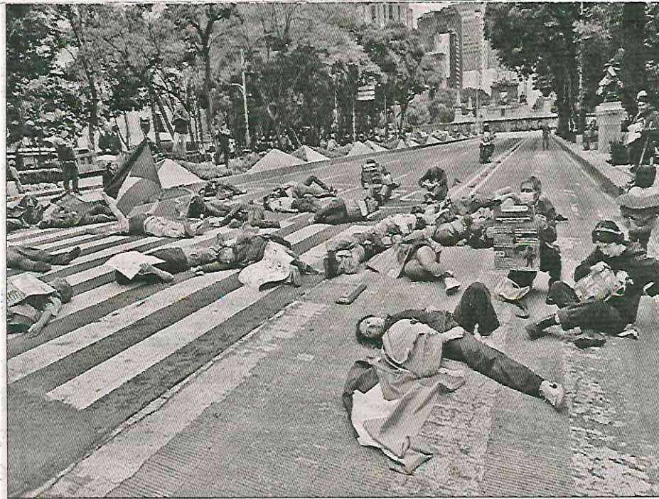
▲ Integrantes de la Red Antimperialista, del Frente Estudiantil Universitario y de las Coordinadoras de Solidaridad con Palestina, entre otras, se manifestaron y recostaron en medio de Paseo de la Reforma para detener el paso vehicular.

Integrantes de la Red Universitaria Antimperialista, del Frente