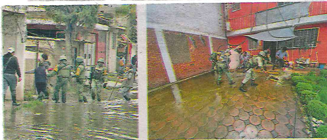
Durante la emergencia, elementos realizaron trabajos de desazolve, seguridad y resguardo de las áreas afectadas

Con motivo de las lluvias e inundaciones que se presentó este lunes en las alcaldías Milpa Alta y Xochimilco, el personal perteneciente a la Primera Zona Militar apoyaron de manera interinstitucional aplicando el Plan DNIIE, para Auxilio a la Población Civil. Durante la emergencia realizaron trabajos de desazolve, seguridad y resguardo de las áreas afectadas, refrendando su compromiso con la ciudadanía.