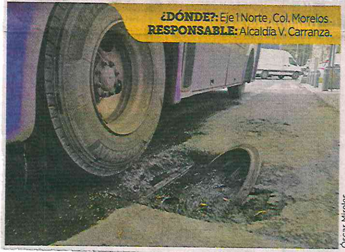
¿DÓNDE?: Eje 1 Norte, Col. Morelos. RESPONSABLE: Alcaldía V. Carranza.