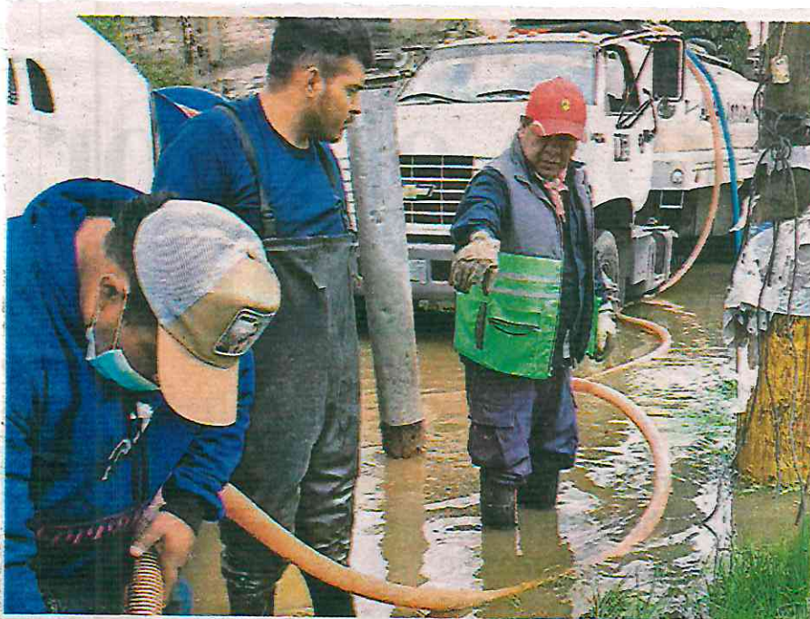
Cuadrillas de trabajadores en la zona afectada por la torrencial lluvia del domingo

gada de dar atención a los usuarios, el drenaje y saneamiento que son parte de las acciones que ya traía el Sistema de Aguas de la Ciudad de México.