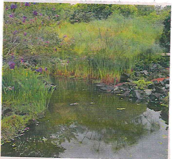
El Jardín Botánico se ha vuelto un refugio de mariposas, atraídas por las 300 variedades de plantas.

“Una posible solución a esto es la ciencia participativa, la cual consiste en la colaboración del público en general con personas dedicadas a la ciencia para responder preguntas del mundo que nos rodea”.