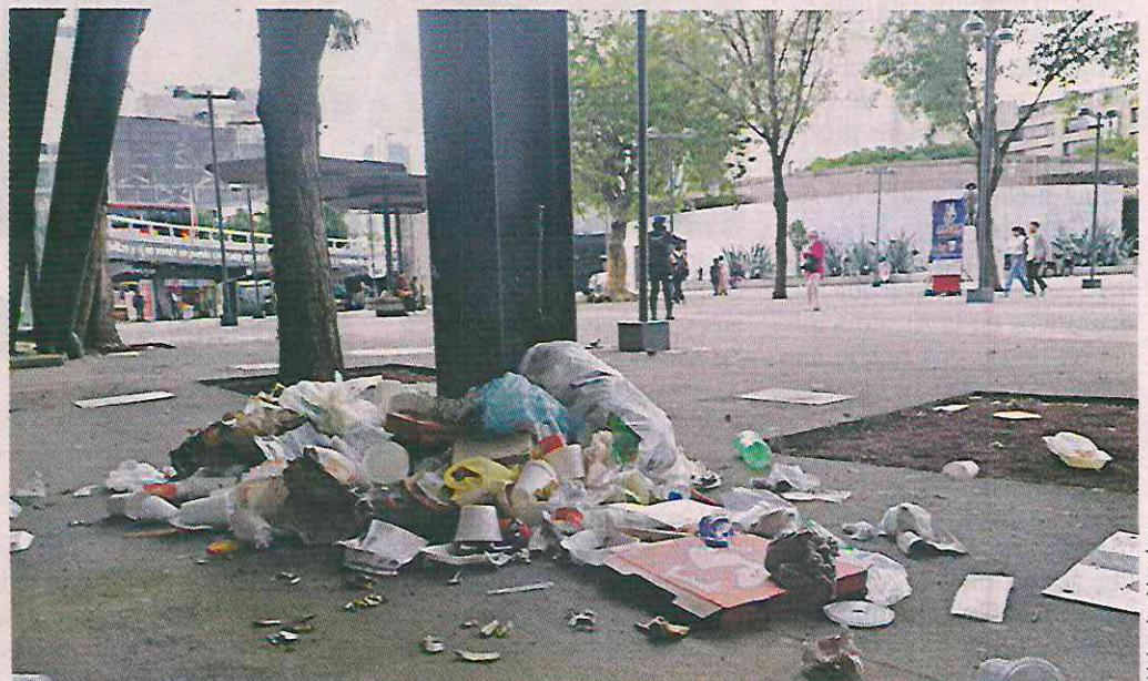
A una semana de su reinauguración, este espacio ya luce, nuevamente, con basura.