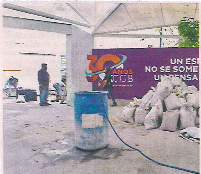
Hace unos meses, la Plaza Giordano Bruno lucía repleta de migrantes. Hasta ayer, en la zona aún realizaban obras.

Algo que además serviría, consideró, es que se reconecte el poste del C5 que antes emitía la alerta sísmica y brindaba internet gratuito y que ahora ya no lo hace.