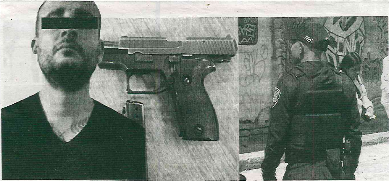
Lo atraparon con el arma homicida