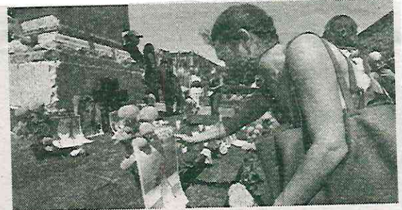
Se espera un cambio legal el próximo 18 de julio

Los números resultan en un contexto en que activistas en favor de esta población, han estado presionando para que el Congreso de la CDMX, apruebe una iniciativa que busca reformar