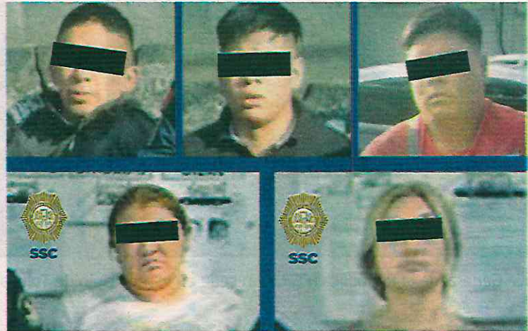
Los cinco detenidos fueron presentados ante el MP correspondiente, quien definirá su situación legal

En atención a un reporte por robo a dos ciudadanos que pretendían comprar un vehículo anunciado en redes sociales en la colonia América, de la alcaldía Miguel Hidalgo, policías de la Secretaría de Seguridad Ciudadana (SSC) de la Ciudad de