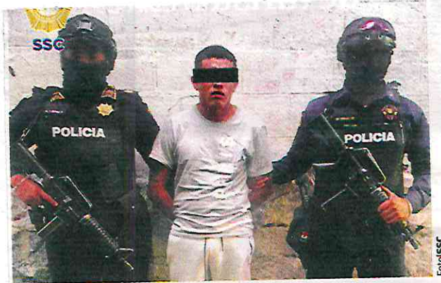
ELEMENTOS de la SSC, durante la detención de un joven presuntamente ligado a una célula criminal, ayer.