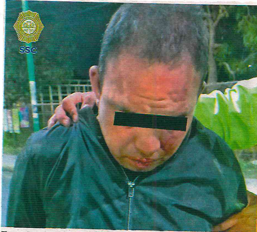
El presunto agresor sexual fue golpeado por los vecinos

colonia Los Ángeles Apanoaya, alcaldía Iztapalapa a una calle de la Avenida Ermita Iztapalapa.