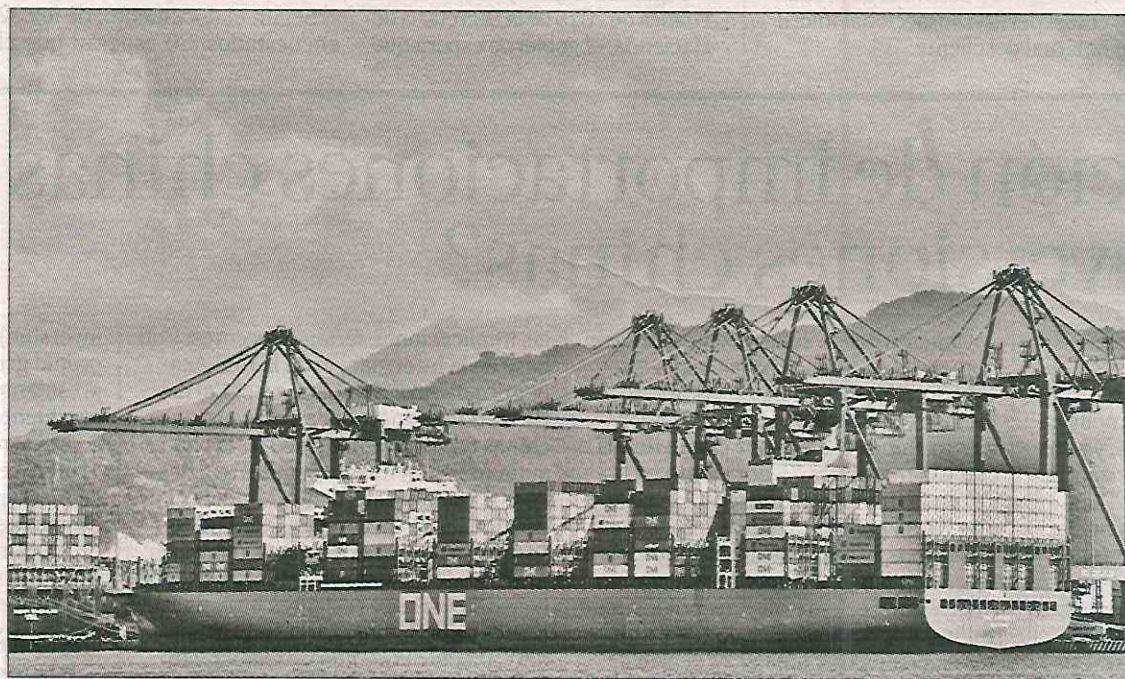
► Las exportaciones de México a Estados Unidos sumaron 466 mil 600 millones de dólares en los primeros 11 meses del año.

En lo que se refiere sólo a noviembre, el comercio entre México y EU se ubicó en 69 mil 100 millones de dólares, 15.4 por ciento de lo que los estadounidenses comerciaron con el mundo. En segundo lugar quedó Canadá, con 61 mil 800 millones de dólares, equivalentes a 13.8 por ciento del intercambio global de EU, mientras en el tercer puesto se ubicó China, con 50 mil 500 millones de pesos, iguales a 11.3 por