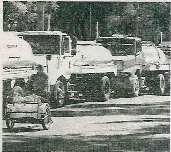
GAM y Cuajimalpa completan los primeros sitios

vicios urbanos indicó que la manera en que atiende la demanda de pipas de agua con vehículos propios, además del apoyo de Sacmex.