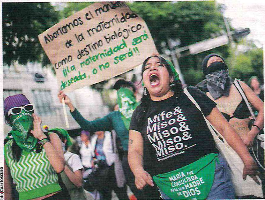
PROTESTA en la Ciudad de México en favor del aborto en septiembre pasado.

LA CEM critica que comisiones del Congreso de la CDMX aprobaran propuesta de la morenista Yuriri Ayala; embarazos interrumpidos disminuyen 21.9 por ciento entre 2019 y 2023