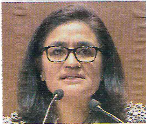
Los tiraderos clandestinos aumentaron