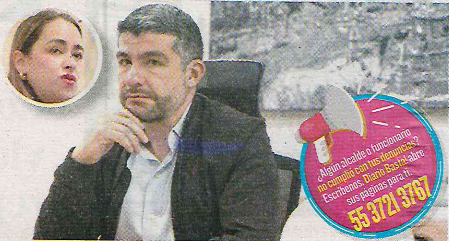
El favoritismo inició facilitando una diputación plurinominal a su esposa

En el Concejo de Miguel Hidalgo también se ha establecido este amiguismo, uno