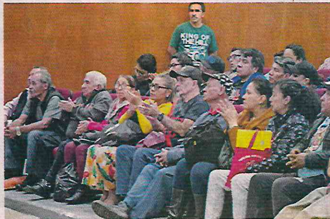
Locatarios del Mercado Río Frío, en la Colonia Bramadero Ramos Millán, durante el primer gabinete.

“Desde la campaña me comprometí con las y los locatarios a conformar el gabinete de mercados y hoy es una realidad para trabajar coordinadamente y atender sus peticiones”.