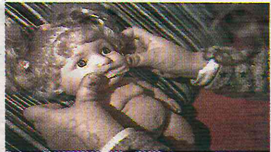
Una de cada dos víctimas son infantiles

La dependencia informó que, en la mayoría de los delitos, la agresión proviene de algún conocido de la víctima, entre los que se encuentran parientes cercanos, padrastros y padres de familia, siendo las mujeres menores de edad las más afectadas, con una tasa de agresión por encima del 90% del total de los casos.