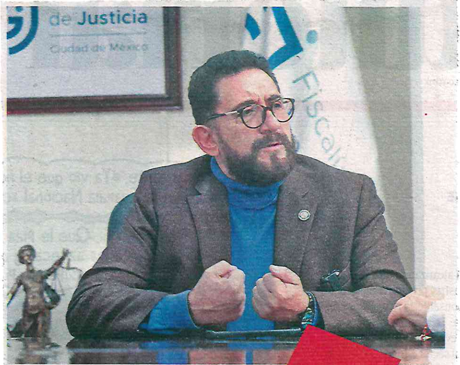
“No podemos actuar si no hay una denuncia”, subraya el fiscal

“Reiteramos la invitación que se acerquen a la Fiscalía, nosotros los atendemos, contamos con infraestructura, muchos mecanismos de acceso que entran a la denuncia digital, los teléfonos que se encuentran en nuestra página internet siempre habrá quien les responda, sino les pedimos de favor intentarlo o vaya a una de nuestras agencias levante el teléfono rojo y denuncie que no lo están atendiendo, ayúdenos a evaluarnos, la confianza nace de cómo nos fue para mejorar, hagamos junto esta sinergia hoy más que nunca la ciudadanía está contigo”, concluyó el titular de la Fiscalía General de Justicia de la CDMX, Ulises Lara López.