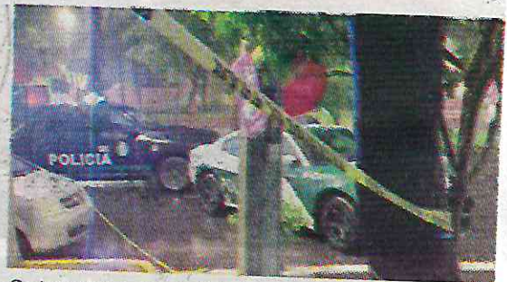
Se investiga el móvil de la balacera

Finalmente, peritos y agentes de la Fiscalía General de Justicia de la CDMX realizaron las investigaciones pertinentes y el levantamiento del cadáver, mientras el agente del Ministerio Público inició lacarpeta de investigación correspondiente.