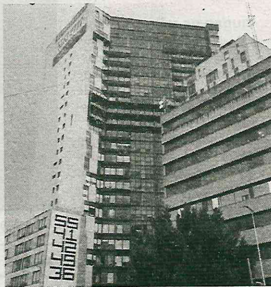
La Fiscalía ha intentado desaparecer la carpeta

"Por segunda vez desaparece mi carpeta de investigación para no ser judicializada" declara el habitante de la alcaldía Benito Juárez, dónde se han detectado una mayor cantidad de casos de construcciones irregulares que afectan a los inmuebles colindantes, como en su caso y el de otros vecinos.