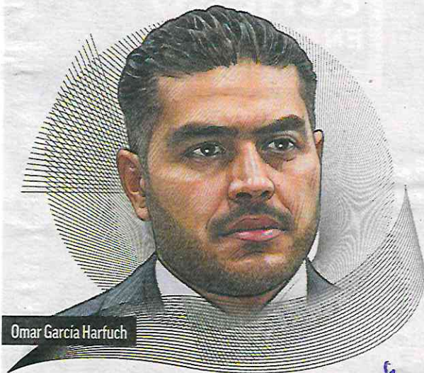
Omar García Harfuch

El arranque de la nueva administración federal va de la mano también de la llegada de nuevos gobernadores, en donde uno de los focos centrales será la coordinación en materia de seguridad pública, pues los datos muestran que la violencia, la extorsión y el enfrentamiento entre los grupos delincuenciales no ceden, siguen presentes y en muchas partes están sin control.