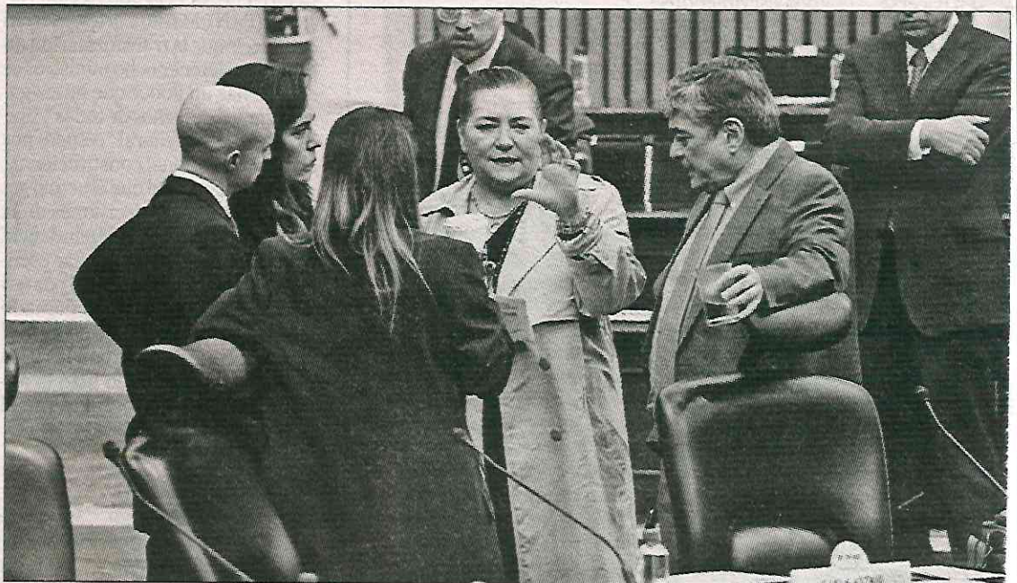
▲ Guadalupe Taddei, presidenta del INE, dialoga con varios consejeros electorales. Se supo que de manera colegiada el instituto impugnó los recursos

En vista de las diversos ordenamientos que fijan estos amparos, el instituto electoral recurrió al TEPJF, que deberá resolver qué acción tendrá que seguir el instituto.