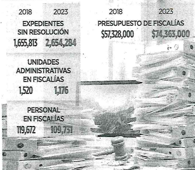
Ilustración: IA Grupo REFORMA

El Censo Nacional de Procuración de Justicia Estatal y Federal del Inegi exhibe los rezagos en indagatorias