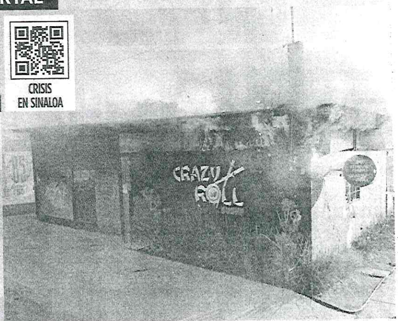
EN CENIZAS. Un restaurante de sushi fue incendiado ayer por sujetos armados en la Colonia Los Huizaches, en Culiacán.

Autoridades de Sinaloa actualizaron la cifra de delitos: