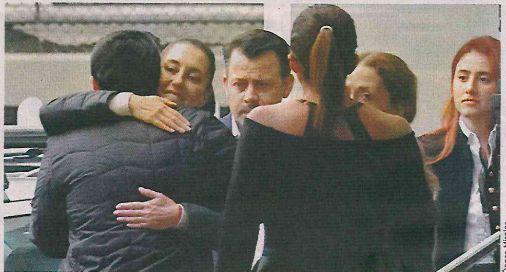
La Presidenta Claudia Sheinbaum acudió al sepelio de Ifigenia Martínez y conversó con los nietos de la maestra para darles sus condolencias.

A una funeraria de Félix Cuevas, donde suelen velar a personajes de la vida política