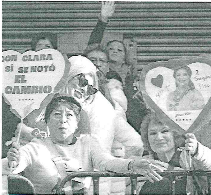
SIMPATIZANTES de la exalcaldesa de Iztapalapa en el exterior del Congreso capitalino.