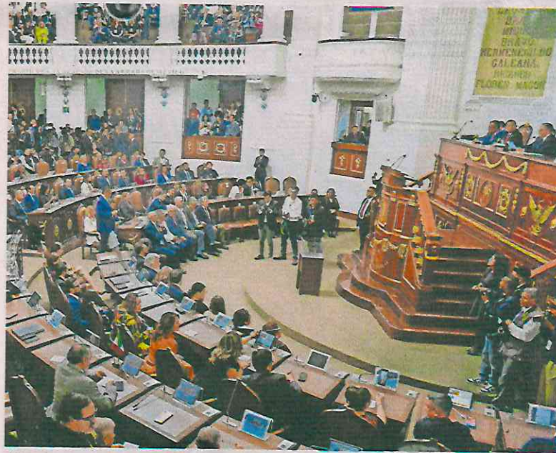
El Congreso local recibió las iniciativas del PAN y MC para crear un sistema de cuidados; las bancadas esperan unir esfuerzos con la jefa de Gobierno.

El 5 de septiembre la bancada de Movimiento Ciudadano ingresó una iniciativa para expedir la Ley del Sistema Integral de Cuidados de