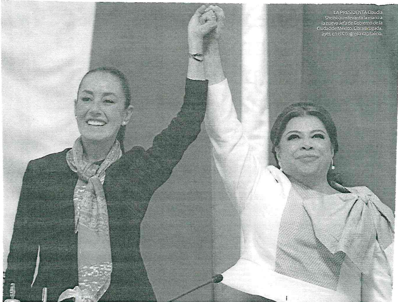
LA PRESIDENTA Claudia Sheinbaum levanta la mano a la nueva Jefa de Gobierno de la Ciudad de México, Clara Brugada, ayer, en el Congreso capitalino.