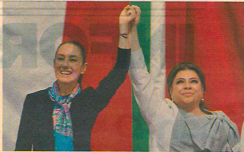
"Vamos a trabajar juntas por la Ciudad, capital de todas y todos los mexicanos", expuso Brugada a través de redes sociales.

En el Congreso de la Ciudad de México presenció el primer mensaje de Brugada Molina como mandataria del Ejecutivo local, quien destacó y refrendó su compromiso para trabajar de la mano del Gobierno de México en obras y proyectos estratégicos a favor de los habitantes de la capital.