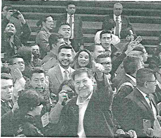
GERARDO Fernández Noroña, a su llegada al Congreso local.