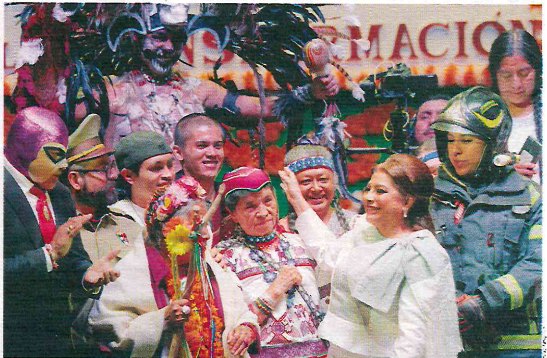
LA JEFA de Gobierno, Clara Brugada Molina, ayer durante el evento en el teatro Metropolitano.

LA JEFA de Gobierno se reúne con simpatizantes en el teatro Metropolitano, donde festejó su victoria; comparte templete con deportistas, bomberos, choferes, luchadores, trabajadores y bailarines en silla de ruedas, entre otros