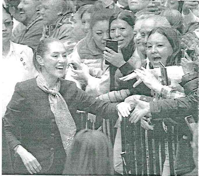
LA PRESIDENTA Claudia Sheinbaum saluda a la gente, luego de la sesión solemne del Congreso capitalino.