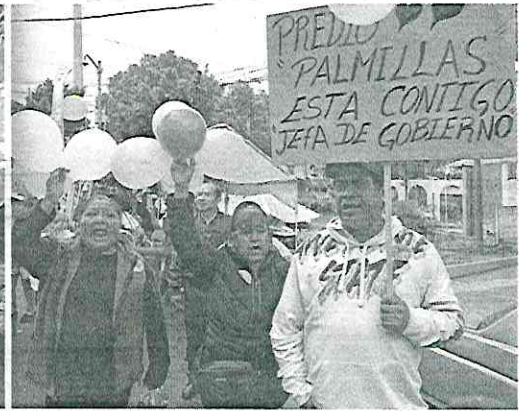
■ Música, baile y pancartas de apoyo recibieron a Clara Brugada en Teotongo, colonia de Iztapalapa a la cual atribuyó su formación política.