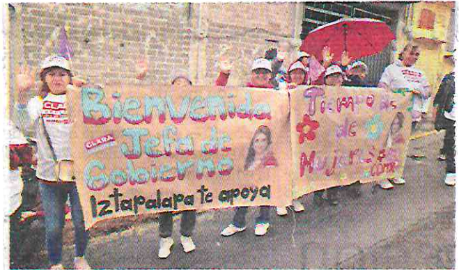
La mandataria prometió regresar y atender problemas como escasez de agua, seguridad y bienestar social.

Brugada dijo que vivió muchos años en San Miguel Teotongo y ayer avisó a sus vecinos que se se mudará más cerca del Zócalo.