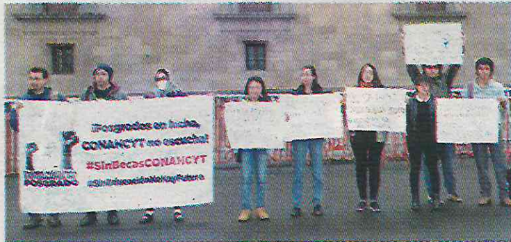
Se manifiestan para exigir apoyos para estudios de posgrado

El Frente Nacional de Estudiantes de Posgrado (FNEP) surgió en 2023 como respuesta a los nuevos lineamientos del Consejo Nacional de Humanidades, Ciencias y Tecnologías (Conahcyt) que recortó becas de forma arbitraria en programas de estudios de posgrado en universidades públicas y priva-