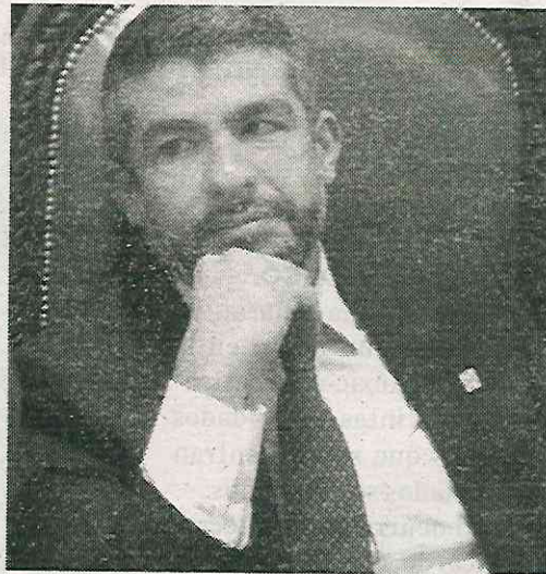
El panista no detalló los lugares resguardados

De acuerdo con datos de la alcaldía, el contrato fue firmado en enero de este año con la empresa "Eyeteck S.A. de C.V." quien se encargaría de las labores de supervisión en las dependencias locales, por lo que asignaría a cinco supervisores de seguridad en turnos de 12x12, cuyo costo unitario sería de cero pesos, mientras que un elemento de seguridad costaría mil 546 pesos, mismos que serían so-