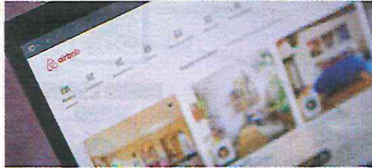
Limitan. Viviendas sociales no se pueden alquilar a turistas en plataformas.