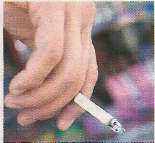
· Un riesgo son los cigarrillos adulterados

“Uno de los principales riesgos también es el cáncer de múltiples sitios, para empezar el cáncer de la boca, de la garganta, el del pulmón, pero cánceres inclusive que parecieran distantes como cáncer de estómago, o cáncer de vejiga”, comentó.