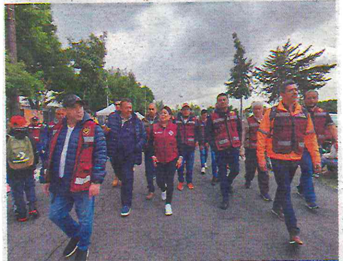
• ACCIÓN. La actividad fue en la periferia del Estadio GNP Seguros para detectar coladeras destapadas y luminarias fundidas.