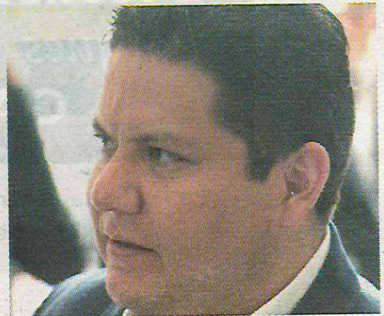
· Cuando gobernó Milpa Alta de 2018 a 2021