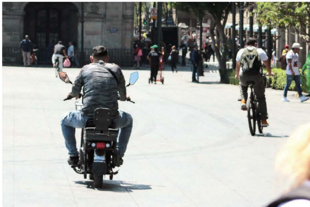
UN HOMBRE conduce una bicimoto en la ciclovía del Zócalo capitalino, el pasado 19 de marzo.