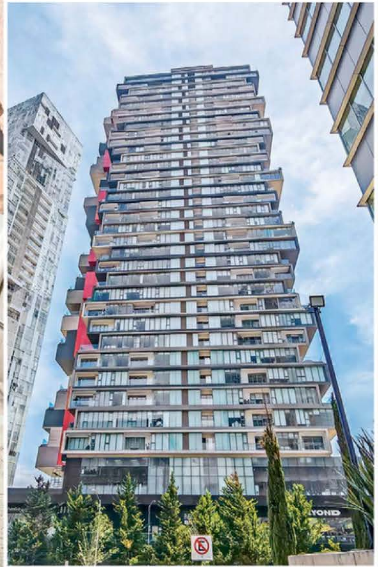
PRUEBAS. La constructora Desarrollos Sustentables Santa Fe incumplió con la entrega en tiempo de las obras, las cuales están incompletas.

En cuanto al valor actual, el residente afectado indicó que los precios son de 100 mil pesos por el metro cuadrado; sin embargo, por la falta de áreas comunes un notario les explicó que al buscar vender sus propiedades perderían un 30 por ciento de su valor.