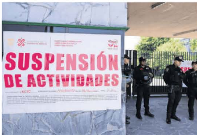
Tras la muerte de los dos fotógrafos, personal de la alcaldía Miguel Hidalgo y del Invea suspendieron actividades en el Parque Bicentenario.

En contraste, el Instituto Mexicano del Seguro Social (IMSS) Bien-