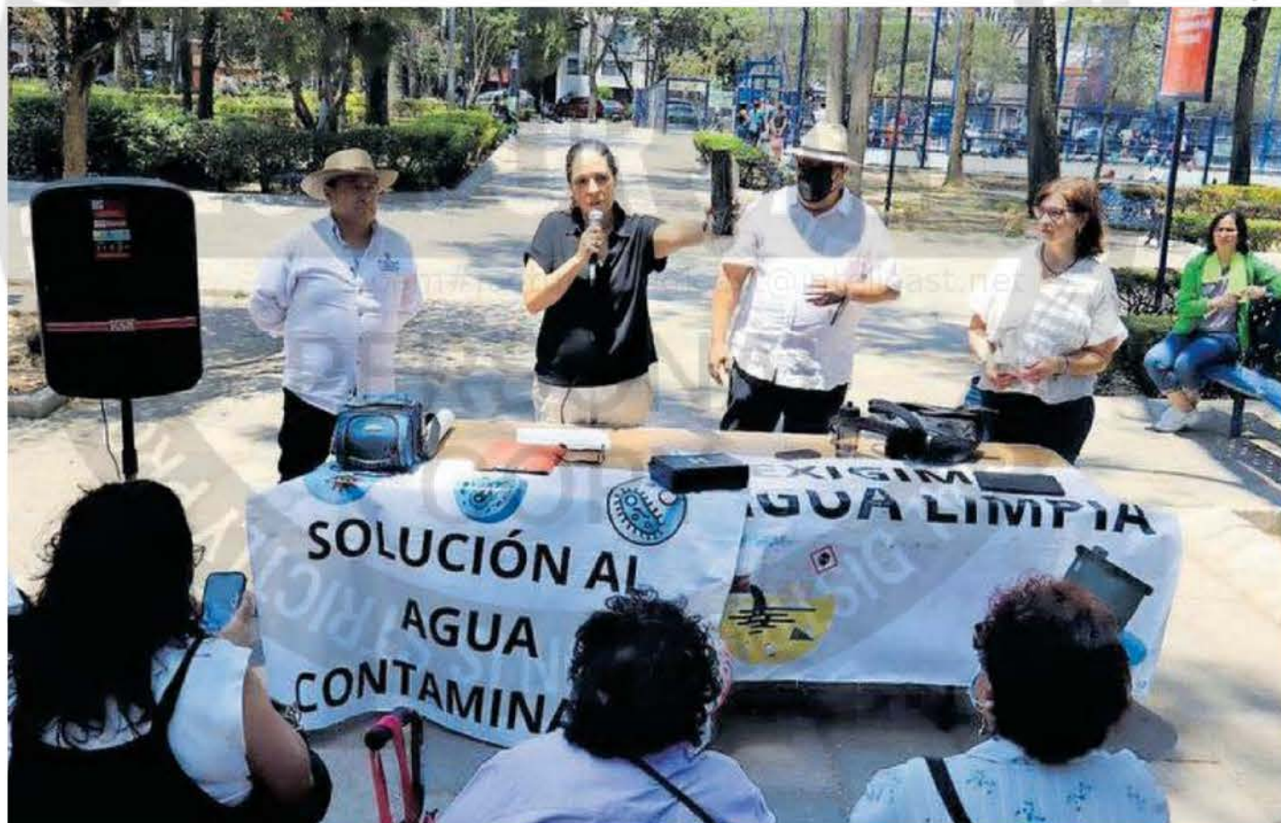
Los habitantes denuncian que sigue la llegada de líquido contaminado a sus casas