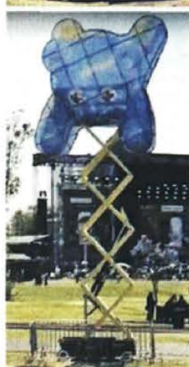
MH asegura que los osos no estaban; la organizadora hasta los difundió en redes.

"Cero impunidad, aunque primero habrá que probar este dicho de una supuesta amistad de una persona con el dueño de la empresa", afirmó.