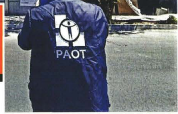
El inmueble de Playa Miramar 386 sumaba dos pisos ilegales que fueron demolidos en las últimas semanas.

Da Banobras en comodato inmuebles a la CDMX