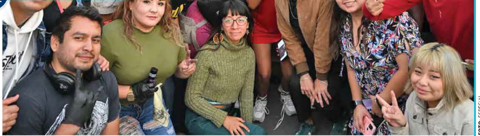
• EDUCACIÓN. Sheinbaum y Brugada visitaron una escuela para jóvenes en Iztapalapa, construida con contenedores.

"Hemos decidido instrumentar varias medidas. Una