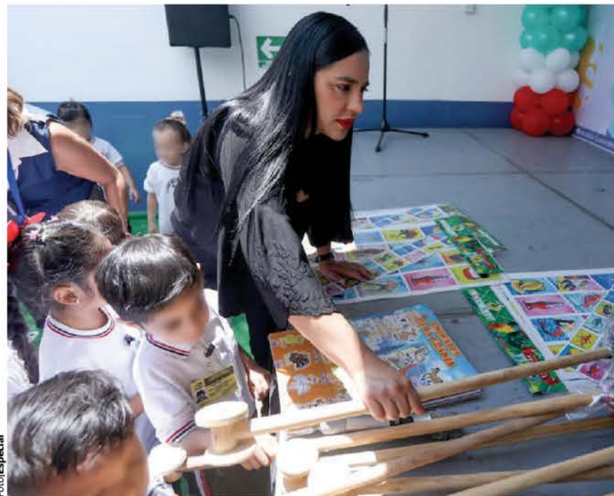
SANDRA Cuevas, al impulsar un programa en el Cendi Melchor Ocampo, en 2023.

En su Informe General Ejecutivo de la Cuenta Pública 2023, el órgano de fiscalización local detalló que los centros de servicio de la demarcación tuvieron una capacidad para la atención de mil 188 infantes; no obstante, sólo recibió a personas de entre tres y cinco años y 11 meses de edad.