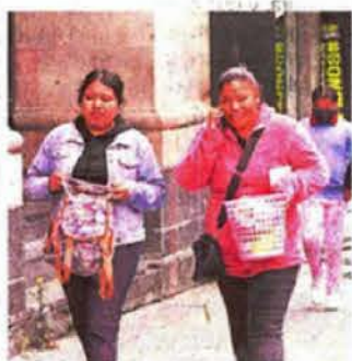
En 2024 la fuerza laboral en el Estado de México ascendió a 8.1 millones de personas.

Se dijo a conocer que, en el tercer trimestre de 2024, la fuerza laboral ocupada en la entidad alcanzó las 8.1 millones de personas, concentradas mayormente en trabajos como ventas, despachadores, comerciantes en establecimientos y trabajadores domésticos. ●