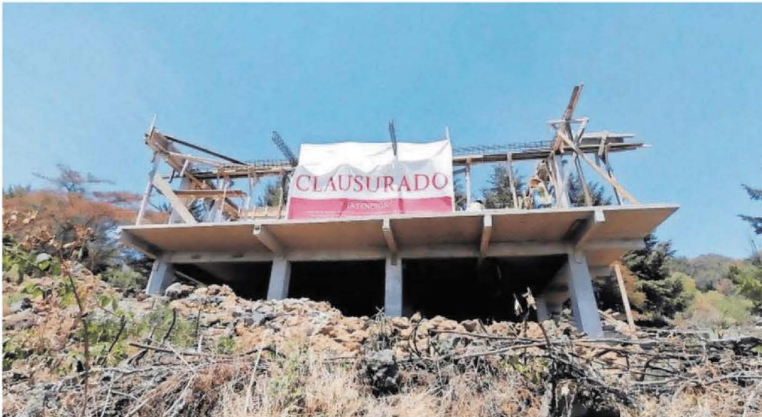
El operativo del rescate se realizó sin incidentes.