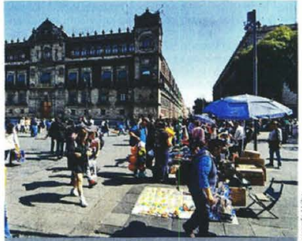
Escena cotidiana en el Centro Histórico, pese a que en este perímetro no debería haber comercio ambulante.

De acuerdo con el Secretario de Gobierno capitalino, César Cravioto, la acción será a través de un convenio de comodato, con el que las autoridades locales podrán hacer uso de dichos espacios como forma de préstamo temporal, siempre y cuando se garantice el cuidado y mantenimiento durante la ocupación. "Acabamos de firmar un convenio de comodato de algunos inmuebles que nos está dando de manera muy generosa Banobras para que, mientras ellos construyen proyectos a favor de la Ciudad, podamos utilizarlos para que temporalmente estén comerciantes (de) vía pública", señaló. "Eso nos va a ayudar mucho para reordenar algunos lugares del Centro de la Ciudad y son ubicaciones magníficas que, obviamente, los comerciantes estarán muy contentos de estar ahí. Insisto su apoyo para este programa de reordenamiento". Durante la firma del