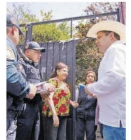
La jefa de Gobierno quiere estar más cerca de Milpa Alta.