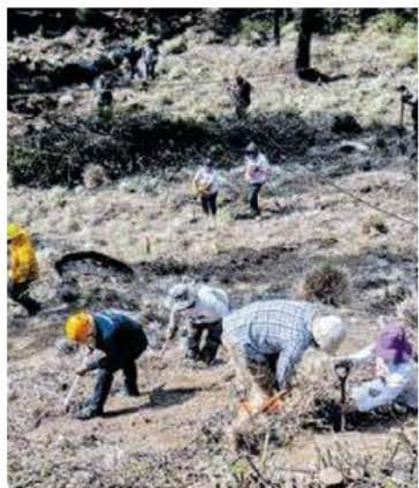
El Ajusco es un punto de rastreo