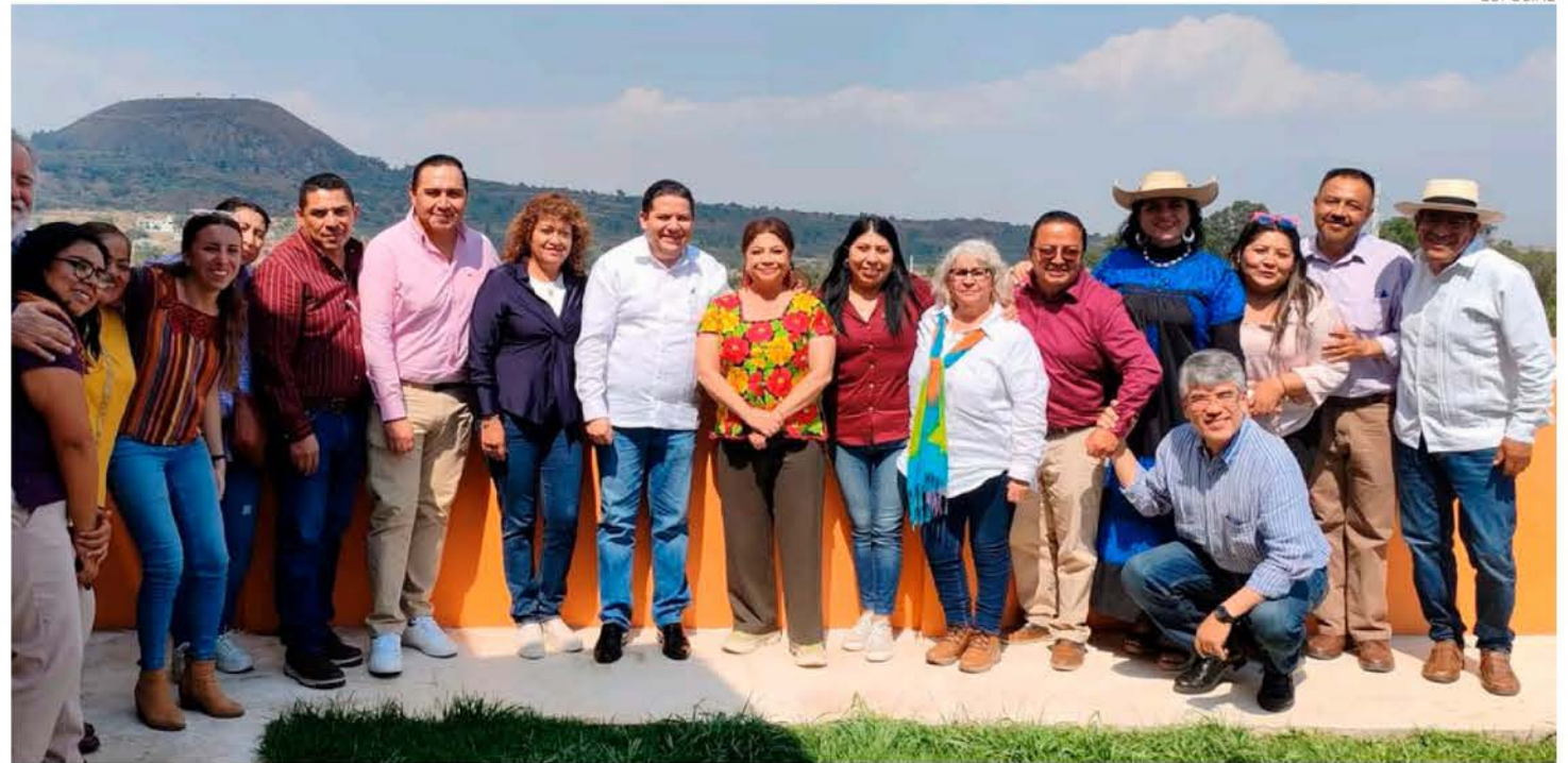
La jefa de Gobierno Clara Brugada informó que se recuperaron 70 hectáreas invadidas en San Andrés Totoltepec, Tlalpan.

El operativo de recuperación se llevó a cabo en las colindancias del Parque Ecológico El Tepozán, donde fueron detec-