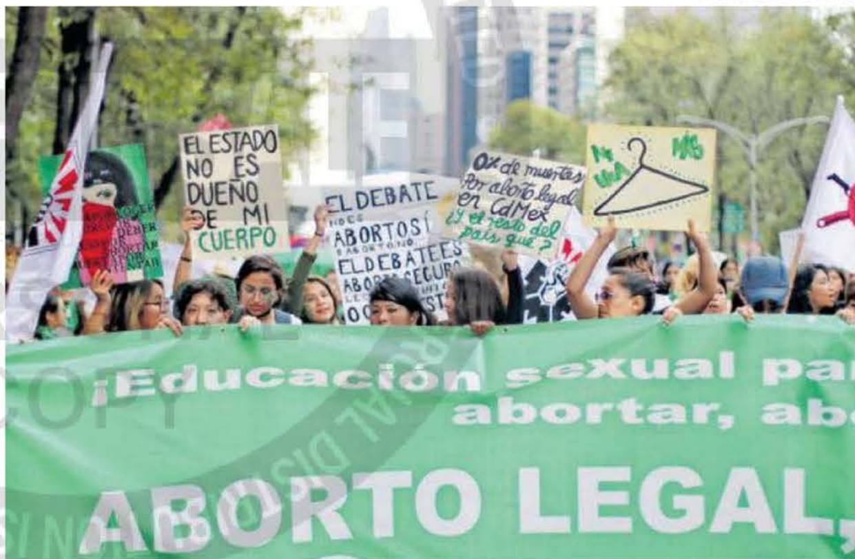
Las mujeres han reclamado su derecho a la interrupción legal del embarazo