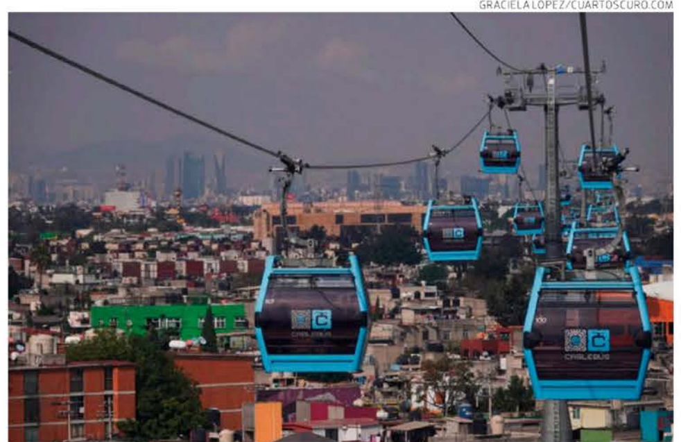
El Gobierno de la Ciudad de México dará prioridad a la movilidad en las zonas más alejadas.

La implementación del proyecto permitiría reducir el tiempo de traslado de los habitantes de Milpa Alta al Metro Tláhuac, pasando de dos horas a aproximadamente 30 minutos, lo que facilitaría su conexión con otras zonas de la ciudad. (Gerardo Mayoral)