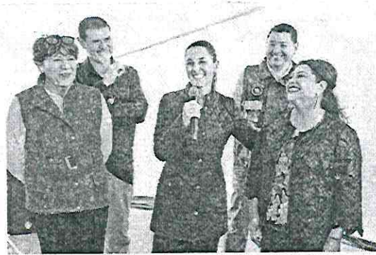
AVANCE. Delfina Gómez, Claudia Sheinbaum y Clara Brugada recorrieron el proyecto de movilidad que unirá a la CDMX con el Edomex.

El proyecto de movilidad constará de 102 unidades articuladas que podrán trasladar a 142 pasajeros a una velocidad promedio de 25 kilómetros por hora.