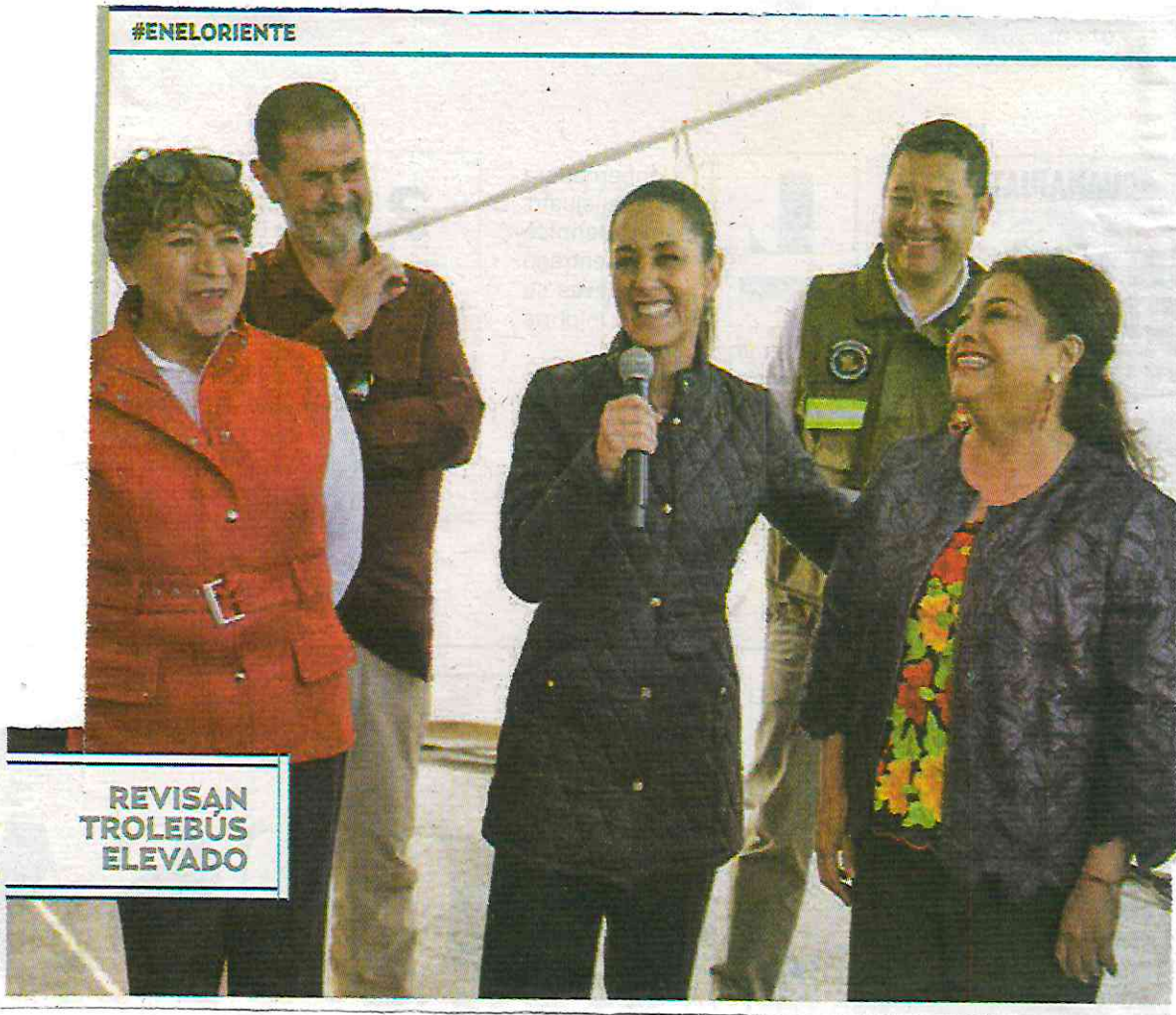
● La gobernadora Delfina Gómez 24 supervisó, junto con la presidenta Claudia Sheinbaum y la jefa de Gobierno de la CDMX, Clara Brugada, los avances del Trolebús Elevado Chalco-Santa Martha, que mejorará la movilidad de la zona oriente del Edomex y reducirá de 2 horas a 33 minutos el trayecto.