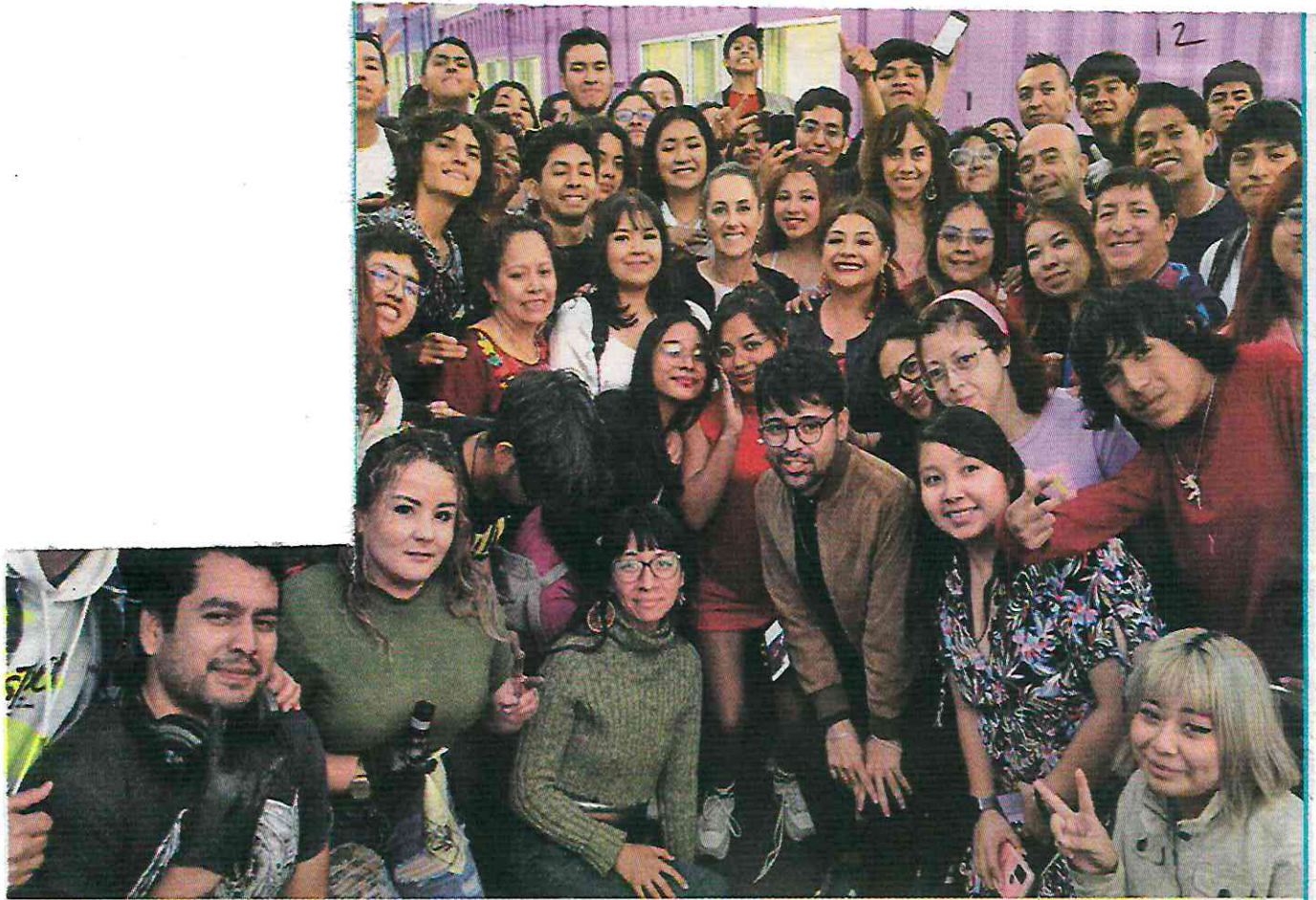
• EDUCACIÓN. Sheinbaum y Brugada visitaron una escuela para jóvenes en Iztapalapa, construida con contenedores.