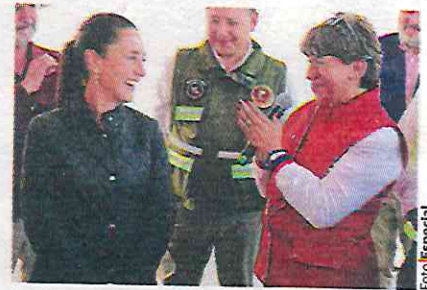
LA PRESIDENTA Claudia Sheinbaum (izq.) y la gobernadora Delfina Gómez, ayer.

Atenderá una demanda diaria de 120 mil usuarios, reduciendo los tiempos de recorrido de dos horas a 45 minutos y en servicio exprés 33 minutos. En su etapa