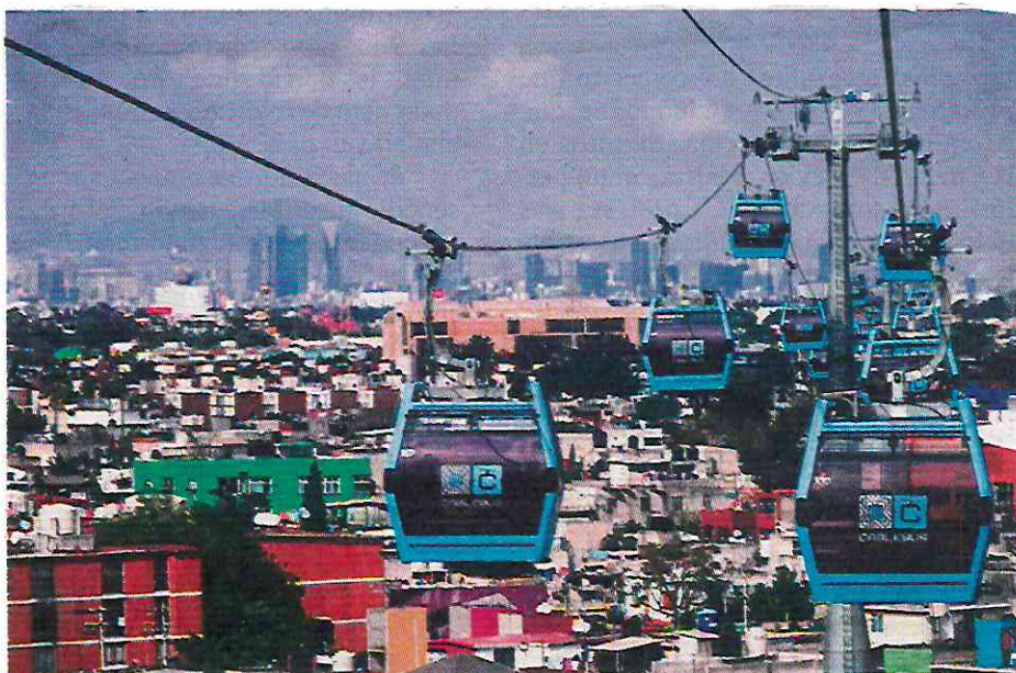
El Gobierno de la Ciudad de México dará prioridad a la movilidad en las zonas más alejadas.

La implementación del proyecto permitiría reducir el tiempo de traslado de los habitantes de Milpa Alta al Metro Tláhuac, pasando de dos horas a aproximadamente 30 minutos, lo que facilitaría su conexión con otras zonas de la ciudad. (Gerardo Mayoral)