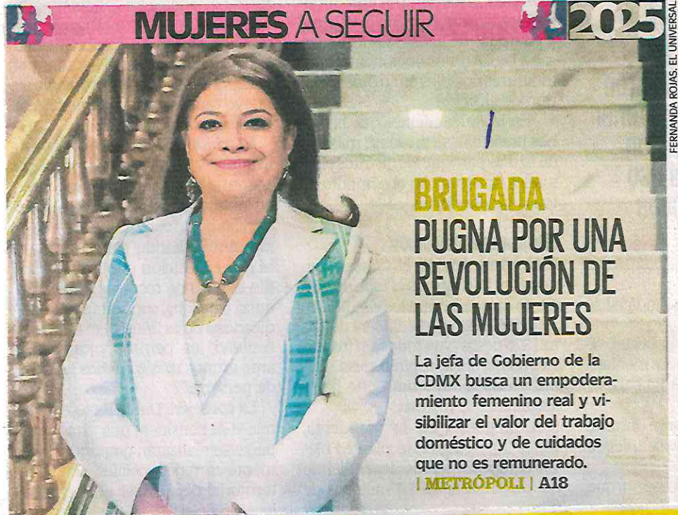
CLARA BRUGADA MOLINA Jefa de Gobierno de la Ciudad de México

“LA REVOLUCIÓN PENDIENTE ES LA DE LAS MUJERES”