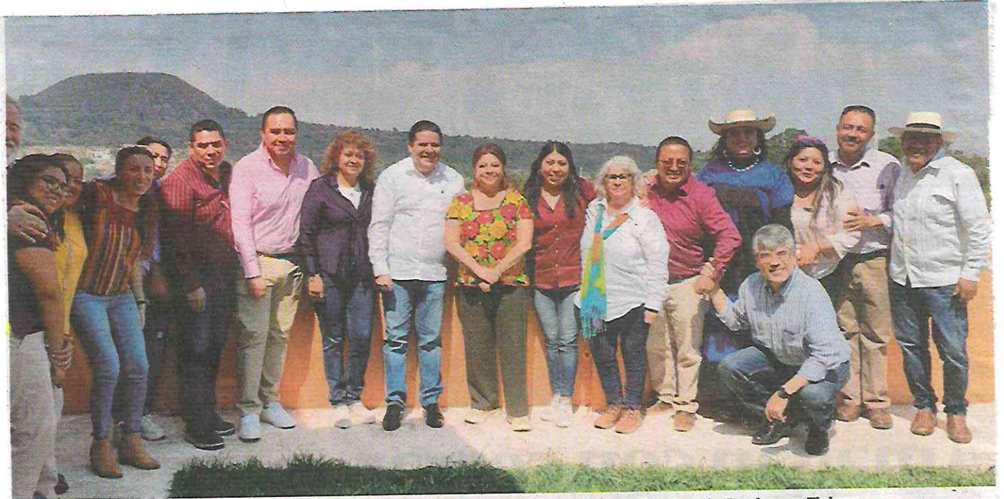
La jefa de Gobierno Clara Brugada informó que se recuperaron 70 hectáreas invadidas en San Andrés Totoltepec, Tlalpan.