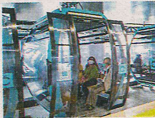
Una reducción de tiempo de hora y media

CIUDAD DE MÉXICO. - El gobierno de la Ciudad de México (GCDMX), encabezado por Clara Brugada, adelantó que el Cablebús de Milpa Alta conectará con el metro Tláhuac de la Línea 12. Prevén que se reduzca el tiempo de traslado de una hora y media a 30 minutos. "El