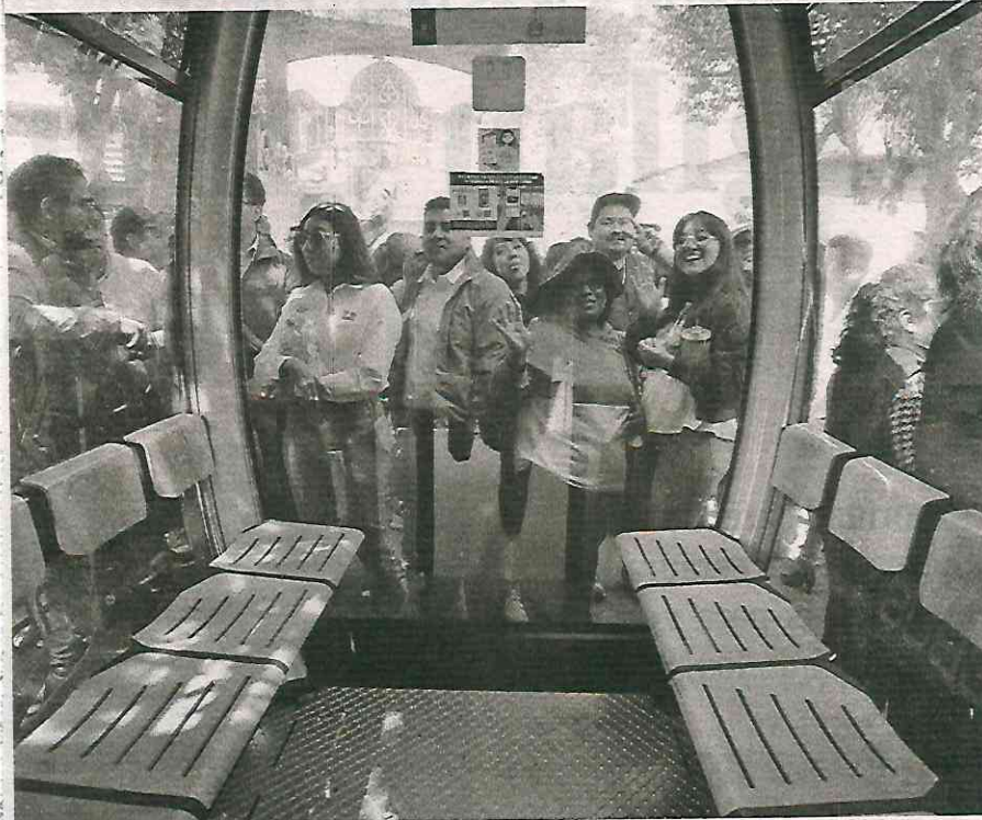
Tres estaciones del Cablebús estarán Milpa Alta y cuatro en Tláhuac