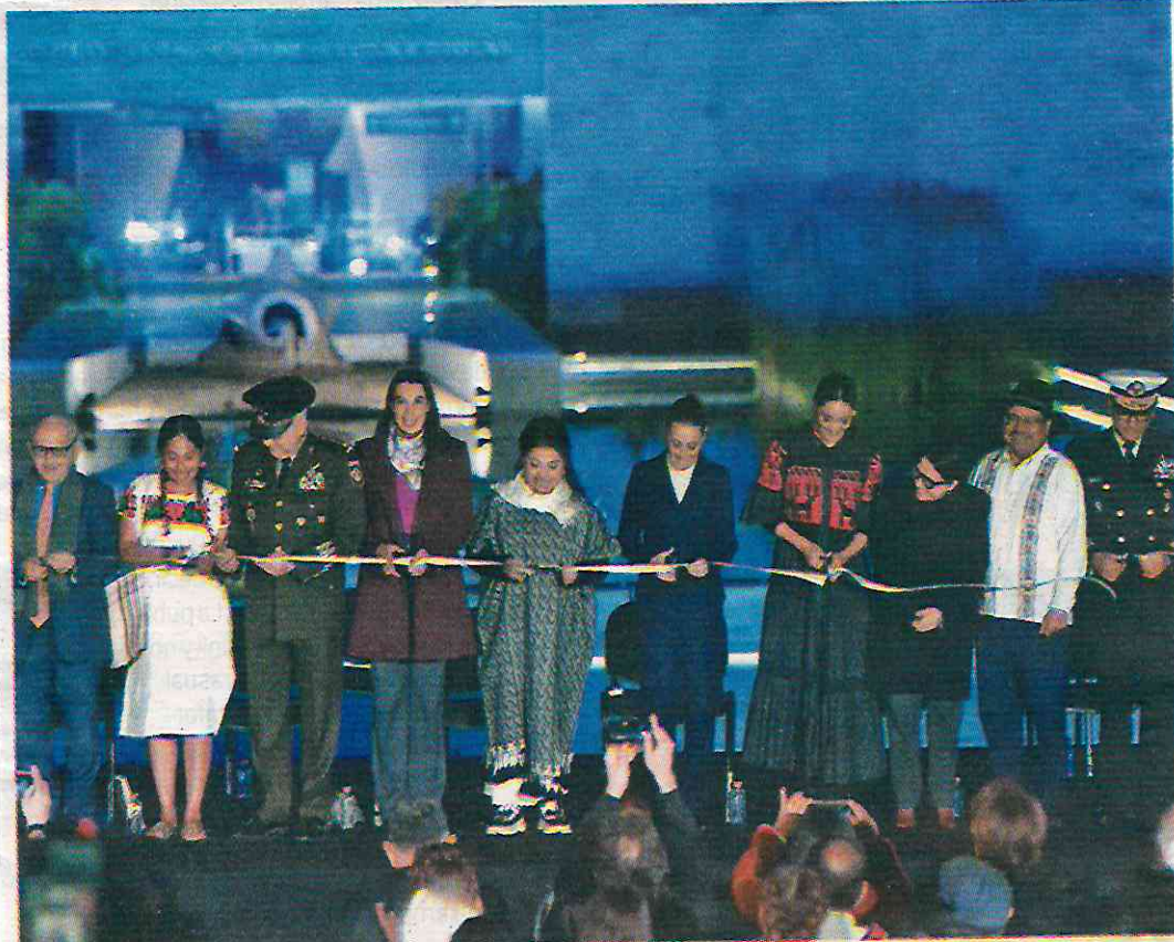
• FORO. La Presidenta encabezó la inauguración del segundo piso del Museo de Antropología.