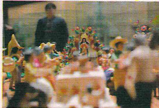
PARTE de los objetos que forman parte de esta museografía renovada.