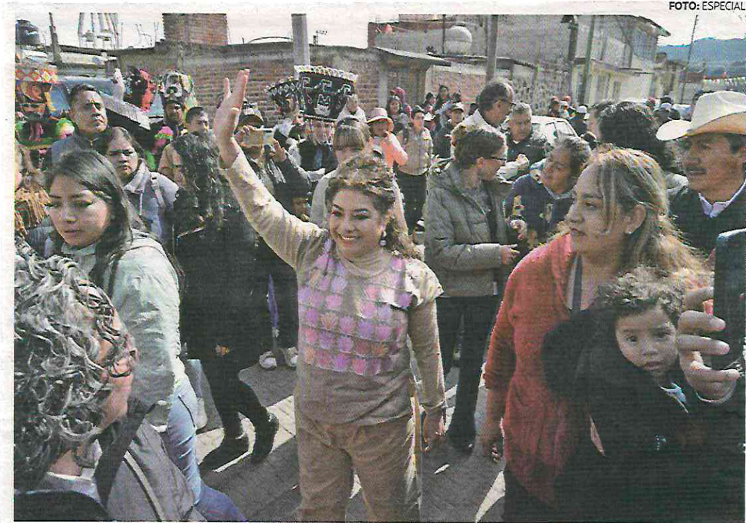
• ACCIÓN. Encabezó el programa La Ciudad Te Cuida y el Invierno Te Cobija, en Tlalpan.