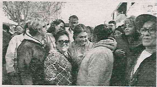
Apunta a mejorar las carreteras de los pueblos

Este plan abordará temas como movilidad, agua, seguridad y salud, con el objetivo de mejorar la calidad de vida de sus habitan-