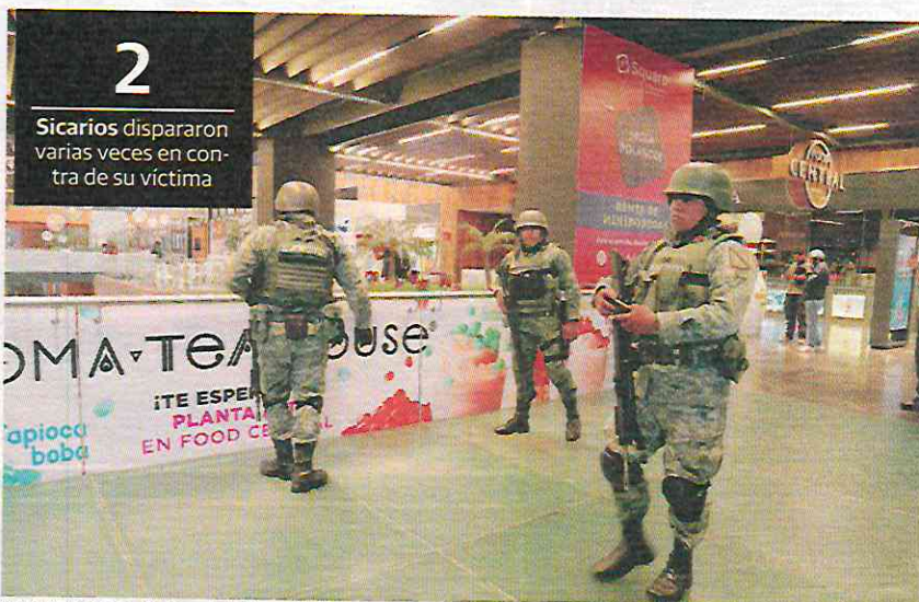
MILITARES vigilan la Plaza Miyana, en Polanco, tras el crimen, el pasado miércoles.

AUTORIDADES de la nación vecina identificaron al sujeto como responsable de lavar dinero del CJNG; fungía como manager de músicos de corridos; en México no era investigado