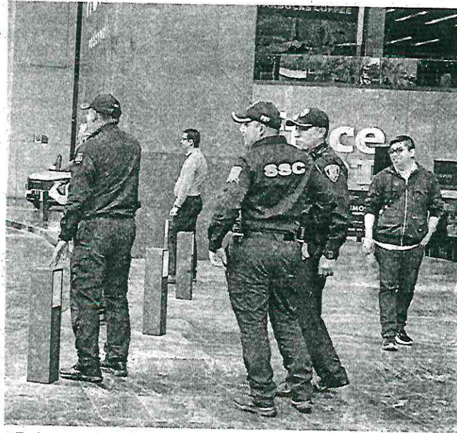
■ En la entrada de la Plaza Miyana se encontraban desplegados elementos de seguridad y una patrulla estacionada.

"(Quedamos) traumatados un poco, sí. Es que sí estuvo fuerte. Yo trabajo en el Pain (una panadería) y estaba limpiando cuando de repente se escucharon los balazos", mencionó una trabajadora