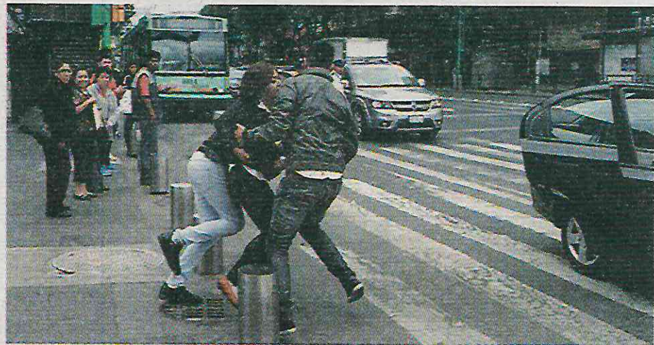
Los gobiernos capitalinos han quedado a deber en este tema fundamental

Al término de septiembre el total de delitos cometidos fue de 2 mil 587 y al finalizar octubre los números absolutos fueron de 2 mil 691. Los delitos que tuvieron un aumento significativo fueron narcomenudeo en 57 por ciento, robo a negocio en 20 por ciento,