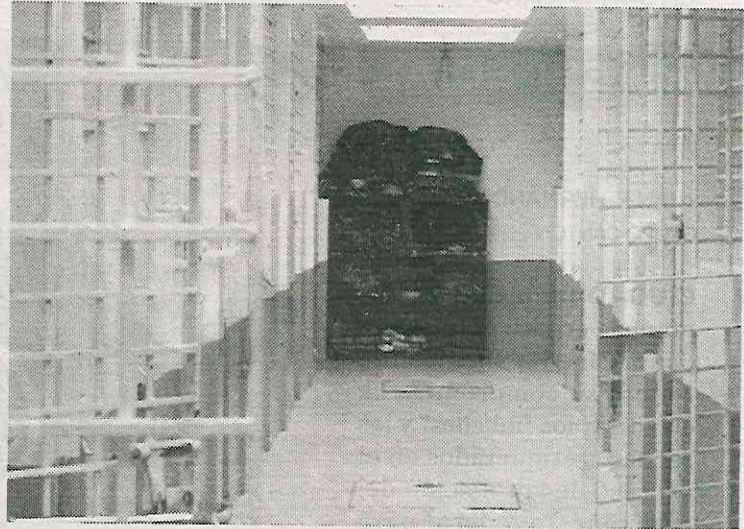
Las épocas decembrinas son las que más incidencia tienen

El Centro tiene una capacidad para 124 personas, 72 hombres y 52 mujeres