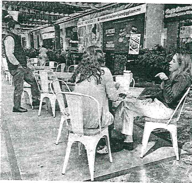
■ Comensales que acudieron ayer a los restaurantes comentaron sentirse tensos por lo acontecido.

que estuvo en el momento de la balacera.