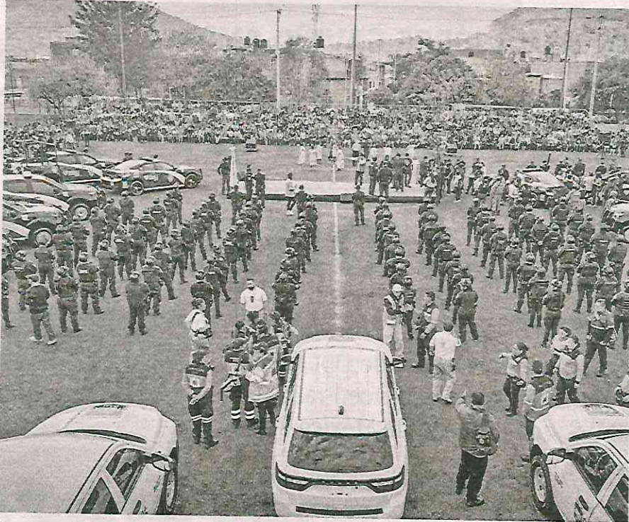
Los operativos se han llevado a cabo en zonas con alta incidencia delictiva