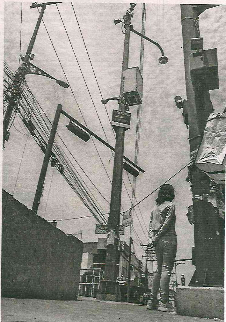
En las 16 alcaldías de la Ciudad de México hay equipos con fallas

Los equipos averiados se encuentran principalmente en las alcaldías Iztapalapa, Cuauhtémoc y Gustavo A. Madero