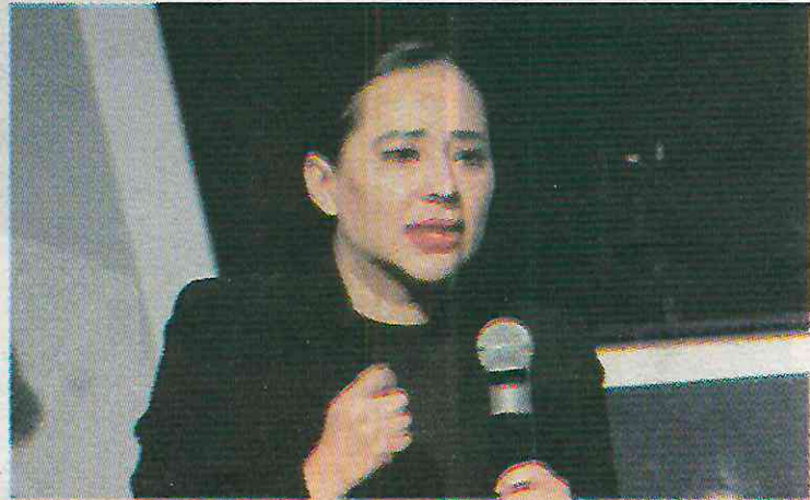
Lo hizo para publicitarse en redes sociales

La Cuauhtémoc entregó al menos ocho contratos a la firma Materiales y Procedimientos de México S.A. de C.V.