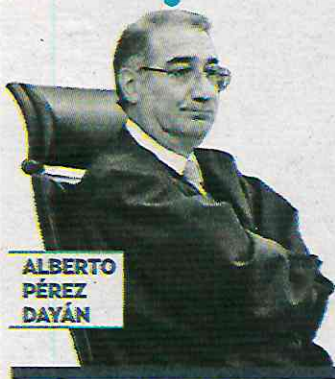
ALBERTO PÉREZ DAYÁN

› Fue Alberto Pérez Dayán quien dio la estocada final al intento de anular parte de la Reforma Judicial de la 4T. Desde el inicio de la discusión, el ministro hizo explícito su desacuerdo con el proyecto de su compañero Juan Luis González Alcántara Carrancá , pues consideró que las acciones de inconstitucionalidad interpuestas debían declararse improcedentes. Y más tarde lo ratificó con su voto en contra de que la invalidez procediera con el voto de seis integrantes del pleno.