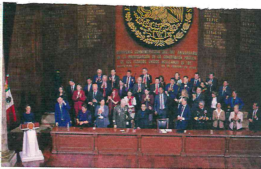
LA PRESIDENTA Claudia Sheinbaum, ayer, durante su discurso en Querétaro. 4