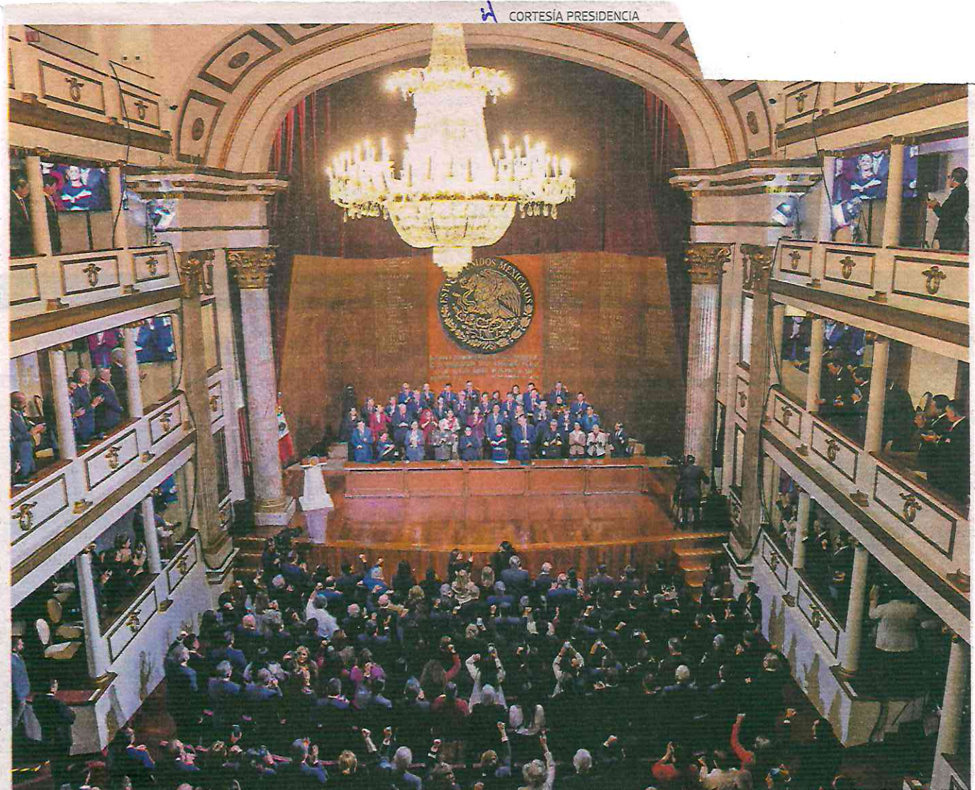
Ceremonia de conmemoración del 108 aniversario de la Constitución Política de los Estados Unidos Mexicanos