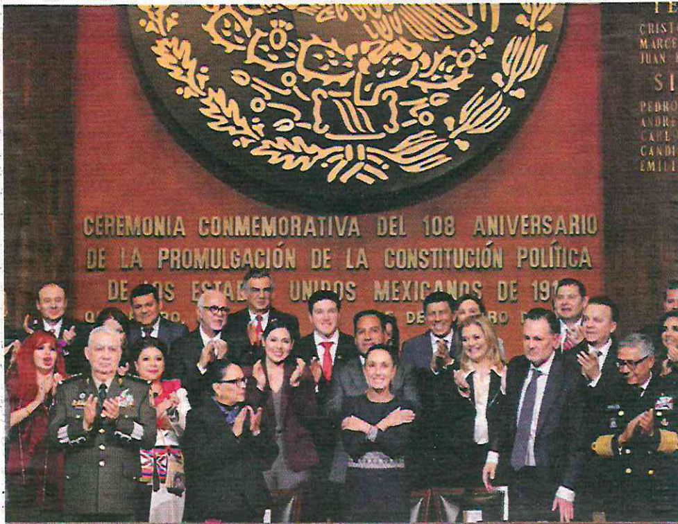
LA PRESIDENTA, ayer, en Querétaro arropada por gobernadores y su gabinete. 1