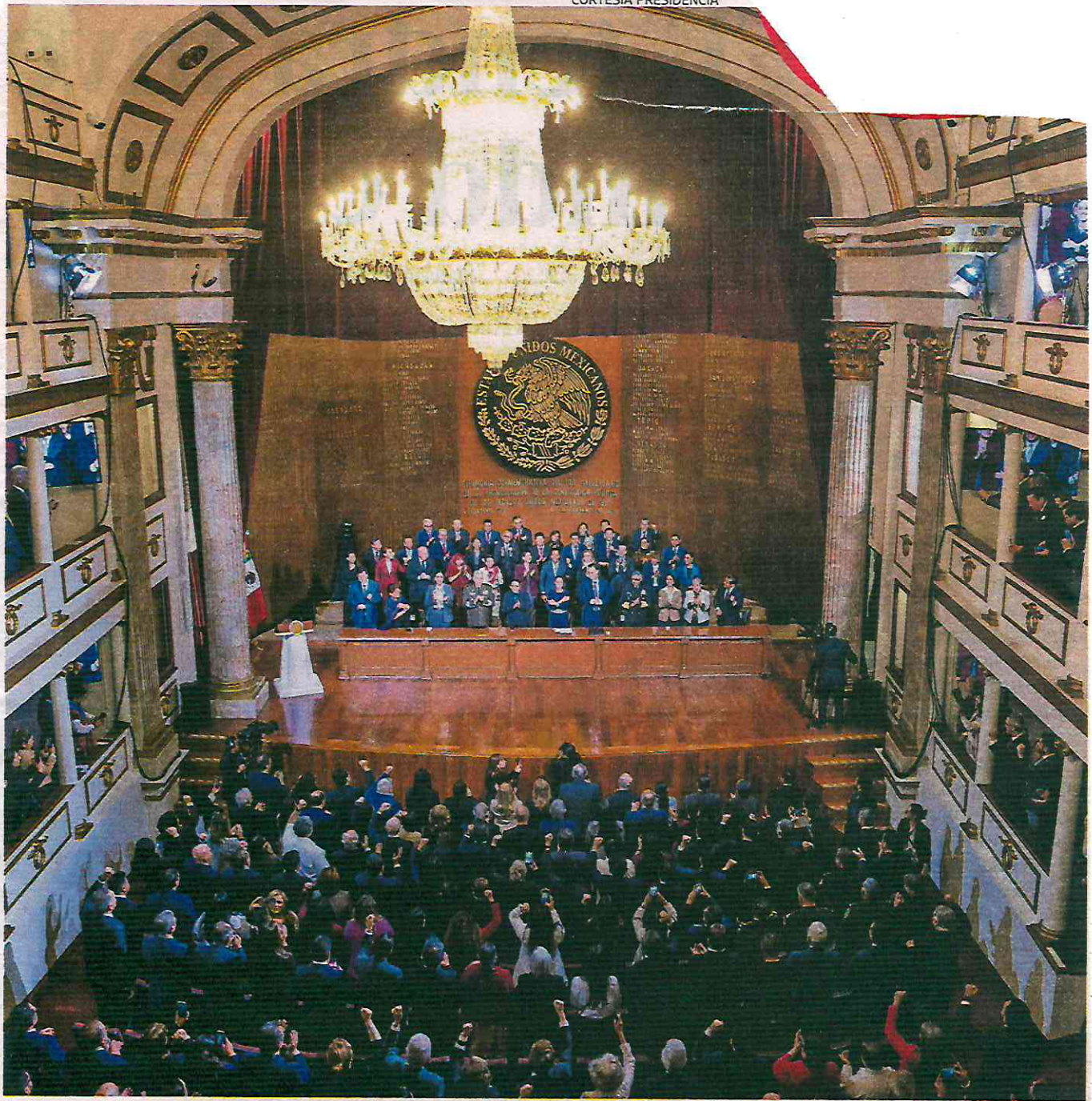
Ceremonia de conmemoración del 108 aniversario de la Constitución Política de los Estados Unidos Mexicanos