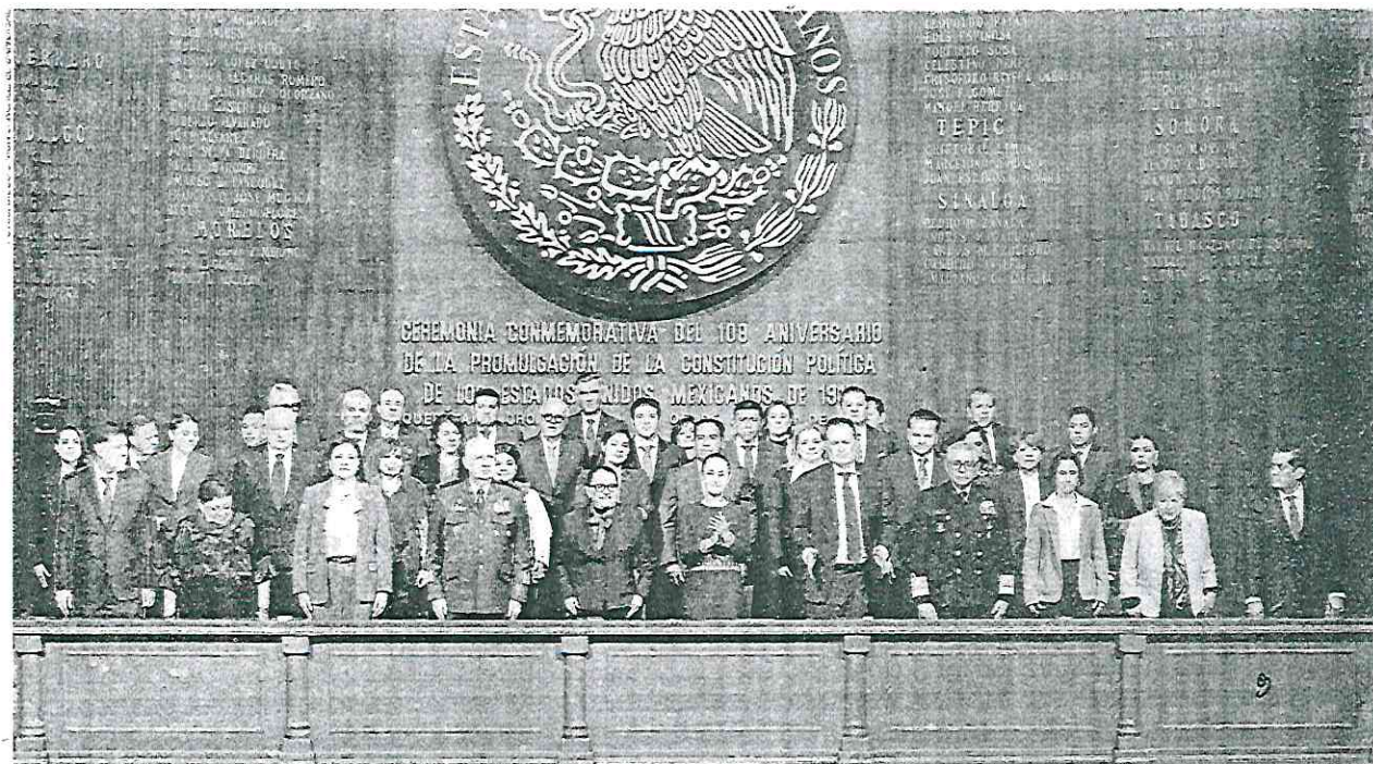
Claudia Sheinbaum, presidenta de México, encabezó el 108 aniversario de la promulgación de la Constitución en el Teatro de la República de la capital queretana.