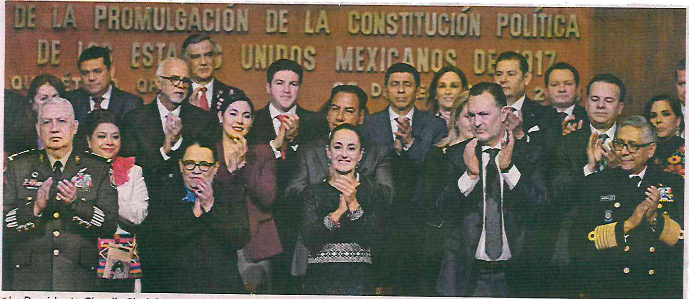
La Presidenta Claudia Sheinbaum encabezó en la ciudad de Querétaro la ceremonia por el aniversario de la Constitución, acompañada por Gobernadores del Morena y otros partidos e integrantes del gabinete federal.