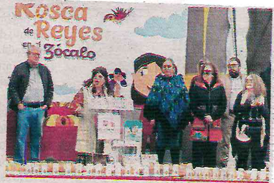
El evento fue positivo

La mandataria también destacó las iniciativas implementadas por su gobierno para mejorar