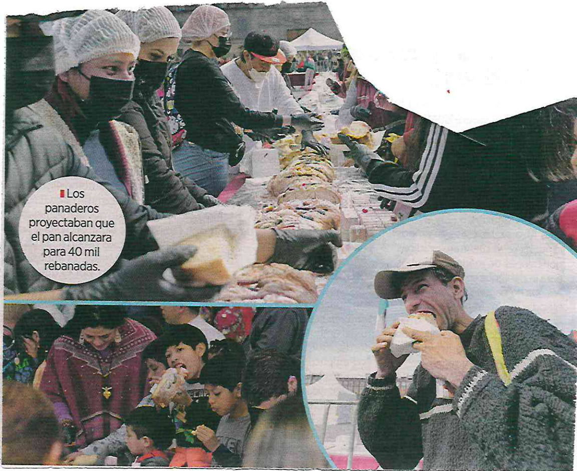
■ Los panaderos proyectaban que el pan alcanzara para 40 mil rebanadas.