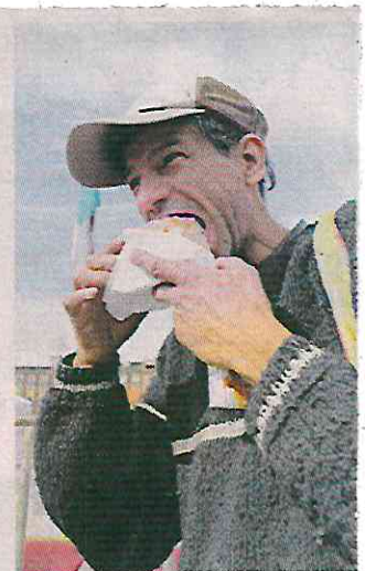
Tras probarla, aseguraron que todo valió la pena.

Además de que se repartieron 20 mil porciones de un cuarto de leche de sabor patrocinadas, 4 mil 500 libros de literatura infantil y 15 mil juguetes lúdicos.