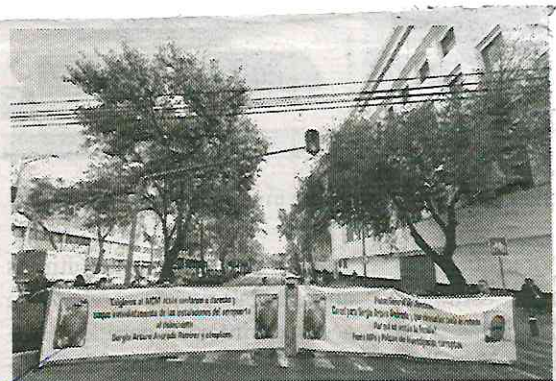
Manifestación fue afuera de la Fiscalía capitalina

Posteriormente, una representación de los manifestantes