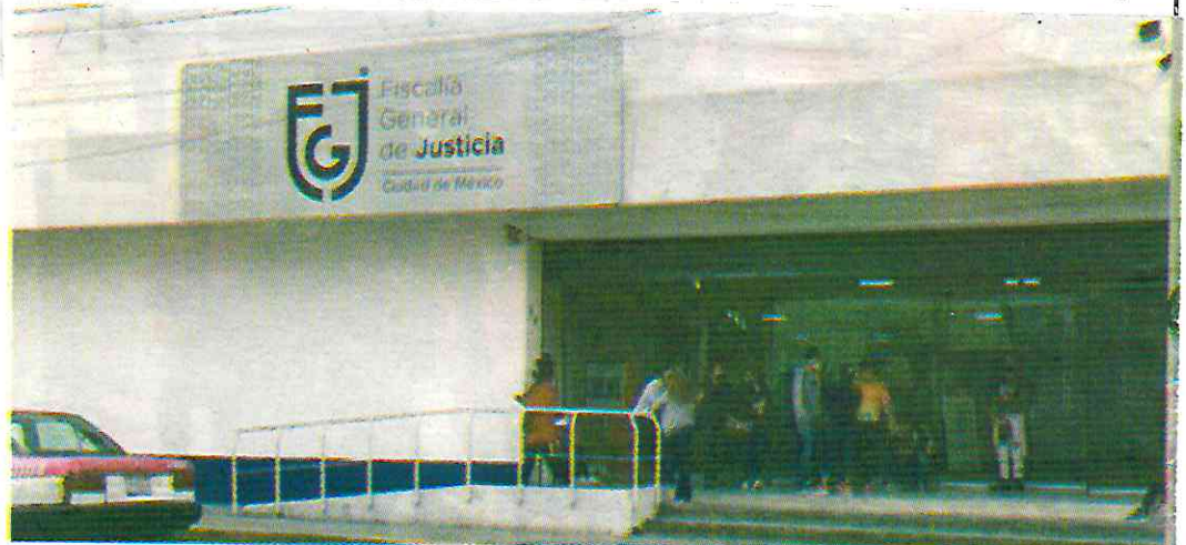
Conforme al artículo 22 de la Ley General de Víctimas, los servidores públicos de la FGJCDMX incurrieron en actos negligentes al proporcionar a personas no involucradas, detalles de la investigación.

“Ésta es una denuncia que quieren llevar a la impunidad, desde la declaración de Óscar Franco, él dice que no hay delito que perseguir, todas las personas que mencioné son asesores de Ernestina Godoy, la violencia institucional está presente porque hay un control y dominación del caso, con la finalidad de que desista, solicito a la Fiscalía General de la República, que conozca de las carpetas de investigación en contra de Federico Vera y se deshaga la red de corrupción que no solo me daña a mí, si no a muchas más personas, a lo largo de esta administración de casi cinco años, en la cual existen casos no resueltos, quedando impunes y los delincuentes libres”.