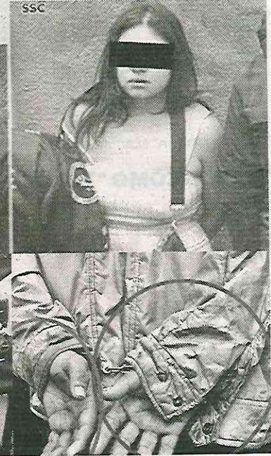
Se sentían intocables

lante, donde le marcaron el alto al sujeto que se encontraba en compañía de una mujer.