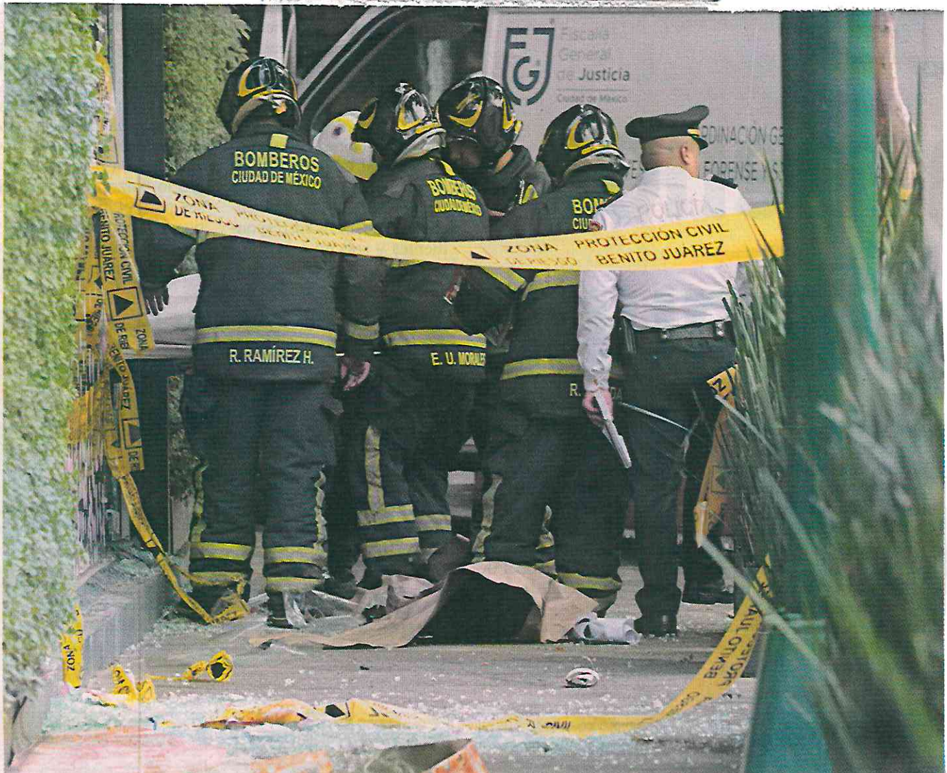
■ Uno de los trabajadores falleció al interior del local comercial que estaban arreglando.