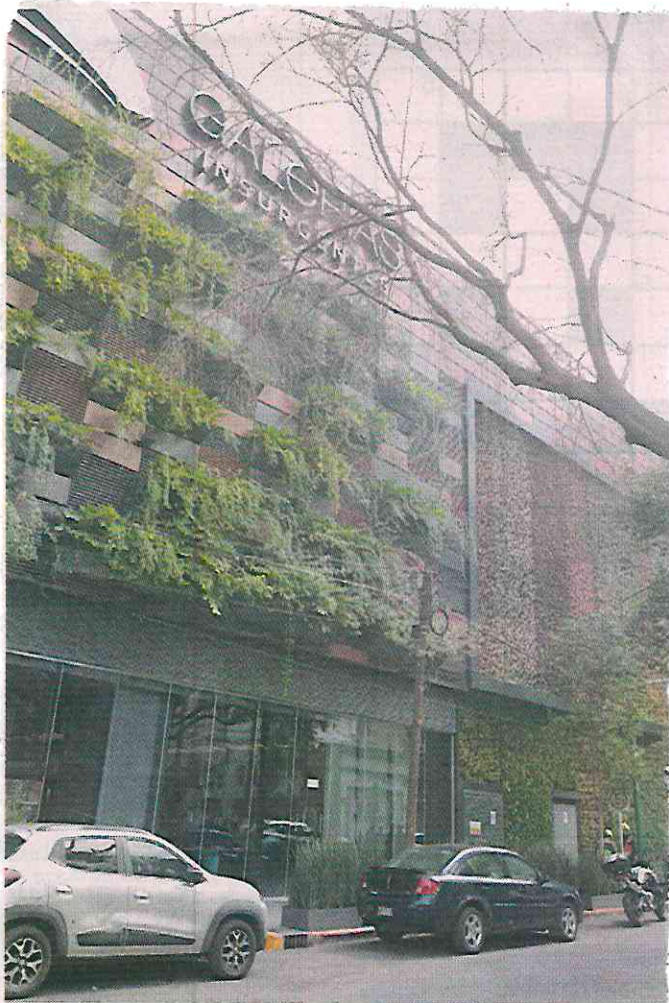
La explosión ocurrió en la esquina de Oso y Parroquia, en la Colonia del Valle.