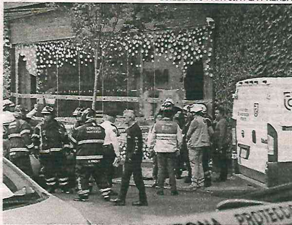
Los paramédicos atendieron la emergencia

El personal de Bomberos informó que la explosión se debió a la quema de espuma de poliuretano, fibra de vidrio y tela