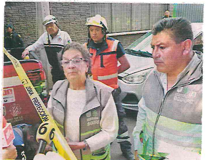
Myriam Urzúa, titular de Protección Civil, acudió al lugar del percance.