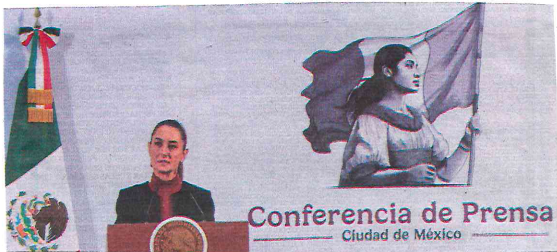
Conferencia de Prensa Ciudad de México

Integral, también contempla acciones para el saneamiento de algunas zonas que históricamente han estado muy contaminadas como por ejemplo el Valle del Mezquital o Tula, considerado uno de los municipios más contaminados del país.