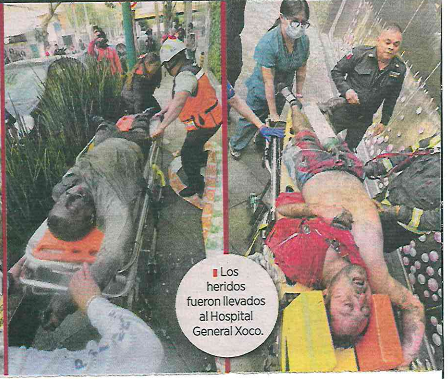
Los heridos fueron llevados al Hospital General Xoco.