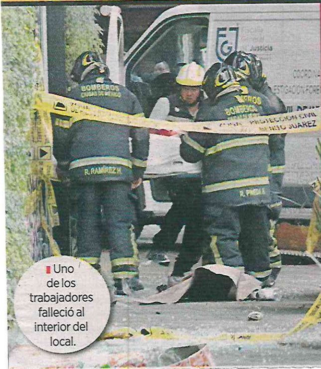
Uno de los trabajadores falleció al interior del local.

DEJA UN ESTALLIDO EN CENTRO COMERCIAL UN MUERTO Y DOS HERIDOS