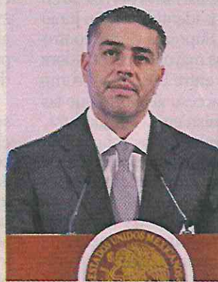
El titular de la SSPC, Omar García Harfuch, en conferencia con la Presidenta.

Según la iniciativa, la reforma habilitaría a los agen-