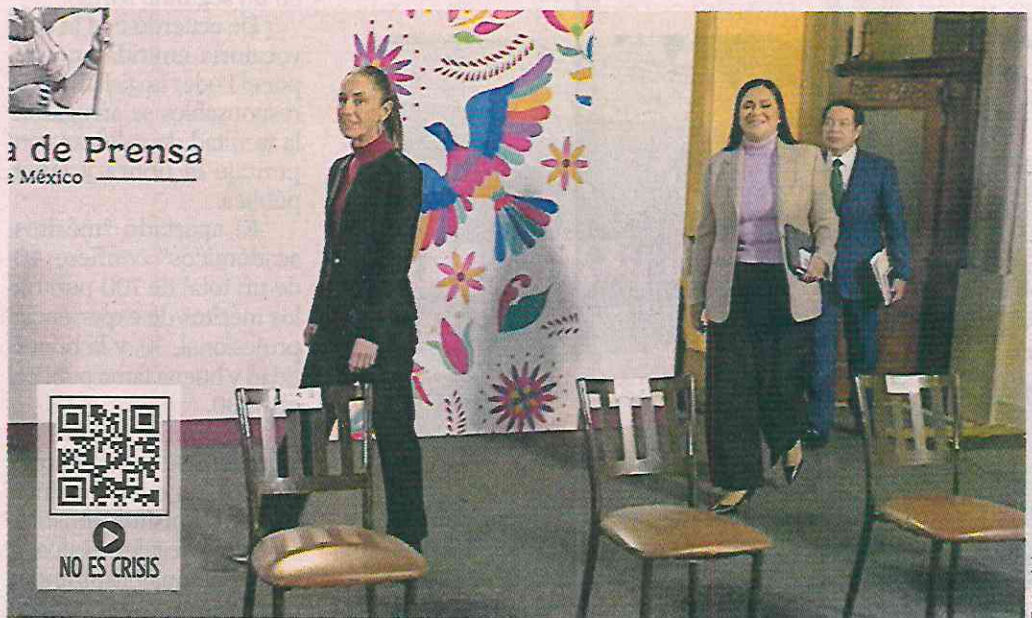
La Presidenta Sheinbaum durante su mañana en Palacio Nacional, en la que participaron los Secretarios de Bienestar, Ariadna Montiel, y de Educación, Mario Delgado.