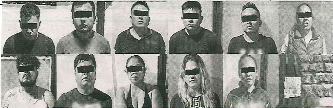
Ahora sí les cayó la voladora