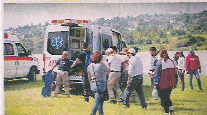
La búsqueda abarcó ríos y bosques aledaños al lugar de la desaparición. El cuerpo fue hallado ayer en la Presa Taxhimay.