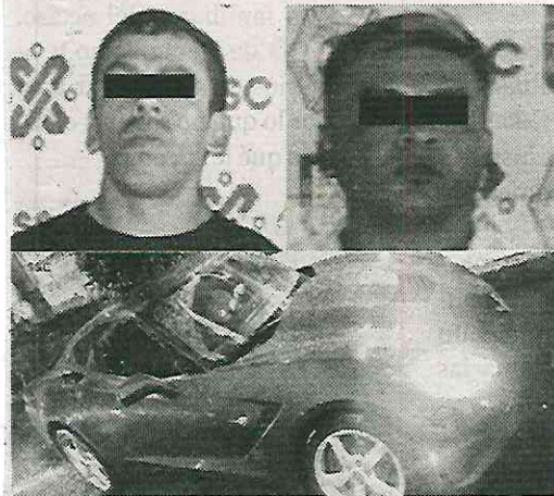
Eran dealers de "lujo"

Finalmente, los efectivos policiales detuvieron a los hombres de 29 y 40 años y junto con lo asegurado fueron remitidos al MP, quien determinará su situación legal por los delitos de narcomenudeo, asociación delictiva y delitos contra la salud.