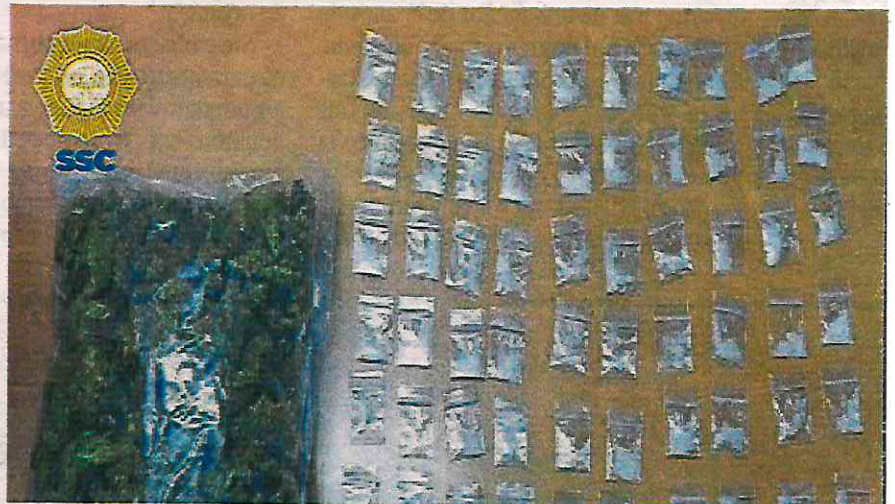
Los implicados se dedicaban al narcomenudeo, extorsión de comerciantes, así como a transporte público