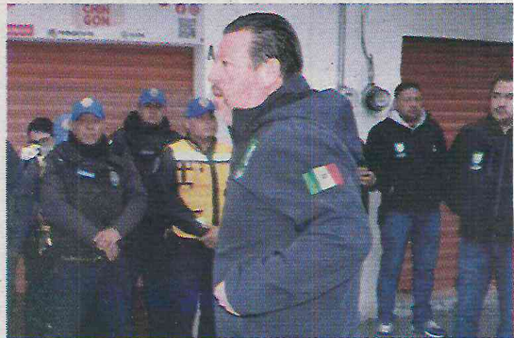
El alcalde priísta aumento 5% los siniestros durante su mandato

Los crímenes que más se cometen en la demarcación fueron los robos y daños al patrimonio