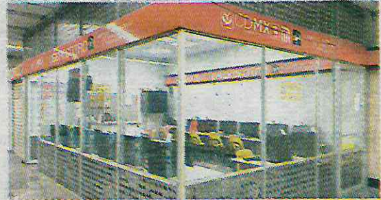
Las quejas se registran desde hace cuatro años

“Abren cuando quieren, la semana pasada vino este cuate a abrirlo”, mencionó un elemento de seguridad en la estación. También, por medio de una llamada telefónica, personal telefonista de los cibercentros confesó que el ubicado en la estación Pino Suárez de la Línea 2 se encontraba sin operaciones a las 15:30 horas del mismo 23 de agosto. De igual forma, los ubi-