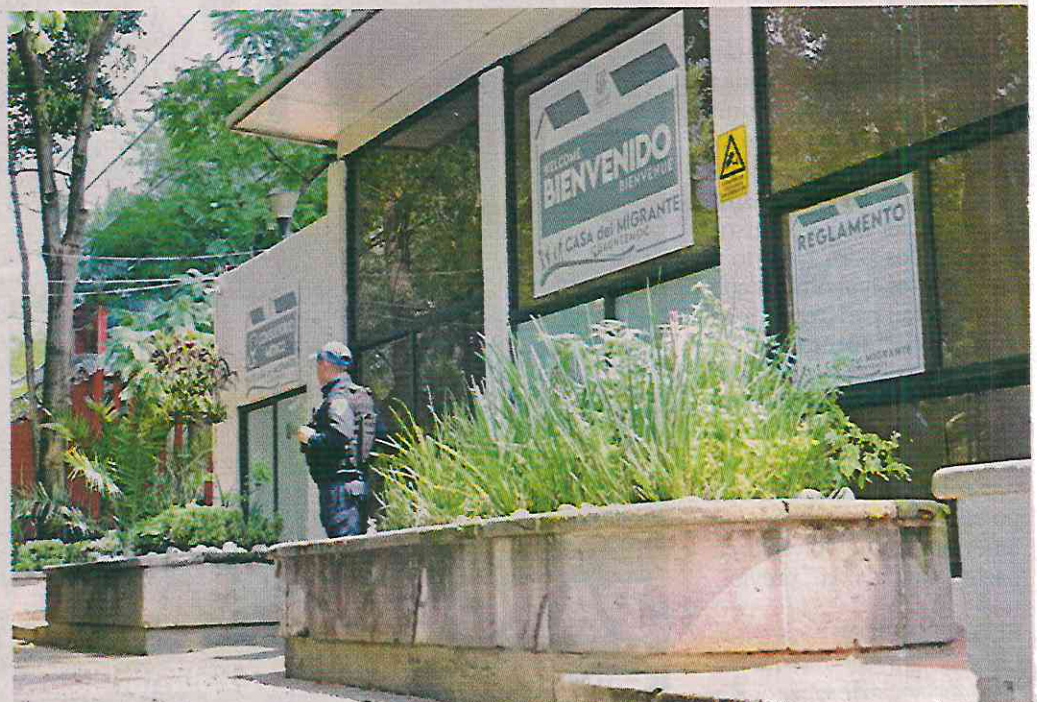
■ La Casa del Migrante abrió el 20 de abril de 2023, en la gestión de Sandra Cuevas.

REFORMA publicó desde el 13 de junio que colonos