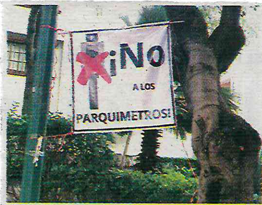
En la Del Vale y Tlacoquemécatl