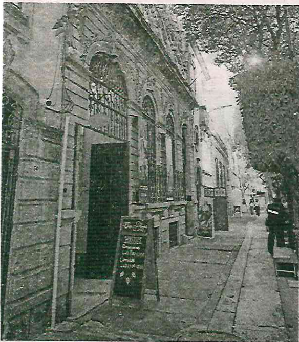
En la colonia Roma Norte hay 200 inmuebles catalogados con valor patrimonial