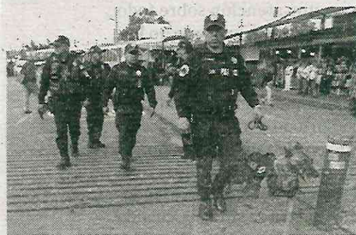
No cuidan los puestos de la zona

De acuerdo con un último informe del Organismo Regulador de Transporte de CDMX en un año se remitieron 241 infractores al juez cívico