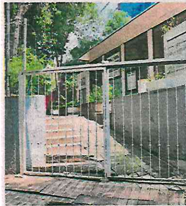
La Casa del Migrante abrió en marzo de 2023.

Este miércoles, la decisión se informó durante la reunión que sostuvo el alcalde de Cuauhtémoc, Raúl Ortega Rodríguez, y los concejales en el salón de Cabildos de la demarcación. ●