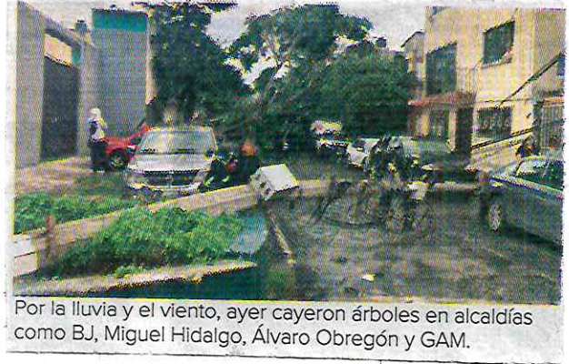
Por la lluvia y el viento, ayer cayeron árboles en alcaldías como BJ, Miguel Hidalgo, Álvaro Obregón y GAM.

“Estamos en plena recuperación, sin echar las campanas al vuelo; el Sistema Cutzamala trae un promedio de 42% en su registro total a finales de agosto, quiere decir que nos hace falta todavía recibir más lluvia”, dijo.