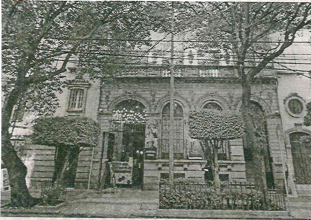
Demandan al presidente Andrés Manuel López Obrador que emita la Declaratoria de Zona de Monumentos Artísticos para estas colonias