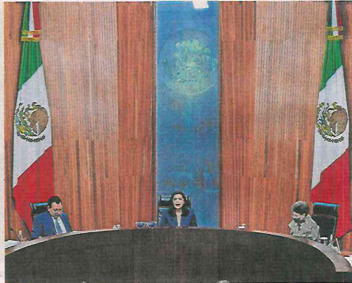
El caso discutido en el TEPJF surgió a raíz de una denuncia contra el PAN por un spot en el que aparece un niño creado con IA.

Por tanto, se vincula al INE a modificar los lineamientos para la protección de la niñez y adolescencia, a fin de implementar mecanismos de verificación que garanticen el uso de imágenes creadas con tecnología que