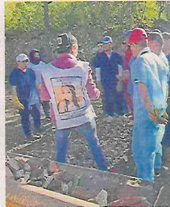
Las características del terreno complican la búsqueda.

doras, las brigadas analizaron cada montón de tierra, dividiéndose en dos grupos para ampliar el perímetro de búsqueda, quienes con una rejilla filtraban la tierra recolectada por la maquinaria.