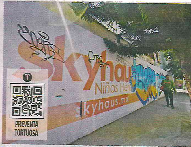
■ El de Niños Héroes debió entregarse en mayo 2024. Aún no se han demolido las casas donde tendría que estar.

Cerdas se acercó a ICM en 2018 para coinvertir en los ocho proyectos residenciales en las alcaldías Benito Juárez y Cuauhtémoc, que en conjunto contemplaban la