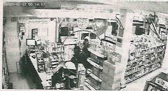
Momento de los hechos

El oficial, de 28 años, llevará su proceso en libertad, mientras se desarrolla la investigación y se llega a una conclusión final.