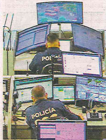
El sistema del C5 es fundamental para la procuración de justicia en la CdMx