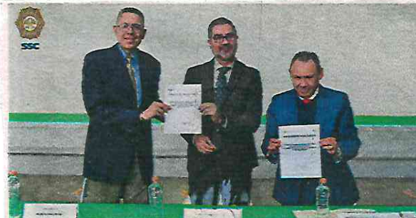
El objetivo del programa es bajar cotidianamente con las personas juveniles.

En los años 2020 y 2021, la Subsecretaría del Sistema Penitenciario de la SSC, trabajó en conjunto con el IAPA para crear el Centro Alas de Libertad (CAL) en el CEA-SF, cuyo modelo está basado en las Comunidades Terapéuticas, con una atención sistémica e interdisciplinaria para impactar en los adolescentes que han transgredido la Ley, para así integrarse de una forma exitosa a sus familias y a la sociedad.