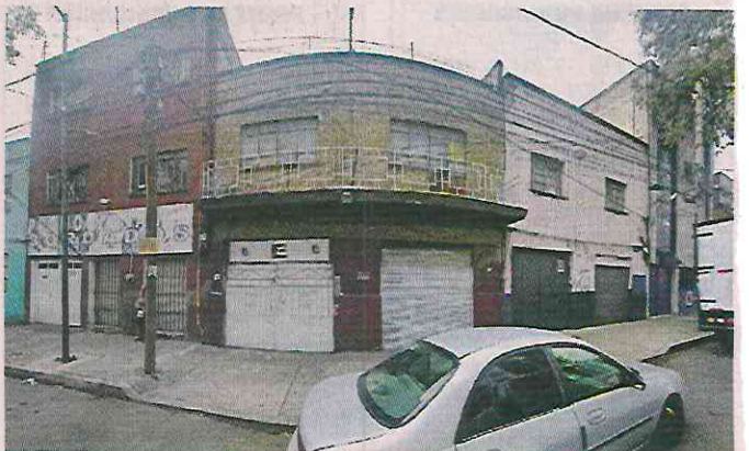
Oficiales del Sector Asturias frustraron el intento de despojo del inmueble, luego de atender una llamada de auxilio al 911.