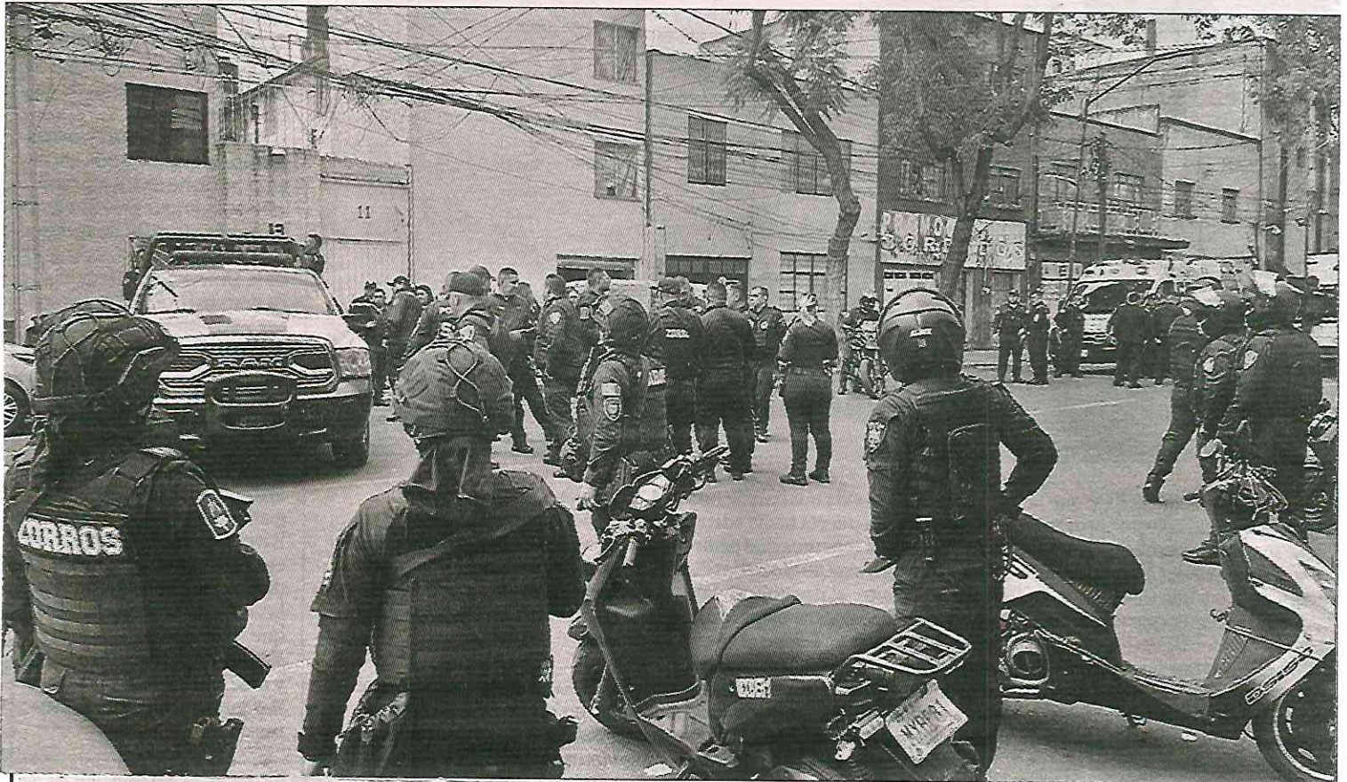
◀ Al menos 15 detenidos y el decomiso de cinco armas de fuego, entre ellas una de alto calibre, fue el saldo de un intento de despojo de un inmueble en la colonia Obrera, alcaldía Cuauhtémoc, por policías de la capital.

Las otras cuatro personas que lo acompañaban se identificaron como personal de la Secretaría de