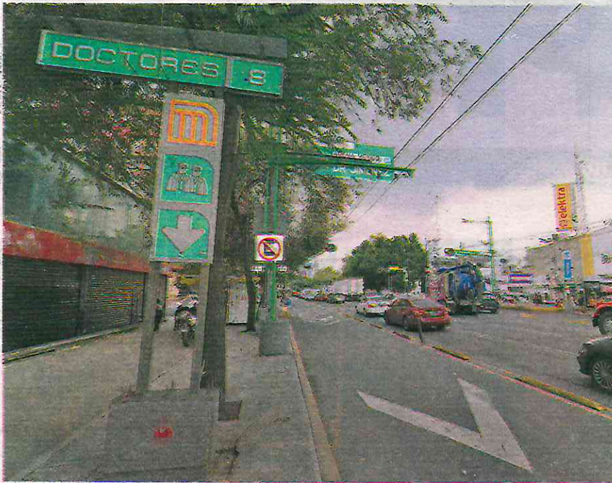
Policías continúan con las labores de inteligencia a fin de detectar otros lugares que son considerados como puntos de venta de droga

Como parte de las Investigaciones, un grupo de agentes de la Policía de Investigación de la Fiscalía General de Justicia de la CdMx y de inteligencia de la Secretaría de Seguridad Ciudadana tienen identificados a algunos de los integrantes del grupo criminal que opera en esas colonias de la alcaldía Cuauhtémoc.