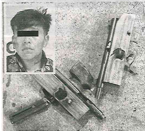
Llevaban dos subametralladoras