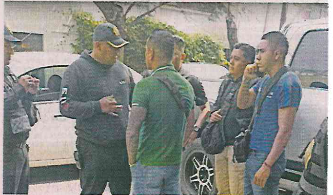
Los elementos que pretendían apoyar en la acción ilegal no llevaban uniformes.