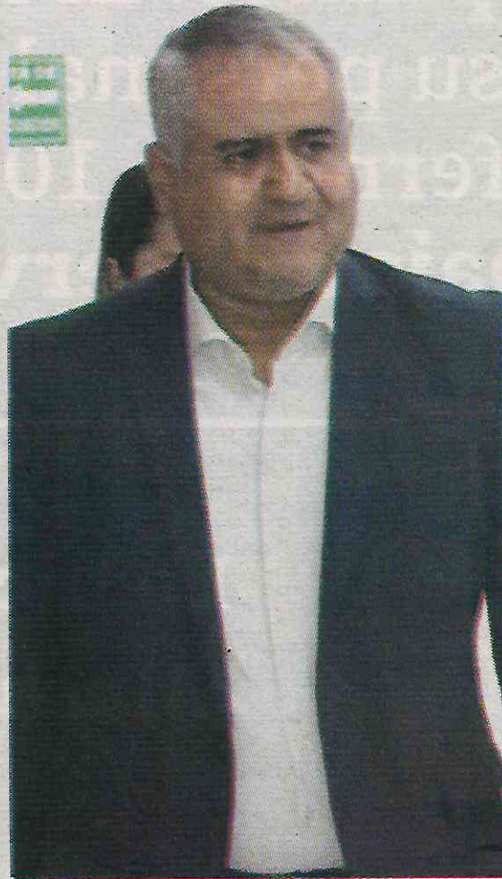
Tuvo los peores resultados en su prevención

Encima, en cuanto a los casos detectados por kilómetro cuadrado, esta zona figuró con 89.4, 81.9, y 86.7, en mayo, junio y julio respectivamente. Lo anterior contrasta abismalmente con las otras 15 alcaldías, pues inmediatamente abajo esta