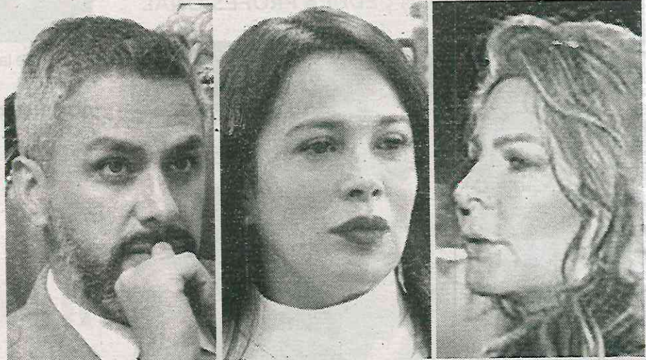
Lograron la suma de los diputados emanados de sus adversarios políticos