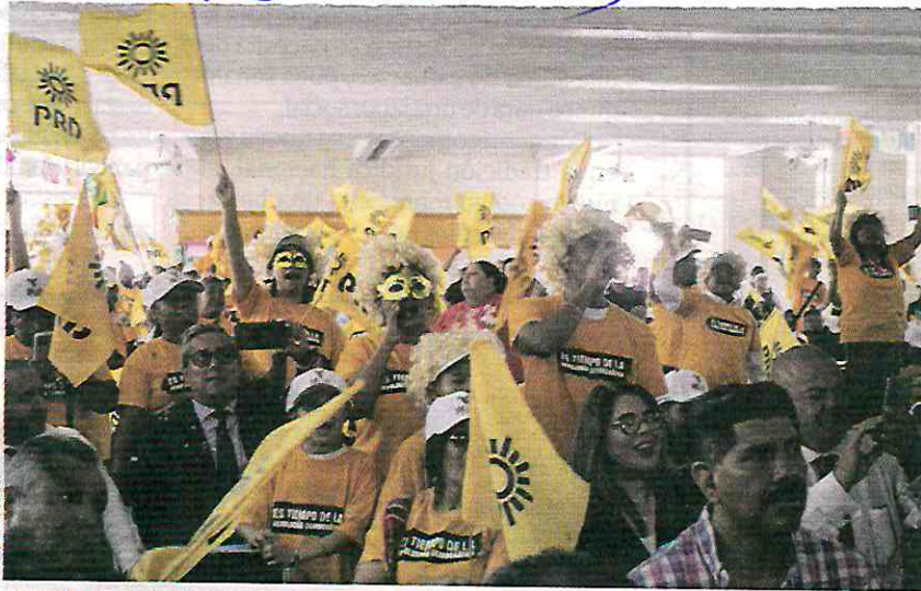
SIMPATIZANTES del PRD durante un mitin de Santiago Taboada, el 4 de marzo.