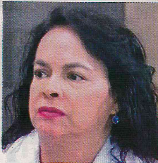
Vecinos dicen que la panista les miente

Por si fuera poco, la administración panista se ha