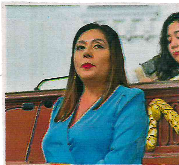
La diputada Xóchitl Bravo Espinosa, vicecoordinadora de la asociación parlamentaria Mujeres Demócratas

nosa consideró que este nuevo código impactará positivamente en la vida de la población de la capital y el país, al brindar seguridad jurídica a las entidades y contribuir a la cohesión social, estabilidad interinstitucional y desarrollo democrático de la sociedad.