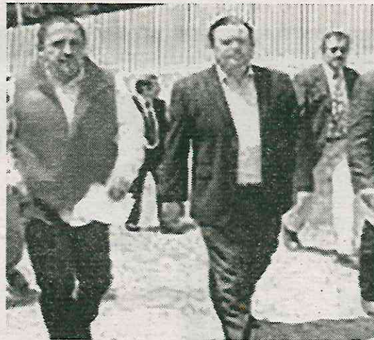
Rebasó la fecha límite para entregar proyectos

Desde principios de año el gobierno de Quijano Morales tuvo problemas con la entrega de obras públicas, entre las que destacan supuestos arreglos a los andadores, reparaciones de la red hidráulica, trabajos de pavimentación y reencarpetado, así como la entrega de una base de camiones de la Red de Transporte de Pasajeros (RTP). De acuerdo con los contratos públicos disponibles, estos trabajos