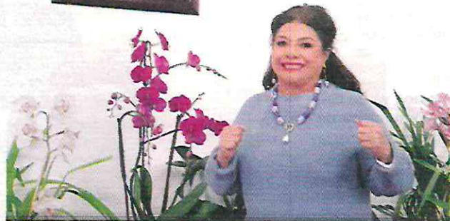
Imagen Captura de vídeo

"Estoy segura que, en este mes, vamos a poder dar resultados. Tenemos mucha Presidenta", dijo Brugada Molina.