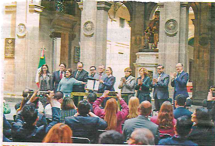
EDOMEX. La presidenta Claudia Sheinbaum y Delfina Gómez firman convenio.