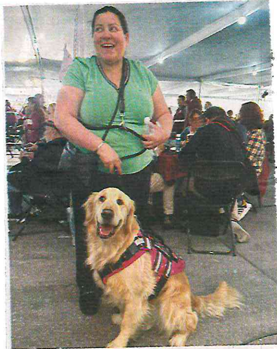
• CASO. Asistió con Millo a un Zócalo Ciudadano.