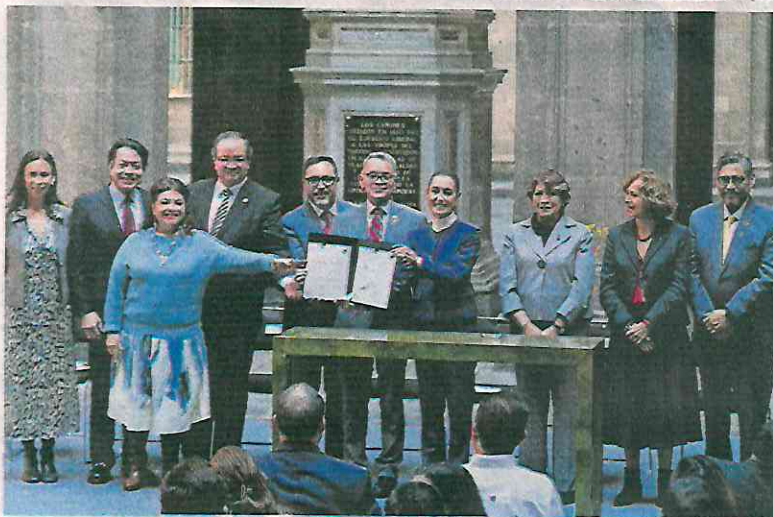
En Palacio Nacional, la presidenta Claudia Sheinbaum encabezó la presentación del Nuevo Sistema de Bachillerato Nacional para Todas y Todos.

aumentará la oferta educativa de la UNAM tanto en la Escuela Nacional Preparatoria como en el CCH.