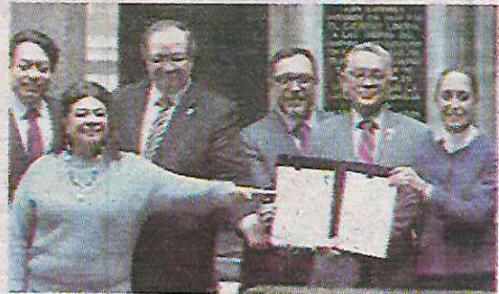
Destacó trabajo de la presidenta

En este punto en particular se estima que cada año ingresan al país entre 213 mil y 230 mil armas de fuego de manera ilegal. En la última década se calcula que llegaron a México, ilícitamente 2.5 millones de armas. La jefa de Gobierno también respaldó a la presidenta en “su firme decisión” para proteger la economía de México y con