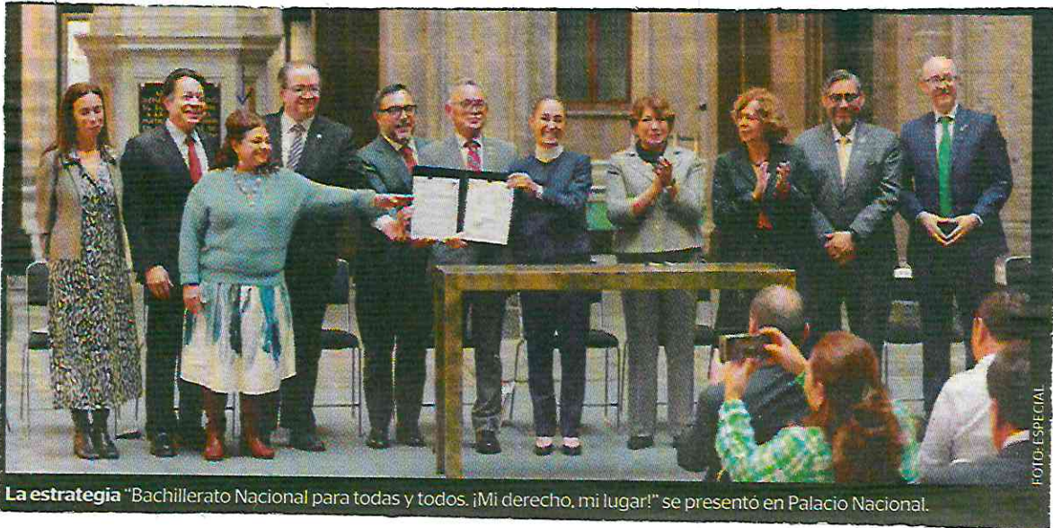
La estrategia "Bachillerato Nacional para todas y todos. ¡Mi derecho, mi lugar!" se presentó en Palacio Nacional.

Claudia Sheinbaum Pardo Presidenta de México