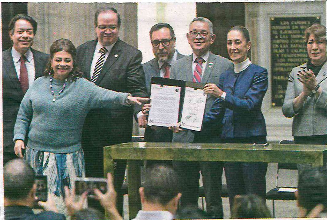
• EDUCACIÓN. La Presidenta encabezó firma con funcionarios rectores y gobernadores.