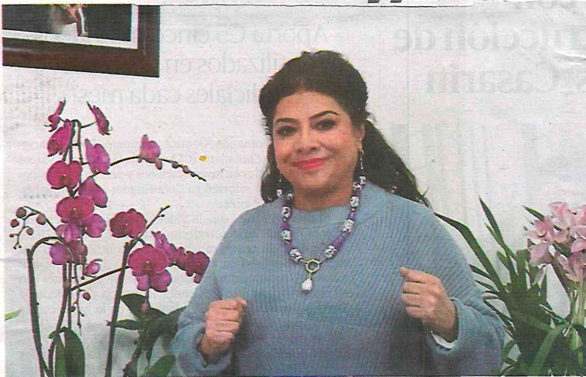
La jefa de Gobierno reiteró su apoyo total y máximo reconocimiento a Claudia Sheinbaum.

Quiero reconocerla por tres razones fundamentales: su liderazgo, inteligencia y fortaleza en la defensa de México; por colocar en la agenda bilateral el compromiso de Estados Unidos de evitar el tráfico de armas de alto poder